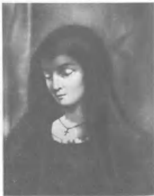
Варвара Лопухина. Акварель Лермонтова