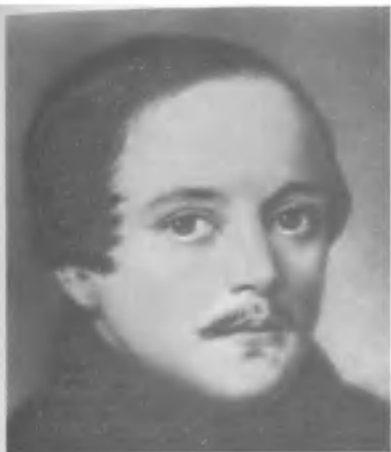
М. Ю. Лермонтов. Худ. П. Е. Заболотский