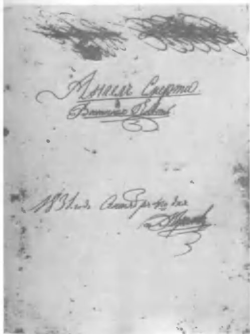
«Ангел смерти». Обложка. Автограф Лермонтова