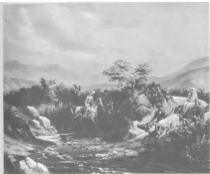
Кавказский вид. Картина Лермонтова