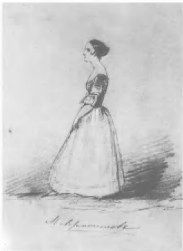
Рисунок Лермонтова в альбоме Солнцевых