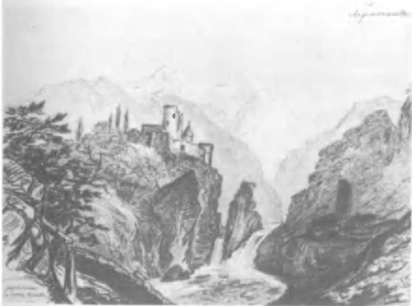
Развалины на берегу Арагвы в Грузии.