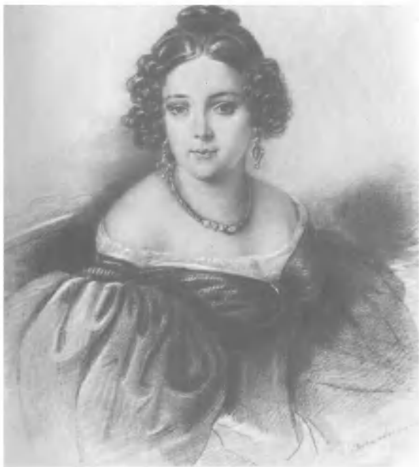
Н. Ф. Иванова Рис. В. Биннемана