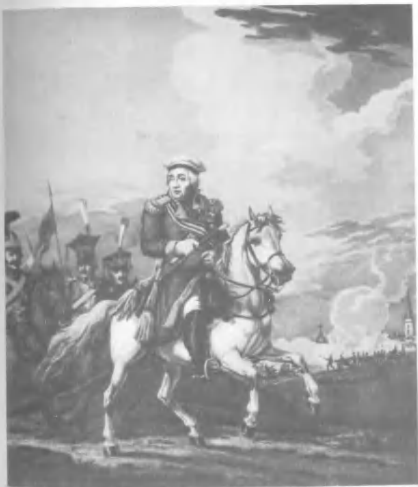
М. И. Голенищев-Кутузов. Гравюра А. Карделли по рисунку А. Орловского.