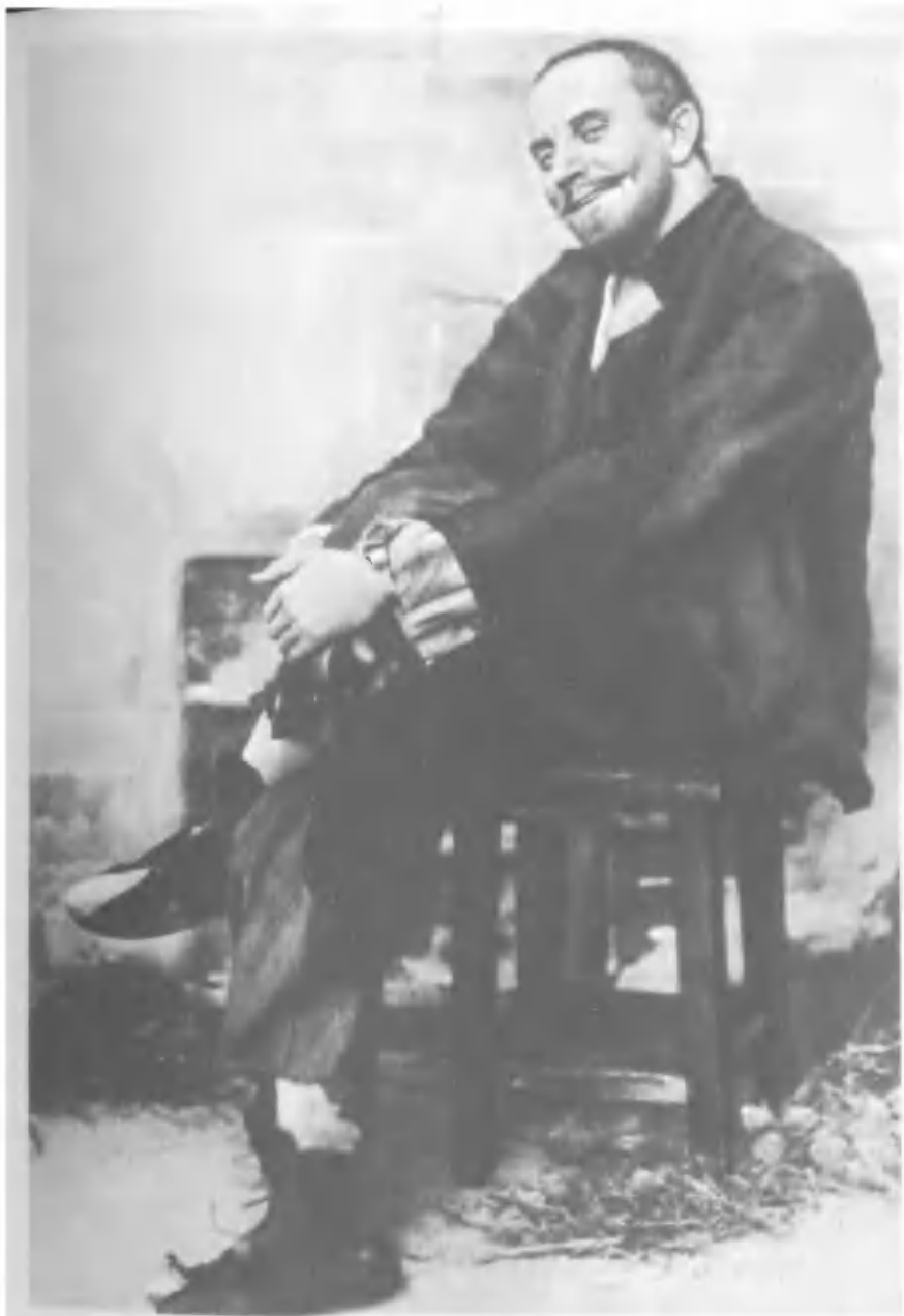
В. И. Качалов в роли Барона в спектакле Московского Художественного театра «На дне»