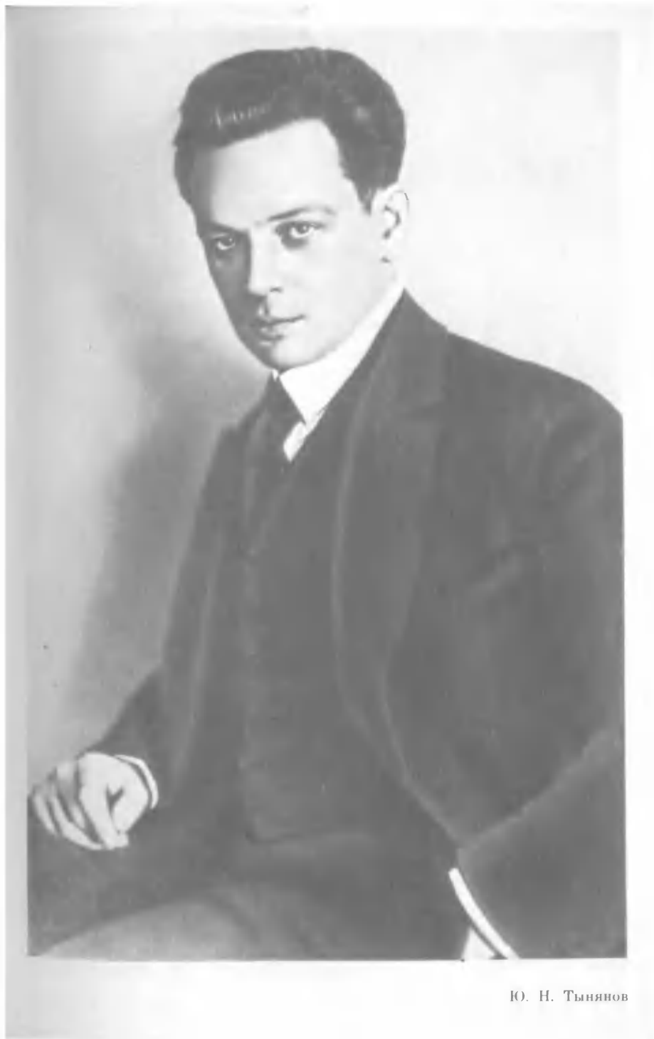
Ю. Н. Тынянов