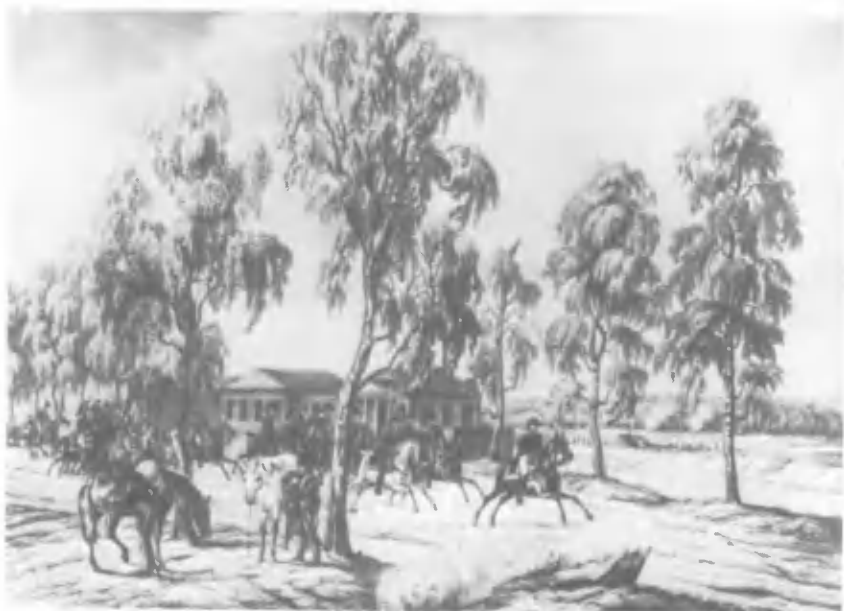
Французская кавалерия на пути к Островно. Литография А. Адама