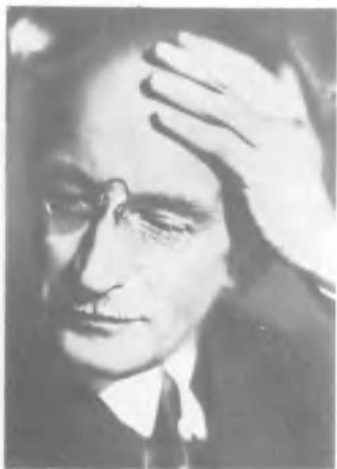
Б. М. Эйхенбаум