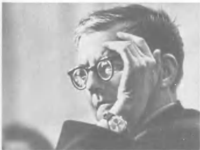
Д. Д. Шостакович