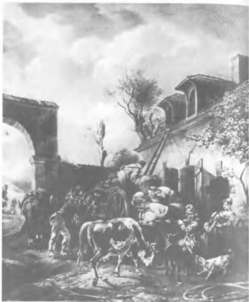
Беженцы. Литография начала XIX века