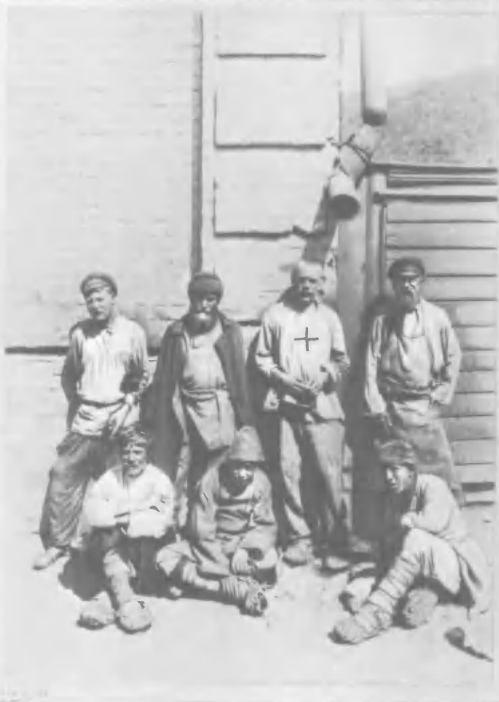
Фотография М. П. Дмитриева с пометой М. Горького: «Барон Бухгольц, босяк. Грим и костюм для Барона»

+ Барон Бухгольц, босяк грим и костюм Барона №19