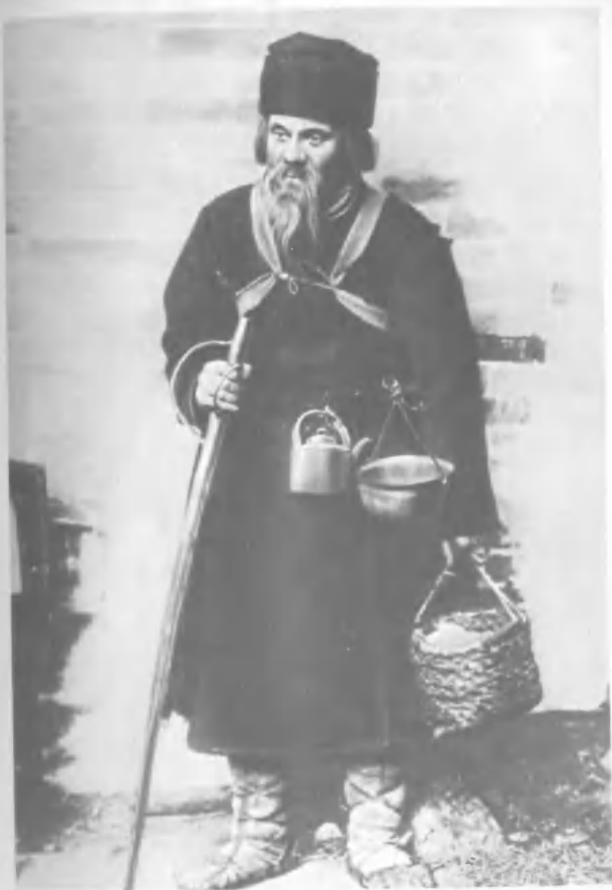
И. М. Москвин в роли Луки в спектакле Московского Художественного театра «На дне»