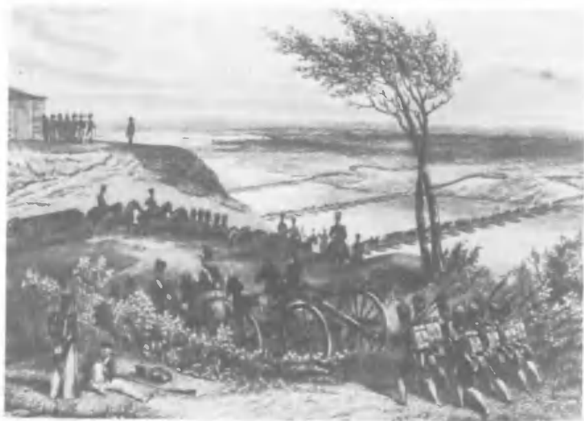
Переход французской армии через Неман. Гравюра Ш. Жирардэ