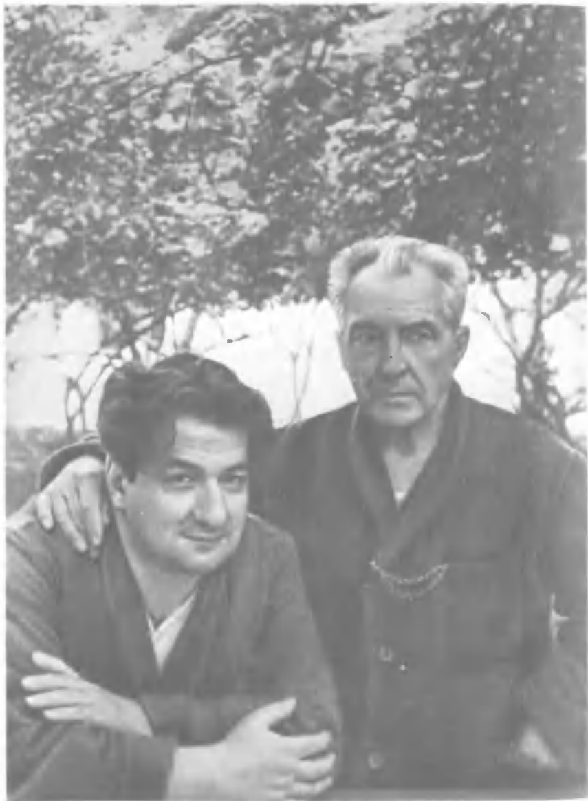
А. А. Остужев (справа) и И. Л. Андроников. 1949