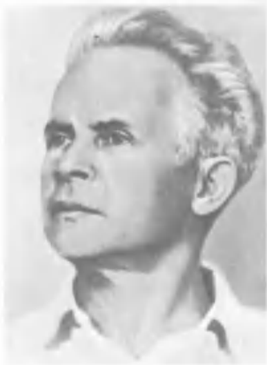
А. П. Довженко

А. Н. Толстой в Ярославле. Рядом с Толстым — Н. С. Патоличев