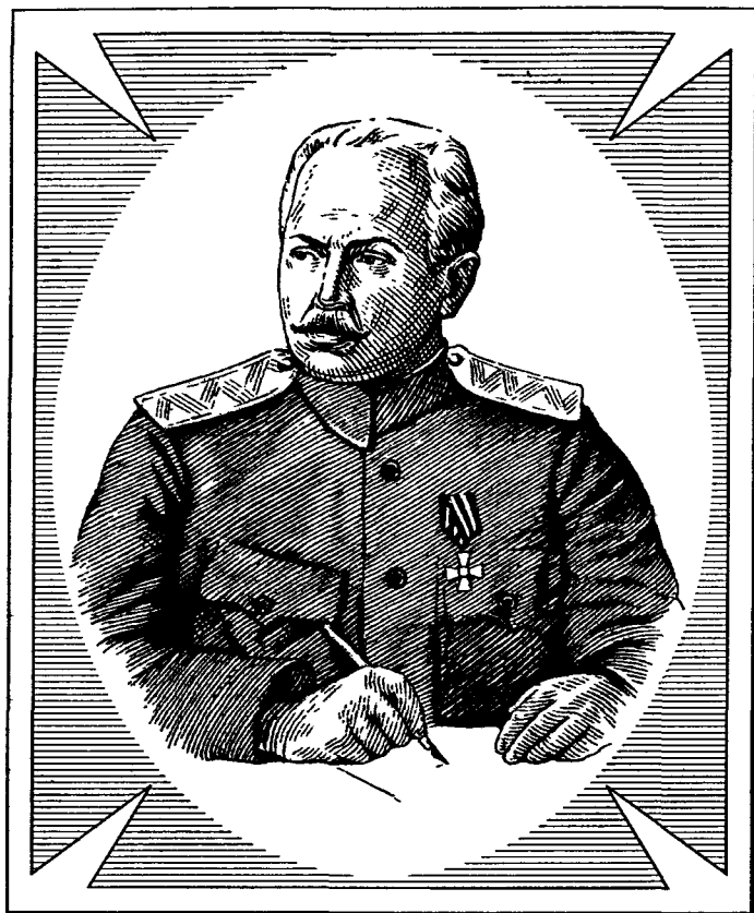
КРАСНОВ Петр Николаевич 1869–1947