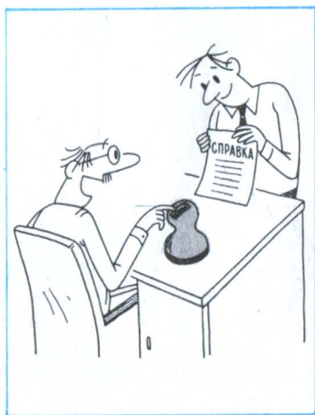
Рисунок Ю. Афонина