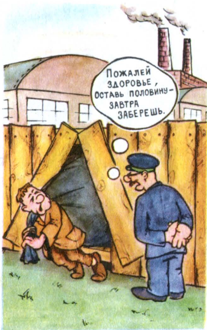
Рисунок В. Владова