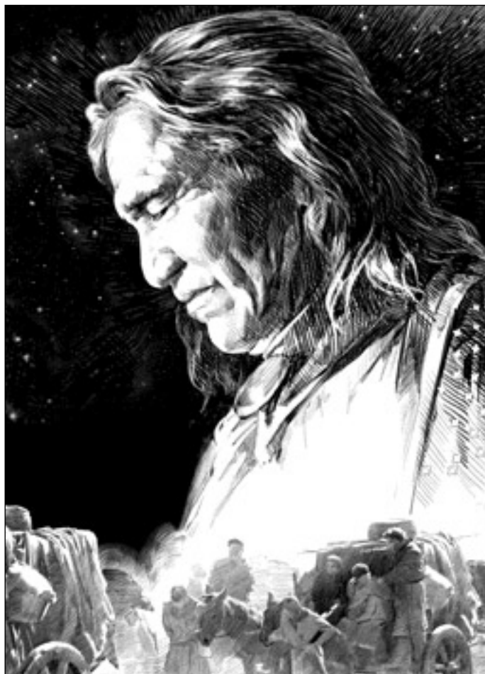
Иллюстрация Владимира БОНДАря