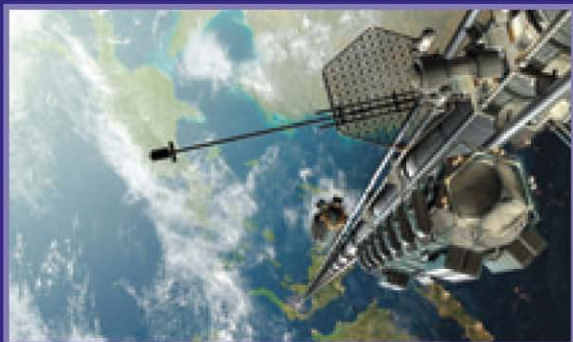
Космический лифт НАСА (современная реконструкция)