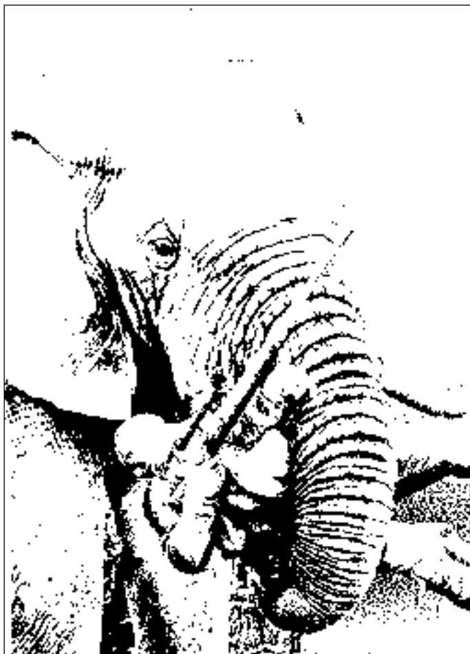
Иллюстрация Сергея ШЕХОВА