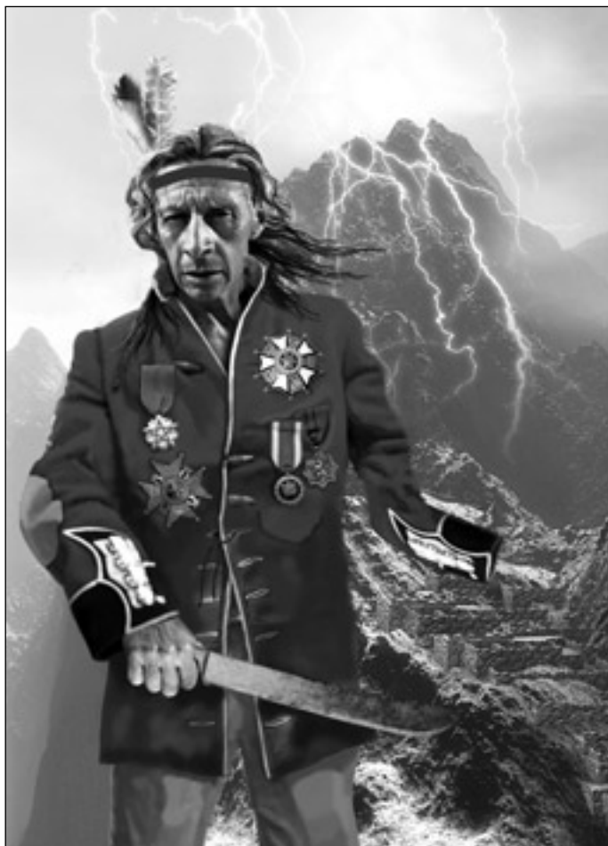
Иллюстрация Игоря ТАРАЧКОВА