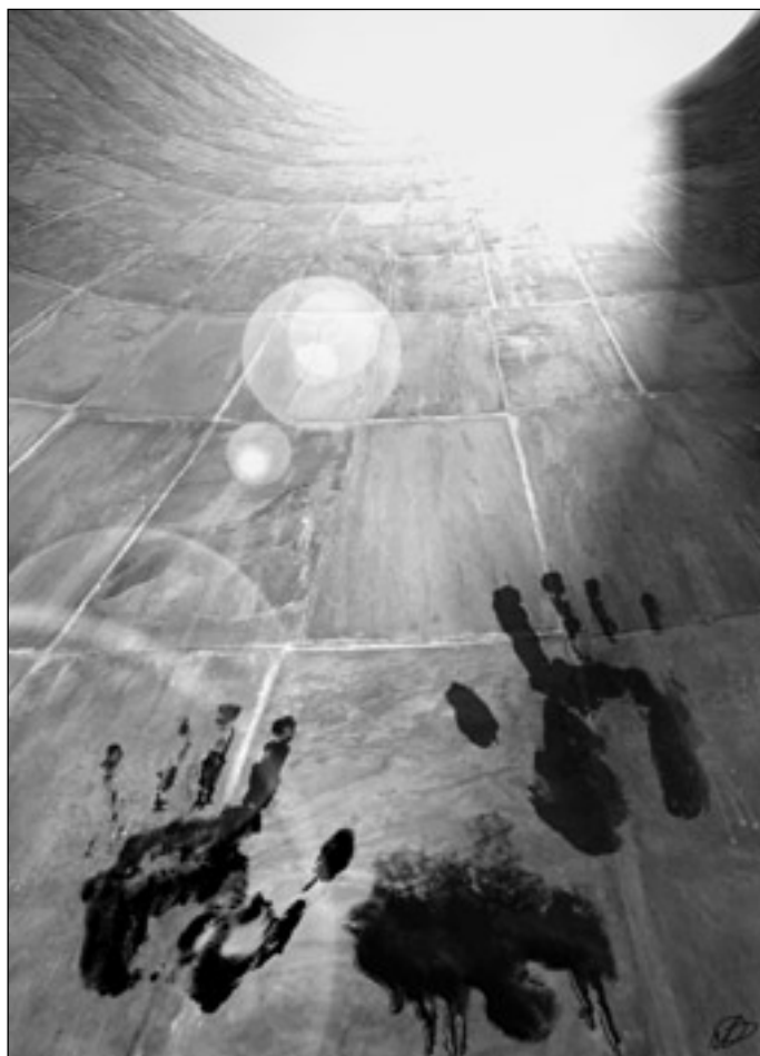
Иллюстрация Людмилы ОДИНЦОВОЙ