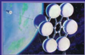
Космический лифт в представлении художников А.Аеонова и А.Соколова (1967)

...один смелый русский инженер придумал систему, которая сделает ракету устаревшей.