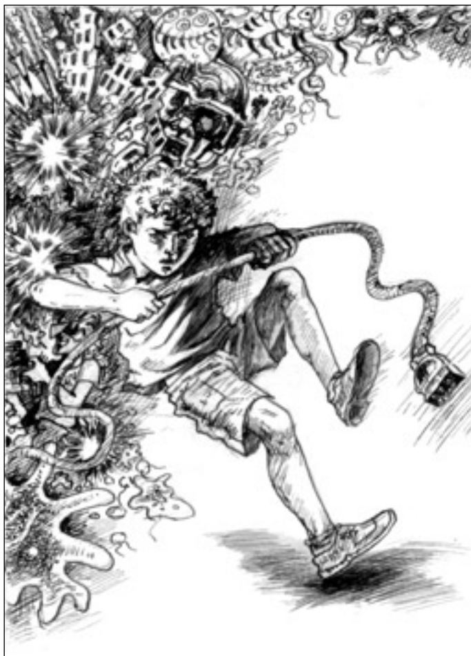
Иллюстрация Владимира Овчинникова