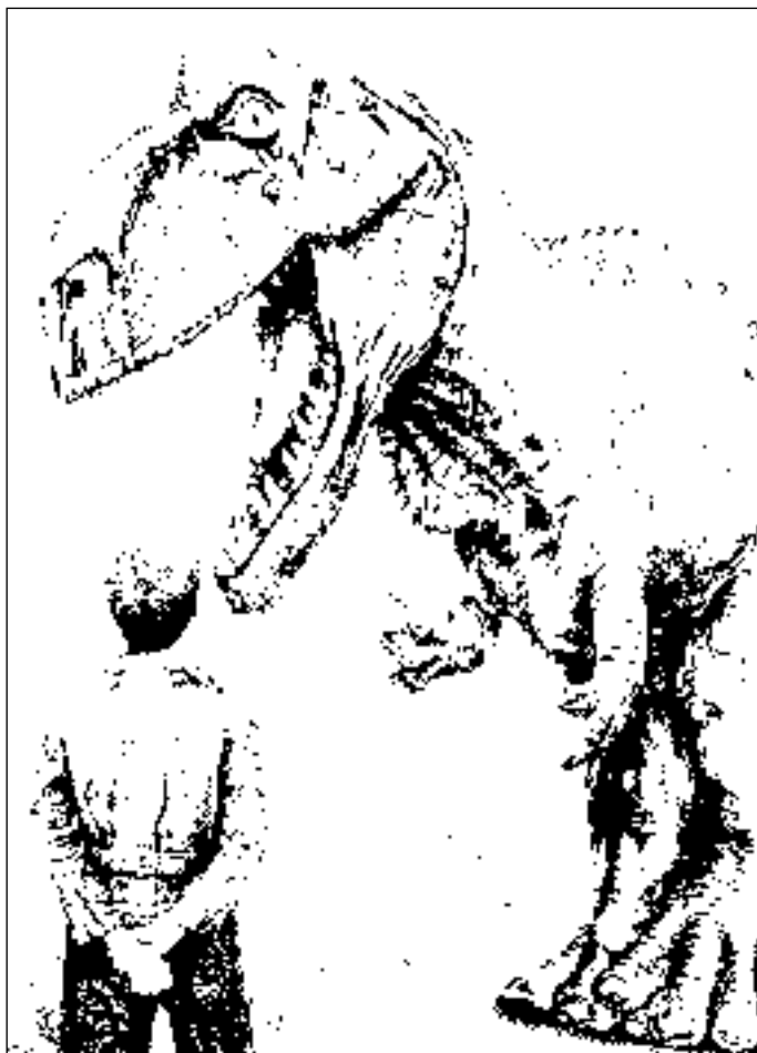
Иллюстрация Сергея ШЕХОВА