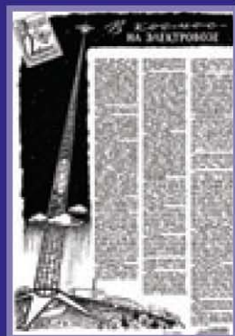
Оригинальная публикация первой статьи Юрия Арцутанова о космическом лифте (1960)