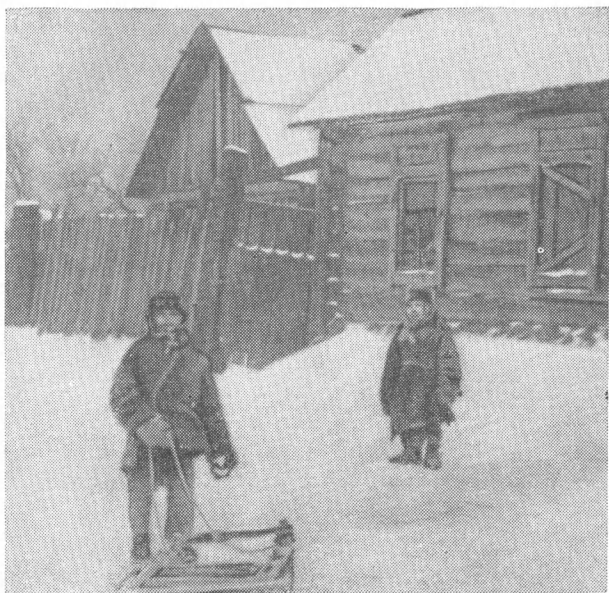
Дети деревни, разграбленной и разоренной фашистами

«нового порядка» гарантируют им защиту от «агентов НКВД».