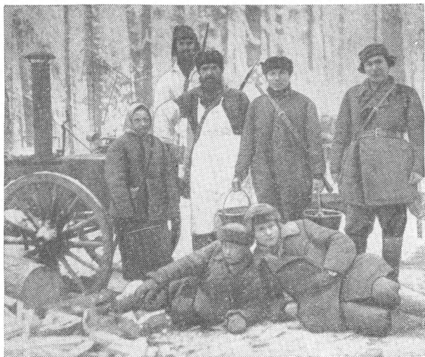
Кухня партизанского отряда

ня сразу назначили командиром взвода. Службу нес исправно.