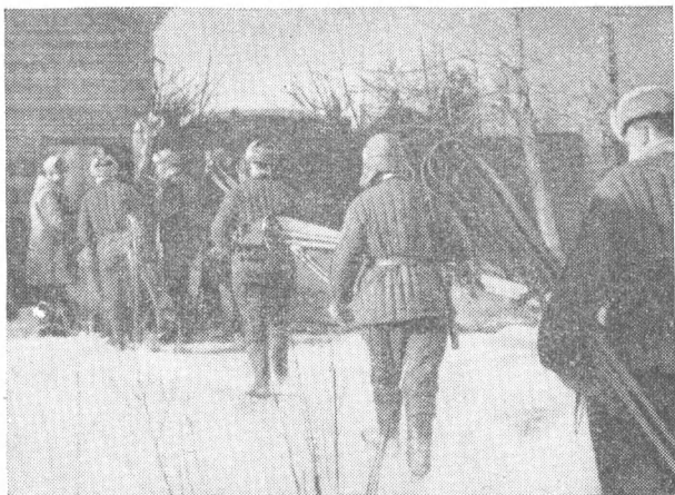
Партизанский край. Группа подрывников возвращается с задания на базу

требили в боях около восьми тысяч вражеских солдат и офицеров.