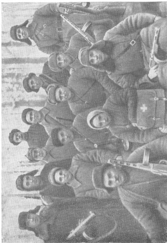
Группа комсоства партизанского отряда Трубчевского района