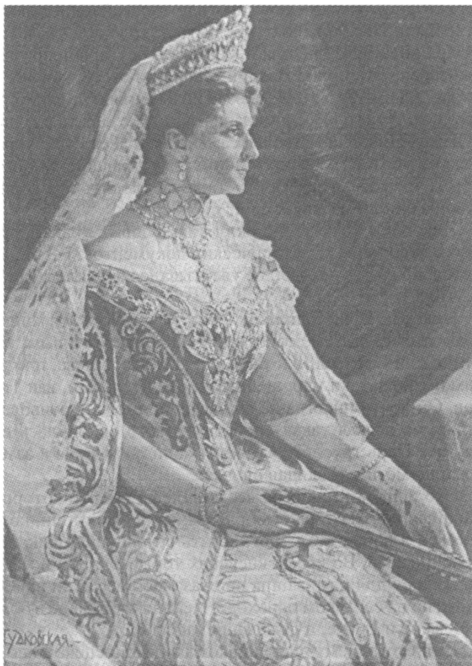
Императрица Александра Федоровна, жена императора Николая II