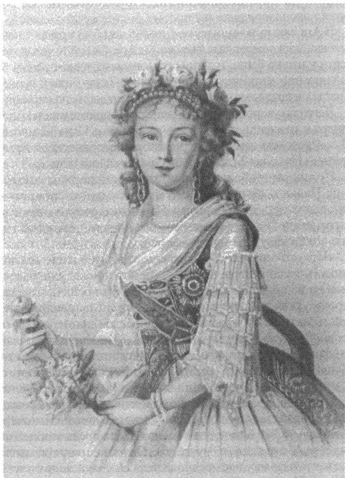
Императрица Елизавета Алексевна, жена императора Александра I