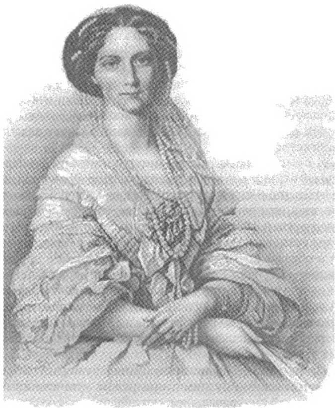
Императрица Мария Александровна, жена императора Александра II