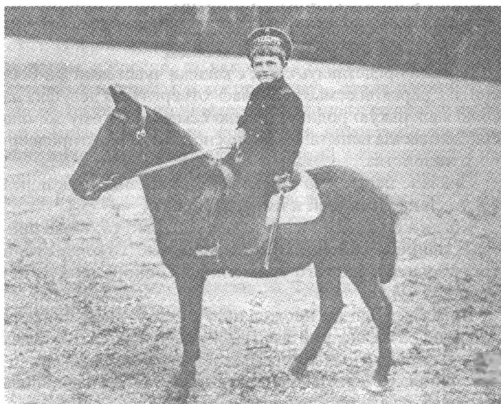
Цесаревич Алексей на пони. Царское Село. 1909 г.