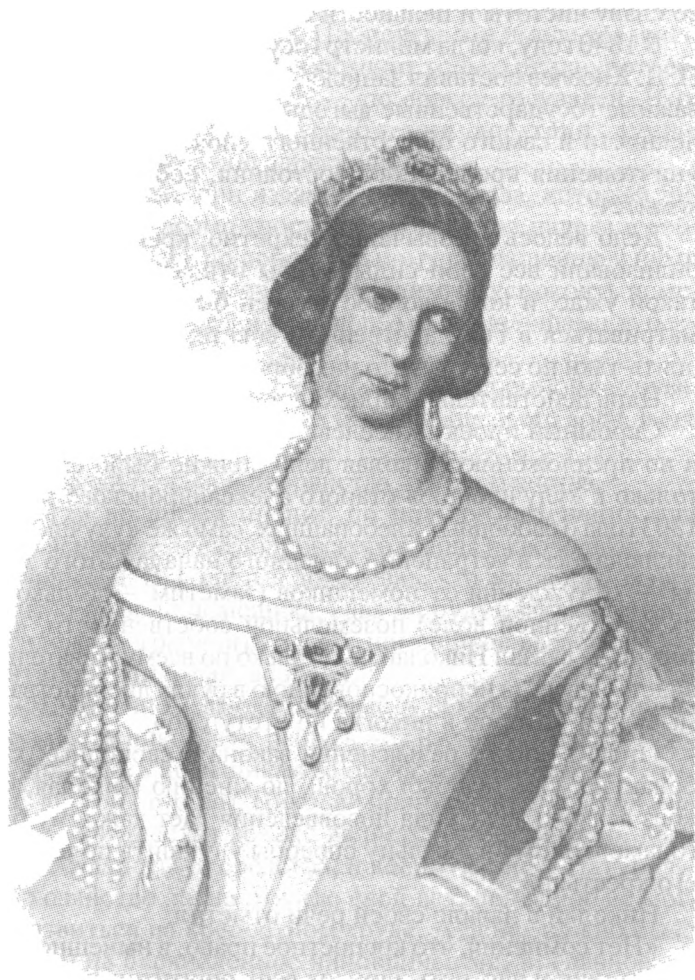
Императрица Александра Федоровна, жена императора Николая I