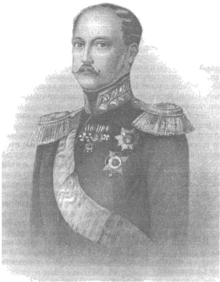
Император Николай I Павлович