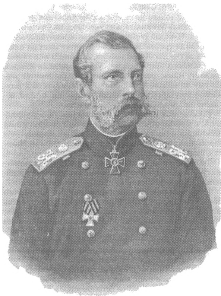
Император Александр II Николаевич