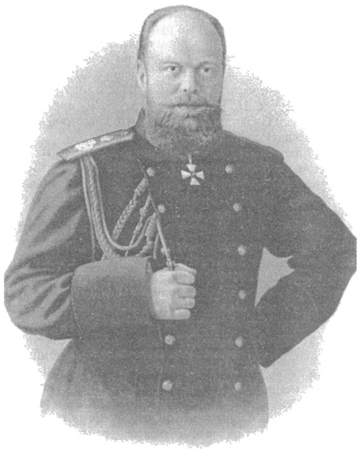
Император Александр III Александрович