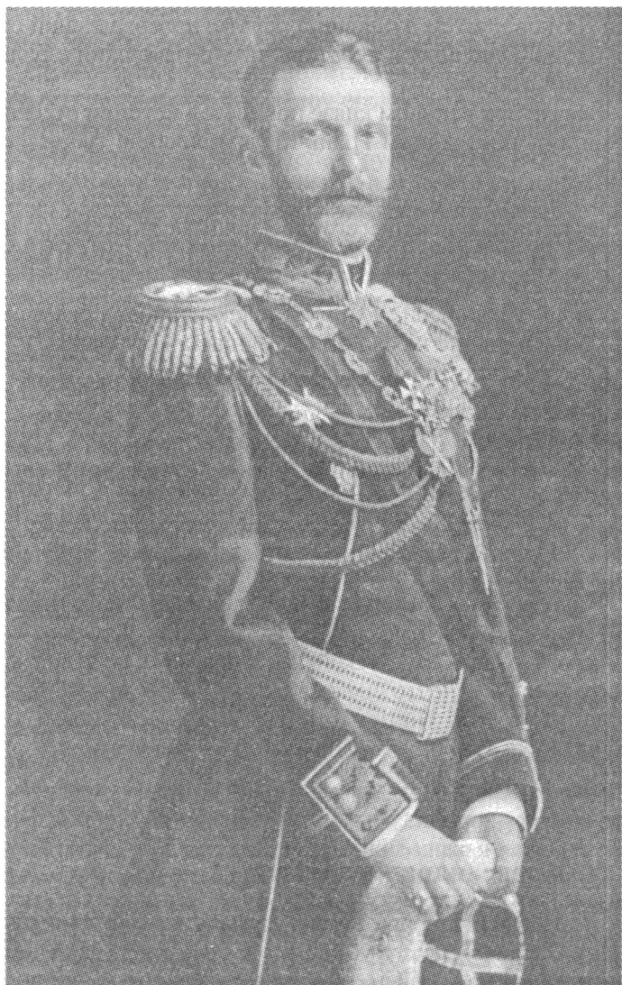
Великий князь Сергей Александрович