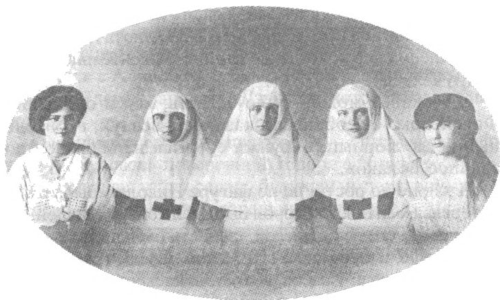
Императрица Александра Федоровна с дочерьми. Петроград. 1915 г.