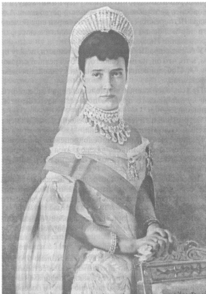
Императрица Мария Федоровна, жена императора Александра III