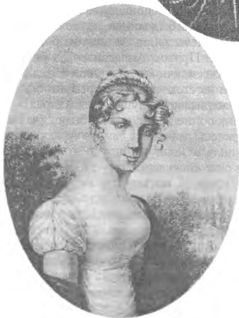
Великий князь Константин Павлович и его вторая жена княгиня Лович (Жанетта Грудзинская)