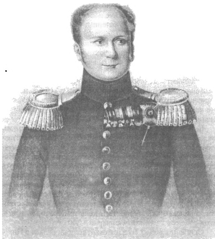
Император Александр I Павлович