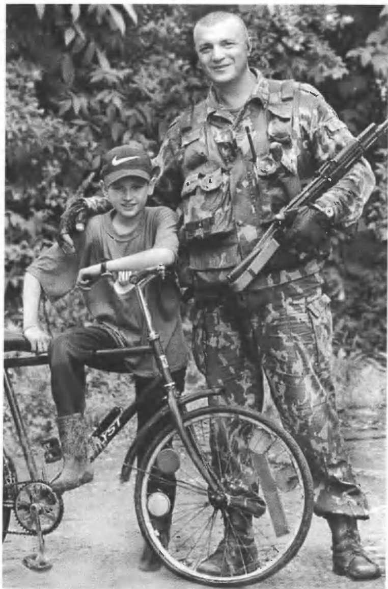
С чеченским мальчишкой. Свои сыновья ждут дома.