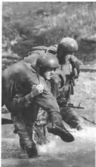
Своих не бросают.