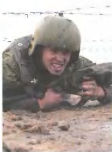
На огненно-штурмовой полосе.