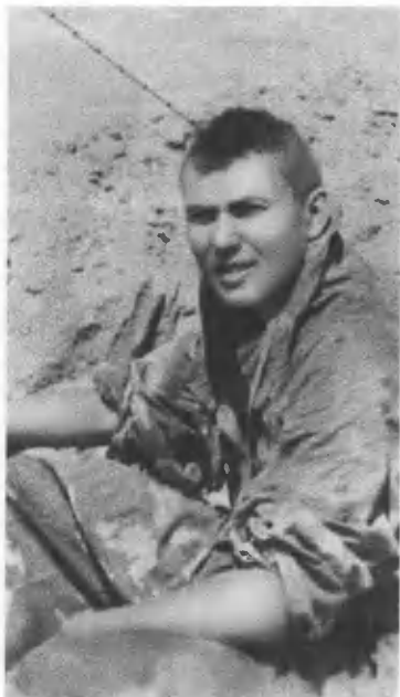
Фото из Афгана.