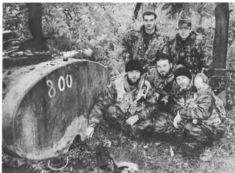
Среди трофеев — мини-завод.