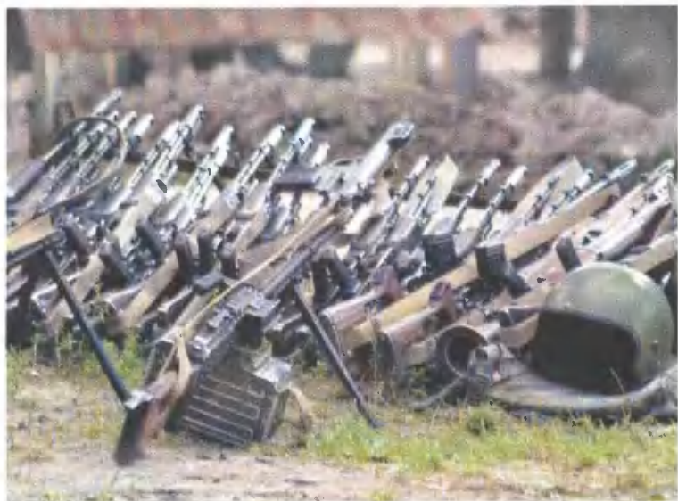
Оружие «на привале».