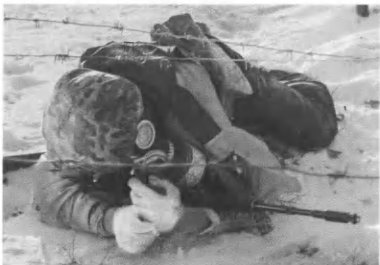
На зараженном участке.