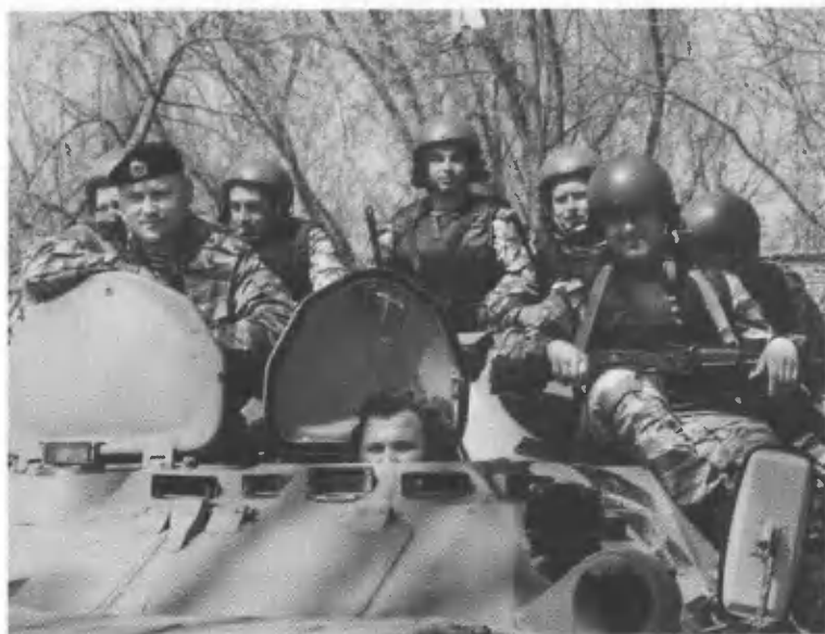
К выходу готовы.