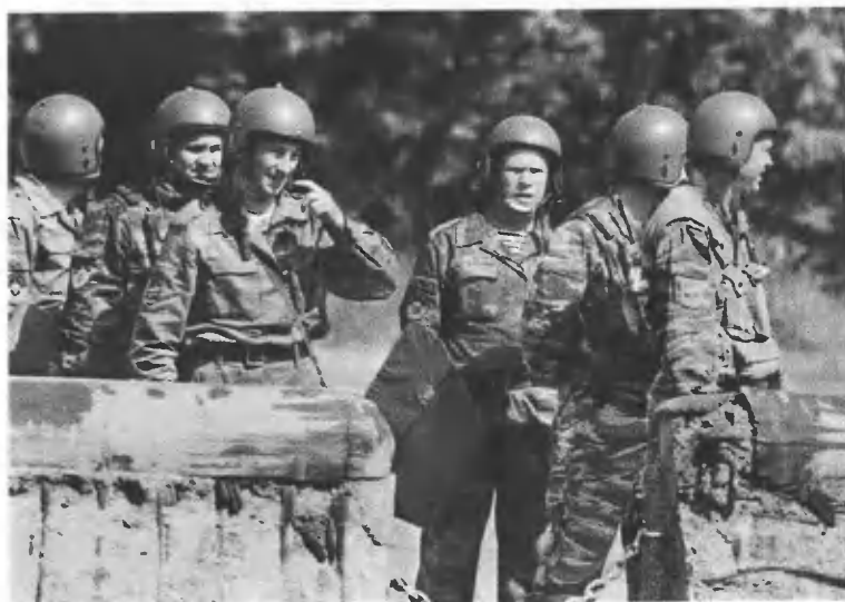
На милицейских учениях.