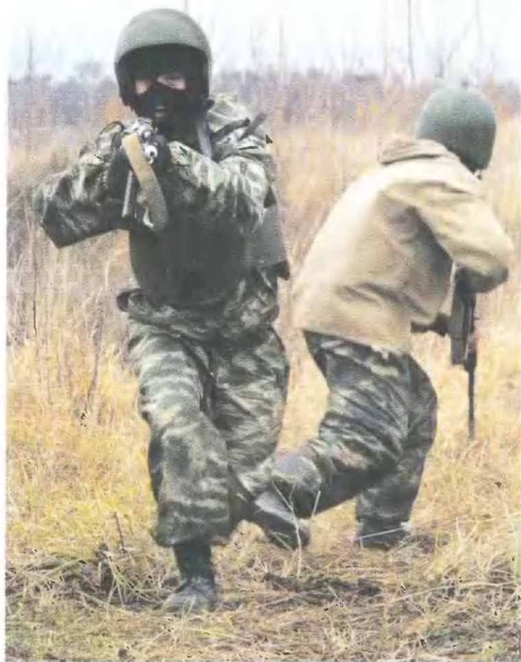
На полевом выходе.