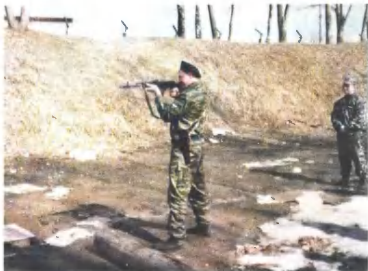
На базе СОбРа.