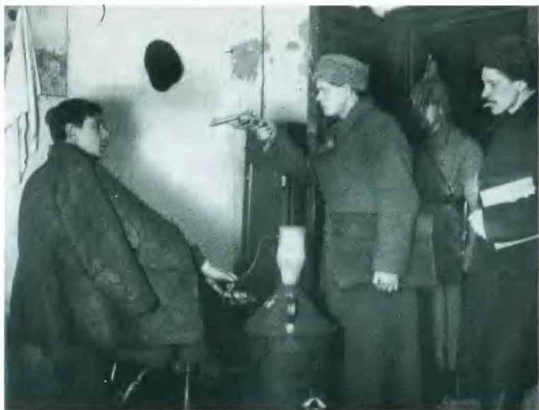
Арест самогонщика. Фото 1920-х гг.

«Интересно, на какие средства вы это устроили?» Рисунок К. Ротова. 1928.