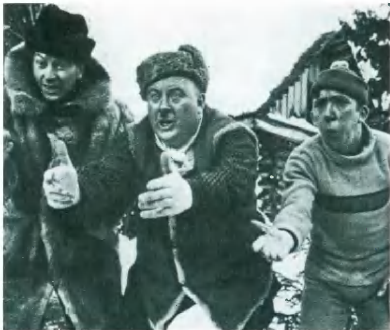
Г. Визин, Е. Моргунов, Ю. Никулин в фильме «Самогонщики». 1961.