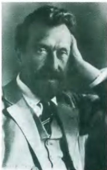
А. И. Рыков, председатель Совнаркома. Фото середины 1920-х гг.