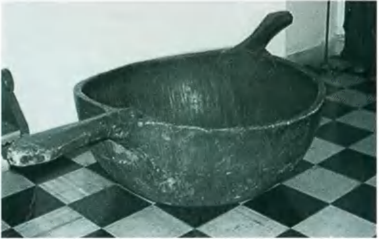
Лохань для творения пива.