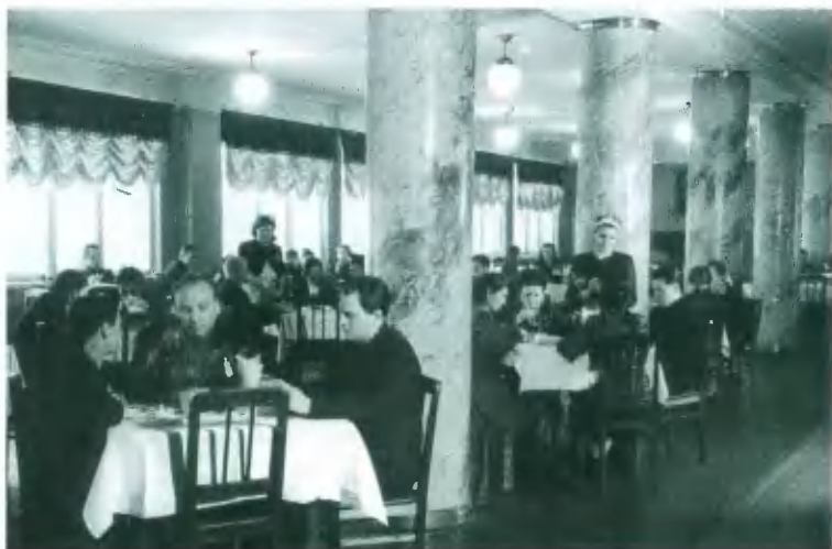
Ресторан. Фото середины 1930-х гг.