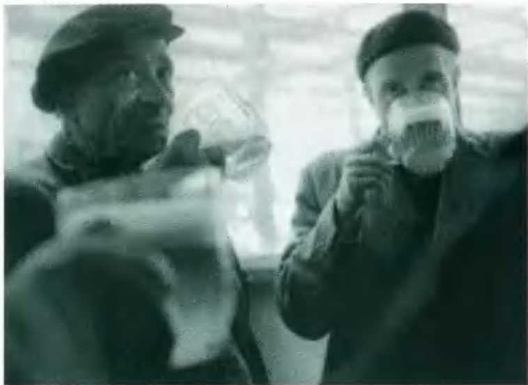
За пивом. Фото 1960-х гг.