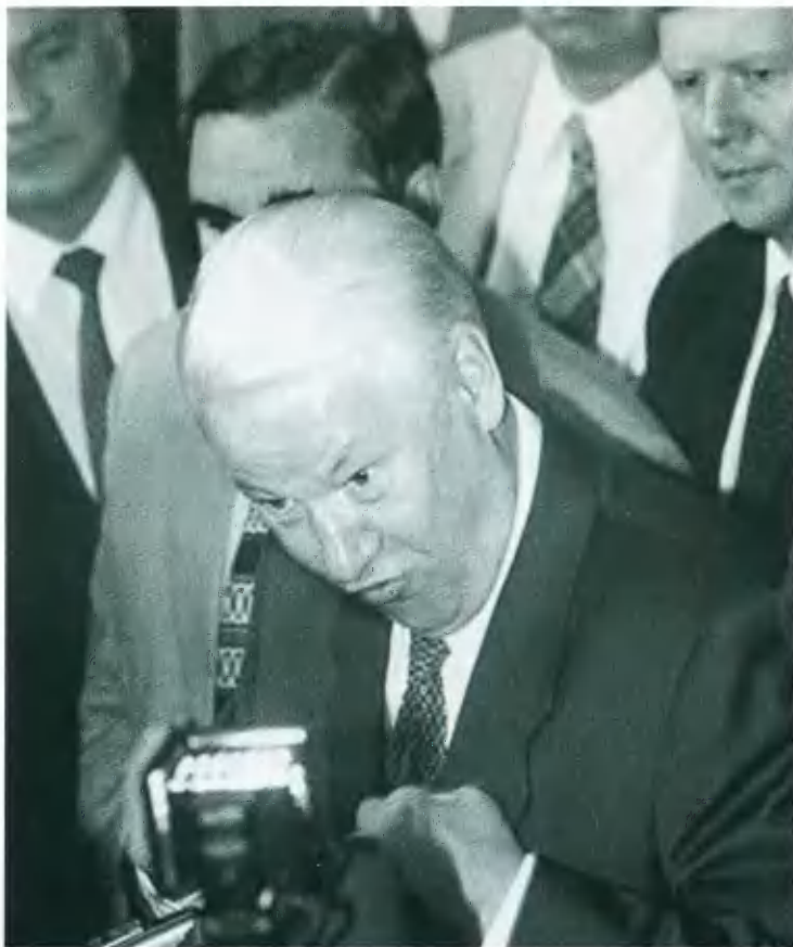
Первый президент свободной России Борис Николаевич Ельцин.

Стакан — мерило русской жизни. Разработан В. Мухиной в 1943 г.