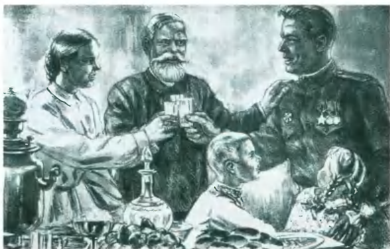
«Дождались!» Плакат в честь Победы. 1945.