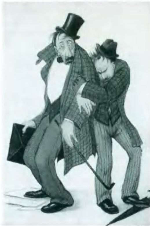
Члены общества трезвости, возвращающиеся с экстренного собрания. Открытка начала XX в.