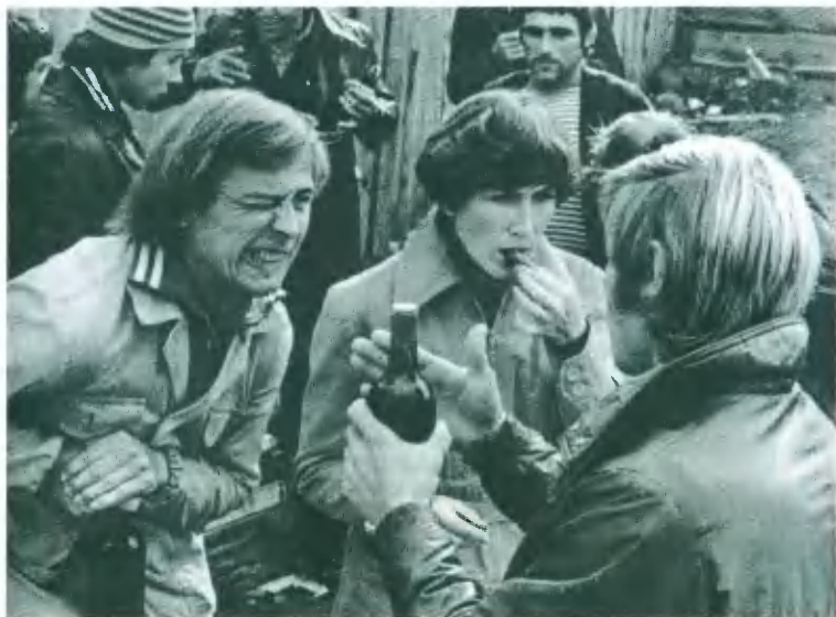
По портвешку? Фото 1987 г.