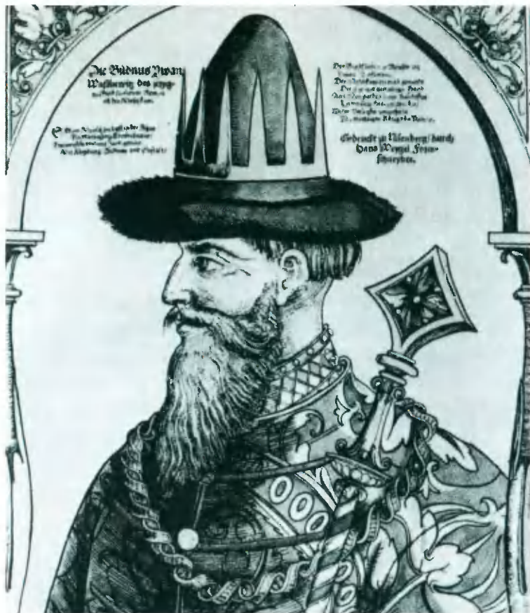
Иван Грозный. Западноевропейская гравюра. Середина XVI в.