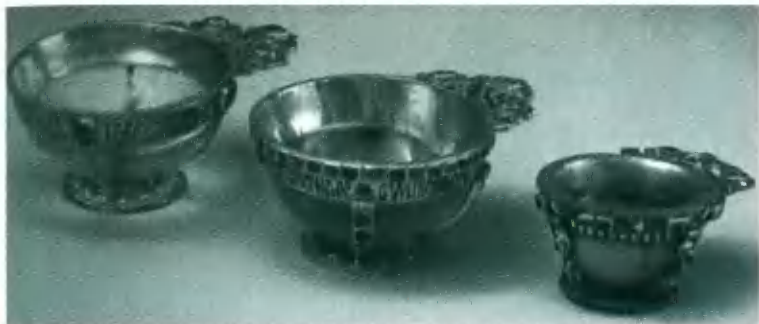
Чарки. XVII в.