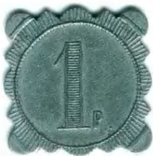
Жетоны ресторана «Метрополь». Начало XX в.