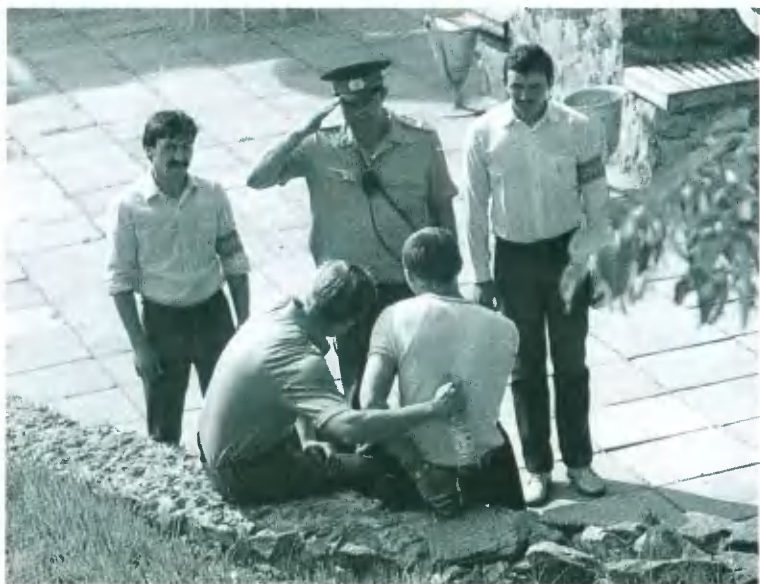
Милиция и дружинники против водки. Фото 1987 г.