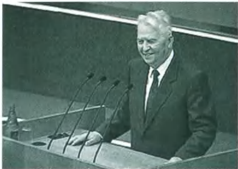
Инициатор борьбы за трезвость Е. К. Лигачев на трибуне.