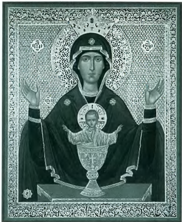
Икона Богородицы «Неупиваемая чаша» (исцеляющая от пьянства), «явленная» в 1878 году в Серпуховском Высоцком монастыре.