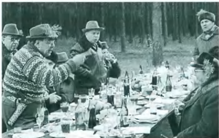
Н. С. Хрущев и Л. И. Брежнев принимают делегацию Югославии. 1963.