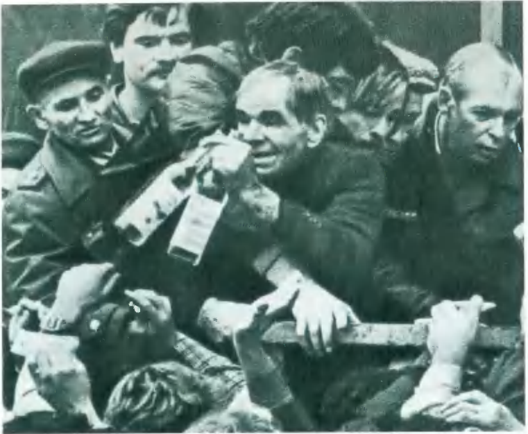
Дефицит. Конец 1980-х гг.