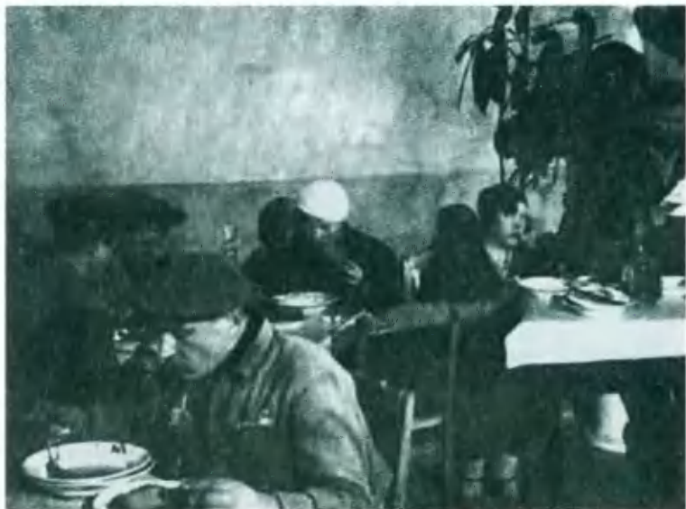
Рабочая столовая. Фото 1920-х гг.