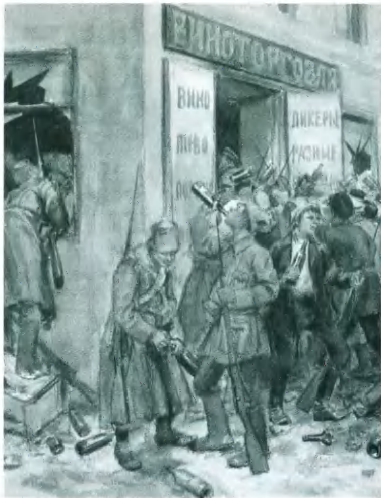
Рабочие и солдаты грабят винный магазин. Петроград. Рисунок И. А. Владимирова. 1919.