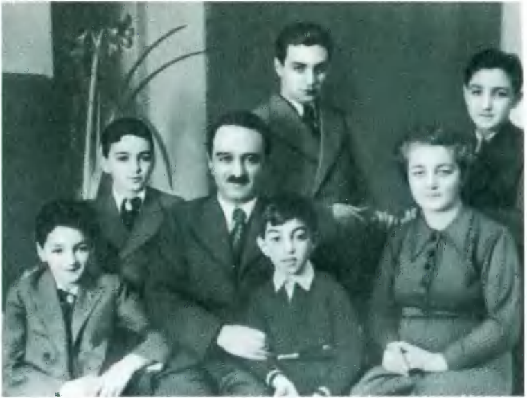
Нарком пищевой промышленности А. И. Микоян с членами семьи. Фото 1939 г.