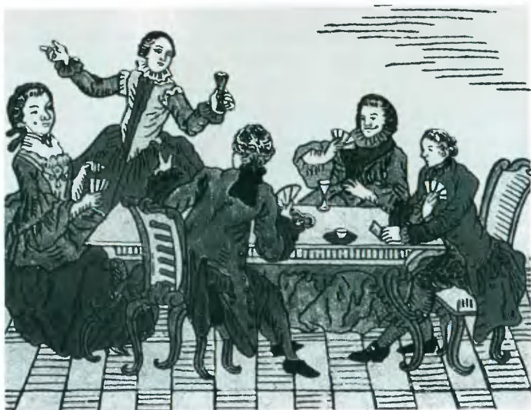
Любовная компания. Лубок середины XVIII в.