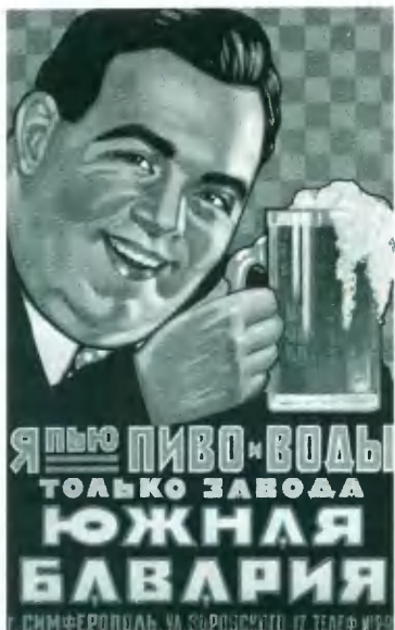
Реклама пива «Южная Бавария». 1928.