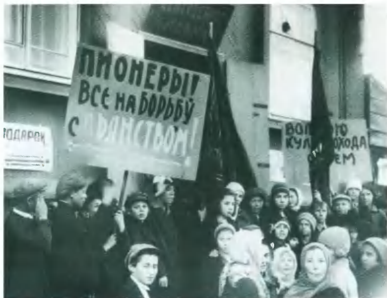
Демонстрация пионеров против пьянства. Фото 1920-х гг.

Антиалкогольные брошюры издательства «Молодая гвардия». 1925—1926 гг.