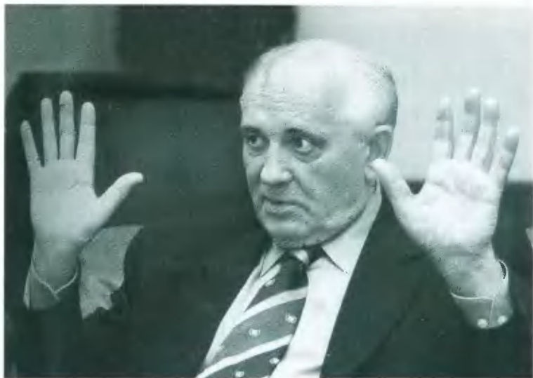
М. С. Горбачев после провала антиалкогольной кампании.

Книги издательства «Молодая гвардия». 1980-е гг.