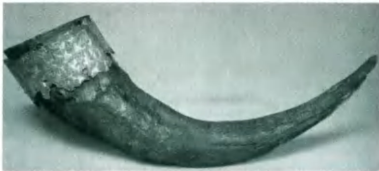
Турий рог из Черной Могилы в Чернигове. X в.