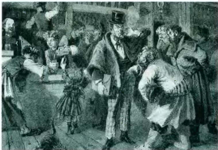
Трактир. «Совещание с “аблакатом”». Гравюра Зубчинова середины XIX в.