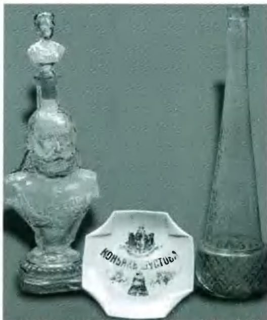
Водочные бутылки и пепельница фирм Шустова и братьев Костеревых. Конец XIX — начало XX в.