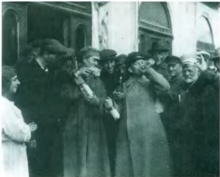
В очереди за водкой у ленинградского магазина. Фото 1920-х гг.