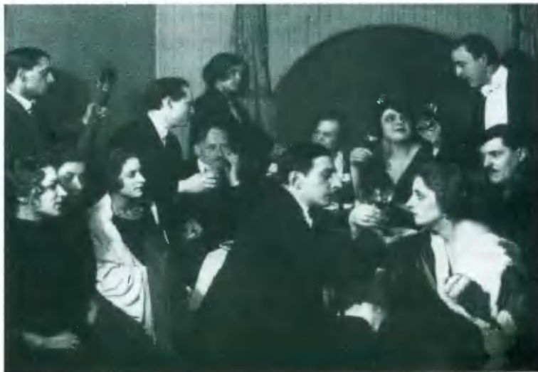
Нэпманы в отдельном кабинете гостиницы «Европейская». Фото 1924 г.