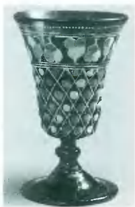
Кубок богемского стекла из захоронения Ивана Грозного. XVI в.