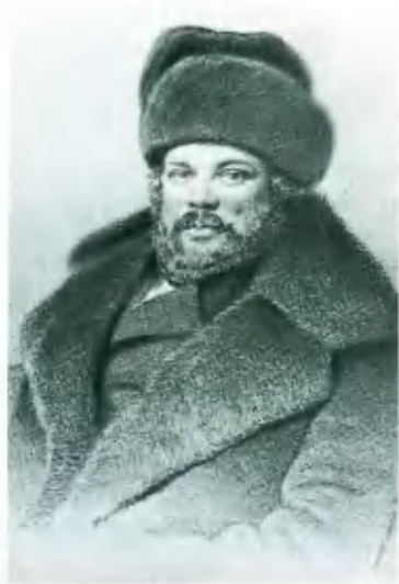
Винный откупщик В. А. Кокорев. Литография В. Тимма. 1856.