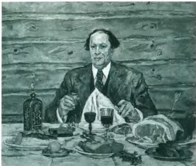
Портрет писателя А. Н. Толстого в гостях у художника. П. П. Кончаловский. 1940—1941 гг.