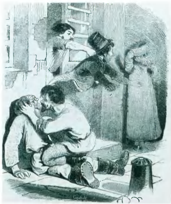
Выход из кабака. Гравюра середины XIX в.