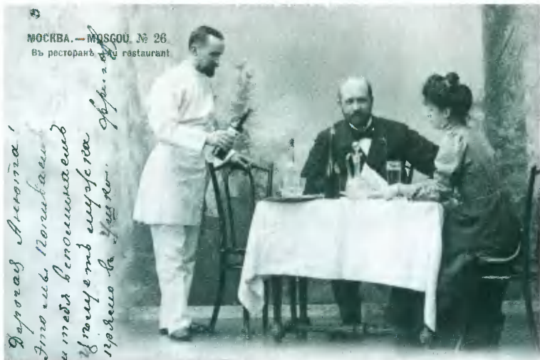
Сцена в ресторане. Открытка начала XX в.