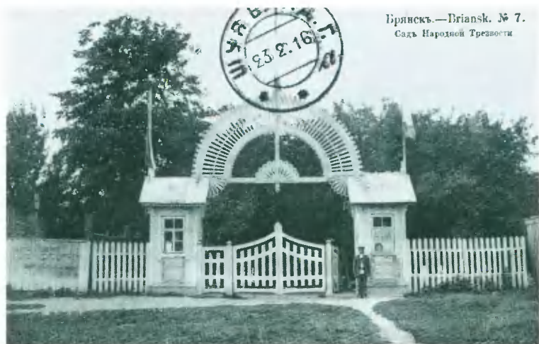
Брянск.—Briansk. № 7. Садъ Народной Трезвости.