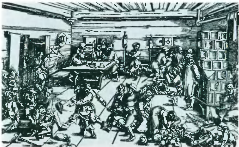
В кабаке. Немецкая гравюра XVI в.