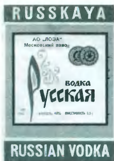
Водочные этикетки. 1980-е гг.