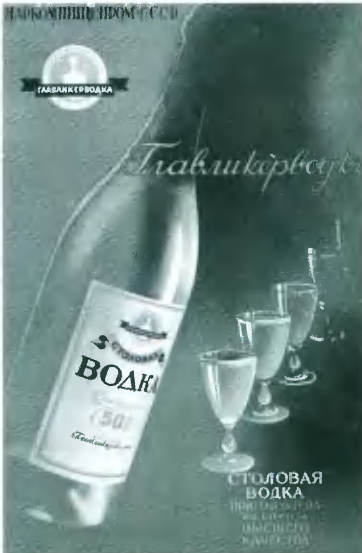
Реклама спиртных напитков. 1938.