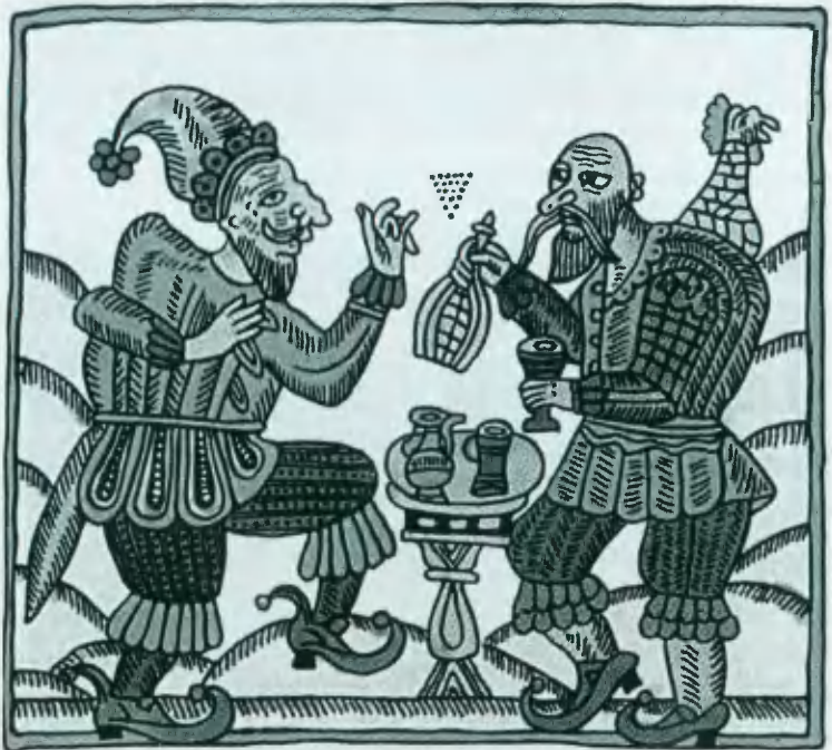
Фома и Ерема. Лубок начала XVIII в.