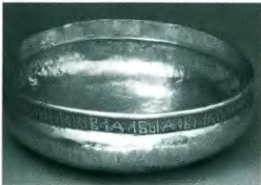
Серебряная чаша князя Владимира Давыдовича. XII в.

Дружинный пир князя Владимира Святославича. Миниатюра Радзивилловской летописи. XV в.