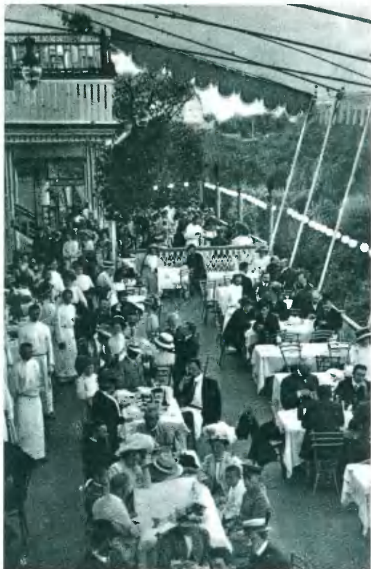
Посетители ресторана «Доминик» на Невском проспекте Петербурга. Фото 1914 г.