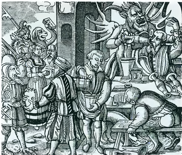
Гравюра с титульного листа брошюры Маттеуса Фридриха против греха пьянства. 1537.