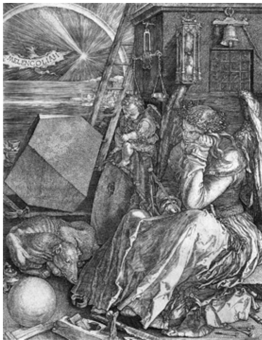
(Альбрехт Дюрер, «Меланхолия», 1514)

Но как сделать один-единственный правильный выбор, когда вариантов бесчисленное множество? Ответ, если он и существует, следует искать не в сферах будущего, а в самом человеке. Все варианты будущего находятся в человеческом воображении.