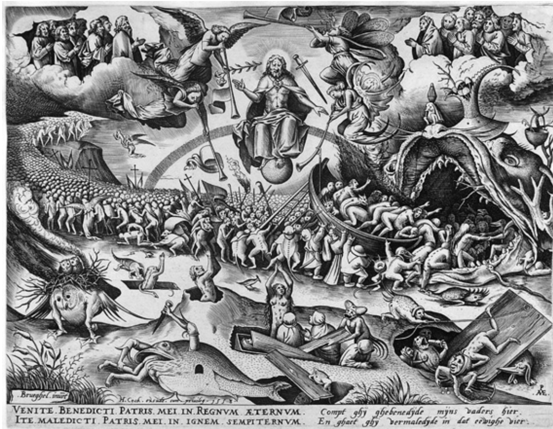
Питер Брейгель Старший «Страшный суд», 1558

Тут для заправки придётся сослаться на газету «THE SUNDAY TIMES» (Англия). Этому газетному сообщению я склонен верить, ибо речь идет всего лишь о шутке испанских и британских учёных, судя по всему людей, которые любят парадоксы и умеют тонко шутить с совершенно серьёзным, невозмутимым видом. Так вот, учёные подсчитали, что в аду, то есть во вместительнице для нераскаявшихся грешников, поддерживается температура 445 градусов по Цельсию. Праведников, которые избавлены от геенны огненной, тоже ожидает довольно знойная погода — 232 градуса.