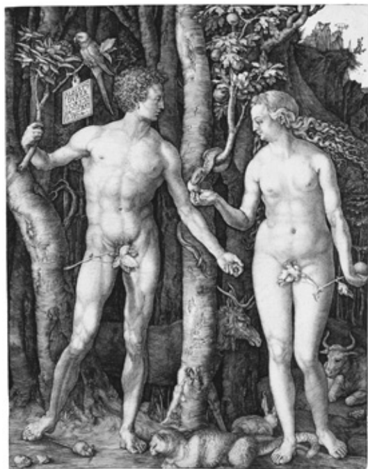
(Альбрехт Дюрер, «Адам и Ева», 1504)

Можно сказать, мы лишь усугубили то, что начал первый человек. Трагедия заключается в том, что, имея возможность выбора, мы не знаем достоверно, к чему приведёт тот или иной вариант. И чем больше вариантов, тем сложнее выбор. У Каина