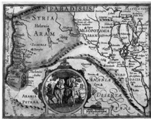
«Рай», карта 1616-го года, Лондон

Так что, похоже, наши энергетические существа не вечно ловят кайф в своем небесном раю между двумя питательными в энергетическом плане ионосферными слоями, а временами спускаются и в более низкие слои атмосферы, и тогда, видимо, происходит то, что именуется феноменом НЛЮ.