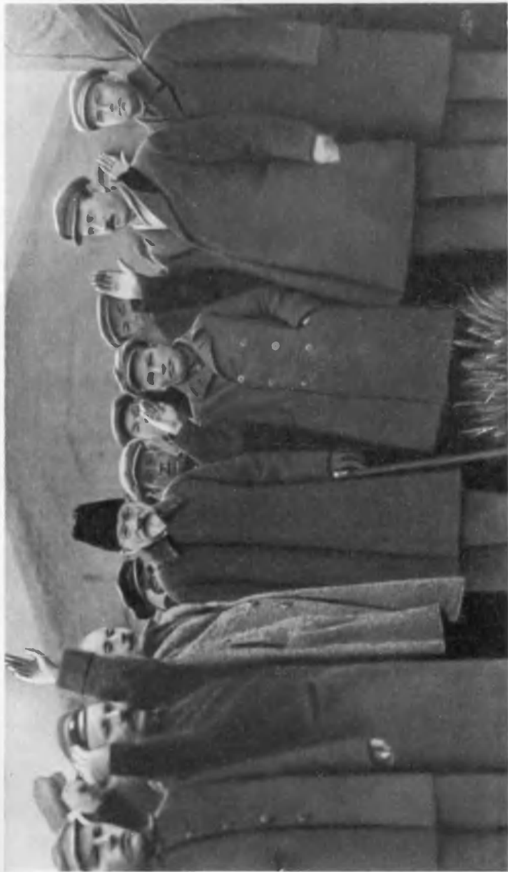
М. И. Калинин, С. М. Киров в группе встречающих в момент прибытия их на закладку Свирской гидроэлектростанции. Октябрь 1927 г.