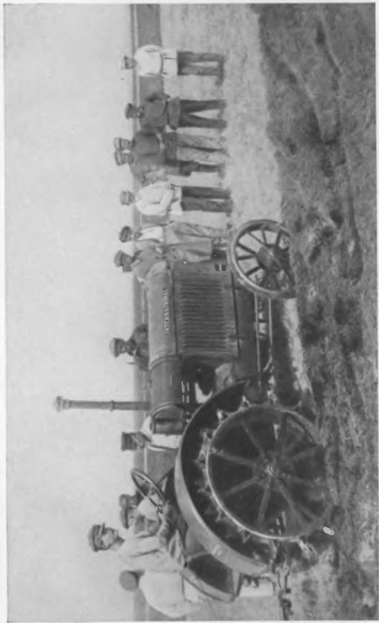
М. И. Калинин (в группе) во время пребывания на Кубани, в Сальском округе. Июль 1931 г.