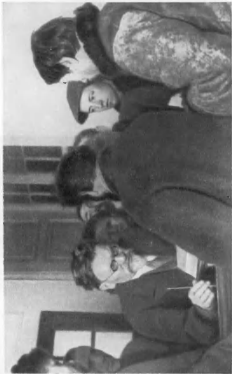
М. И. Калинин принимает трудящихся в своей приемной. 1929 г.