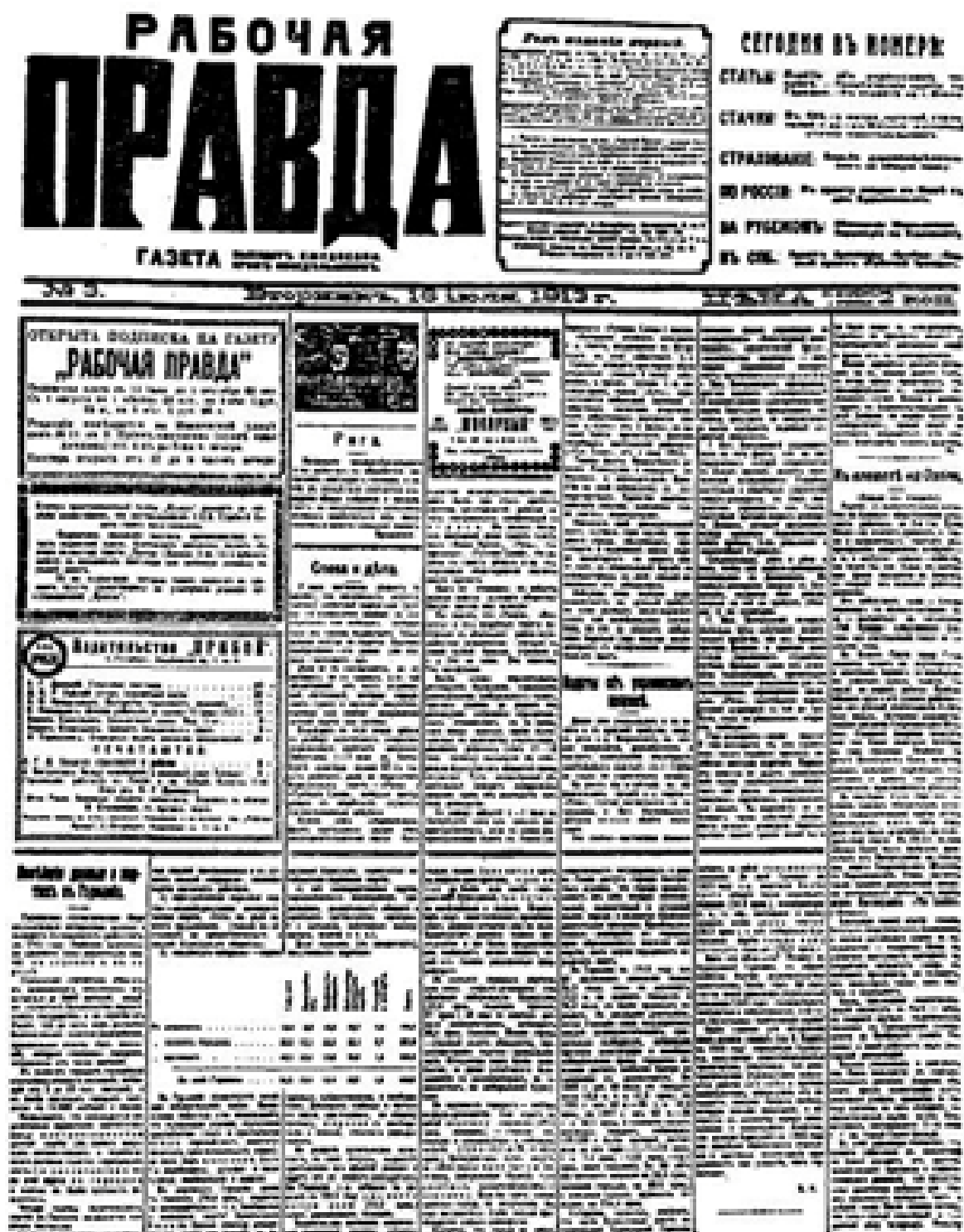
Первая страница газеты «Рабочая Правда» № 3, 16 июля 1913 г., со статьями В. И. Ленина «Слова и дела» (передовая), «Кадеты об украинском вопросе» и «Новейшие данные о партиях в Германии» Уменьшено