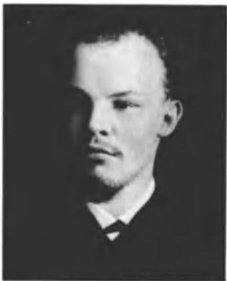
Владимир Ильич Ульянов. 1891 г. Самара