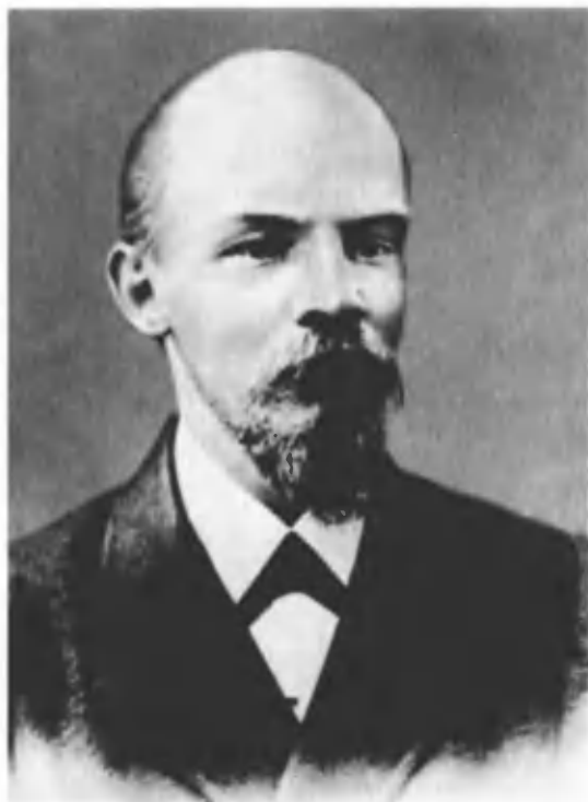
Владимир Ильич Ульянов. 1900 г. Москва