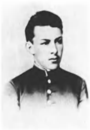
Дмитрий Ильич Ульянов. 1893 г.