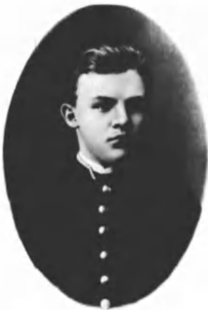
Владимир Ульянов в гимназические годы. 1887 г. Симбирск