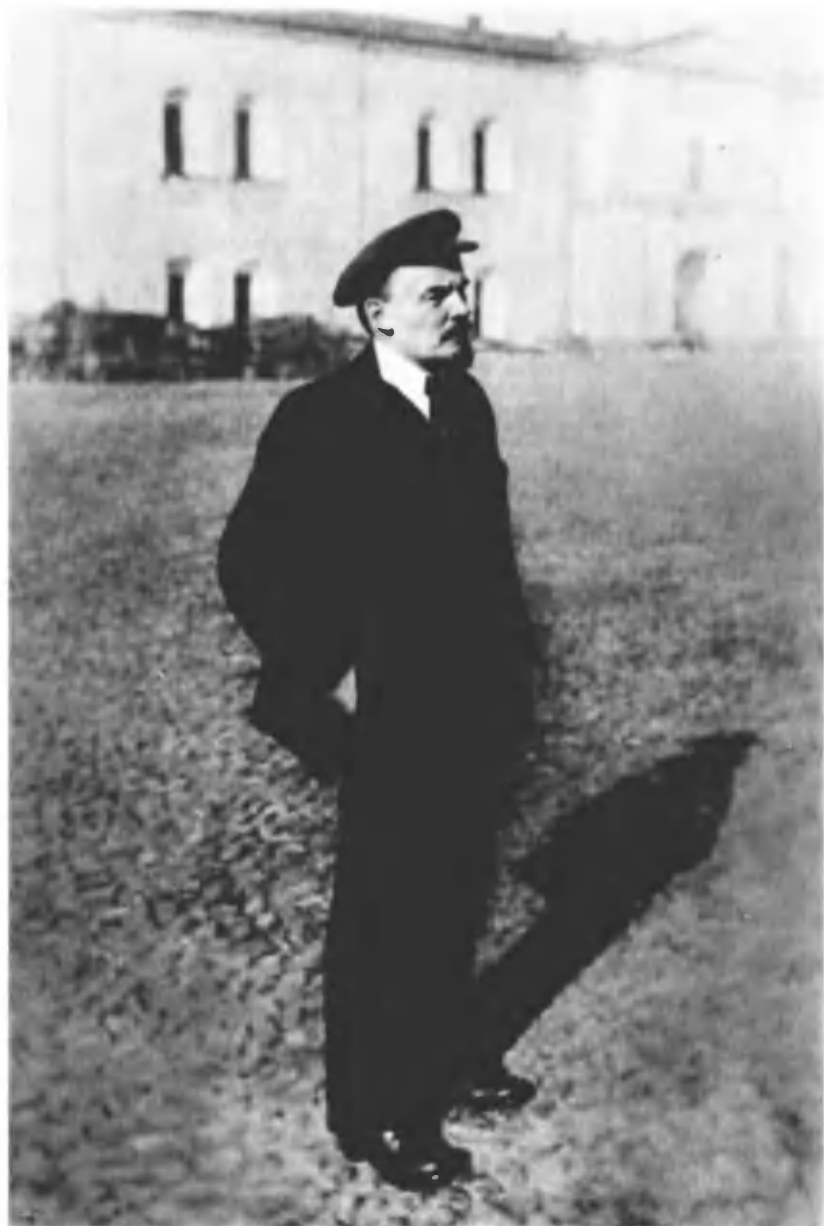
В. И. Ленин во дворе Кремля на прогулке по выздоровлении после покушения. 16 октября 1918 г.