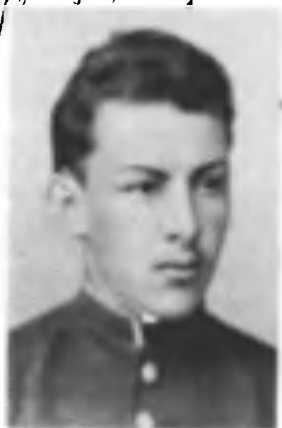
ДМИТРИЙ ИЛЬИЧ УЛЬЯНОВ