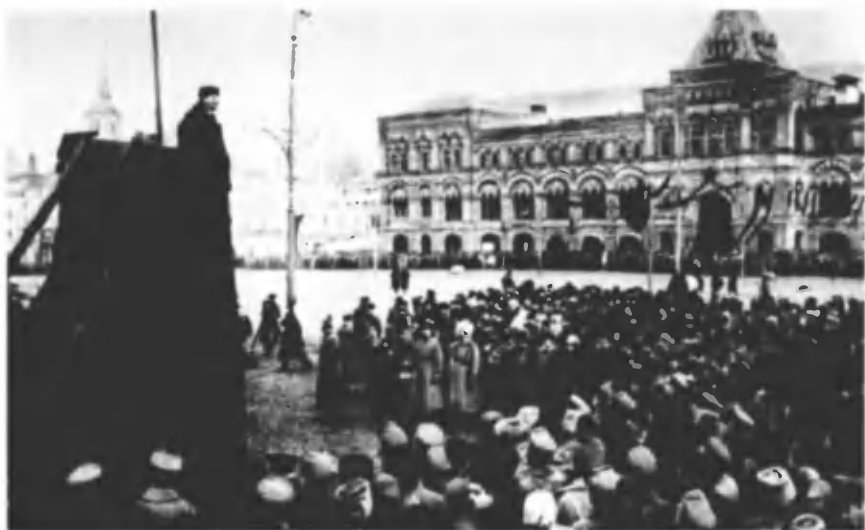
В. И. Ленин произносит речь с трибуны на Красной площади в день празднования 1-й годовщины Великой Октябрьской социалистической революции после открытия мемориальной доски, установленной в память павших за мир и братство народов. 7 ноября 1918 г. Москва