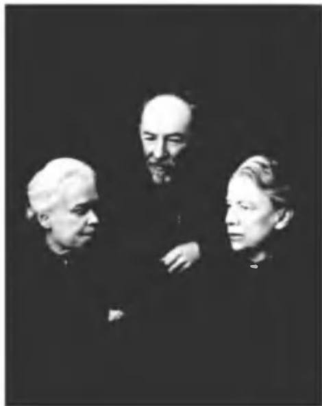
М. И. Ульянова, Д. И. Ульянов, А. И. Ульянова-Елизарова. 1930—1932 гг. Москва