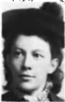
АННА ИЛЬНИЧНА УЛЬЯНОВА- ЕЛИЗАРОВА