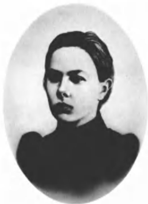
Н. К. Крупская. 1895 г. С.-Петербург