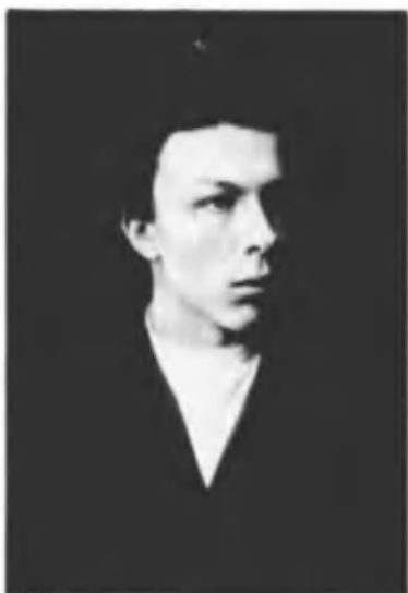
Александр Ильич Ульянов. 1887 г. Петербург