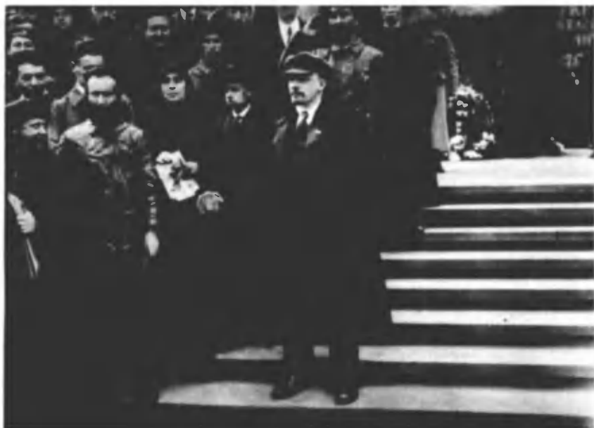
В. И. Ленин и Н. К. Крупская у Кремлевской стены на Красной площади во время первомайской демонстрации трудящихся. 1 мая 1919 г. Москва