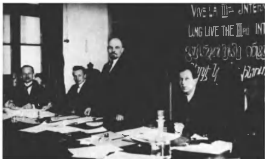
В. И. Ленин в президиуме I конгресса Коминтерна в Кремле. Март 1919 г. Москва