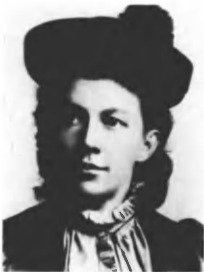
Анна Ильинична Ульянова-Елизарова. 1897 г. Берлин