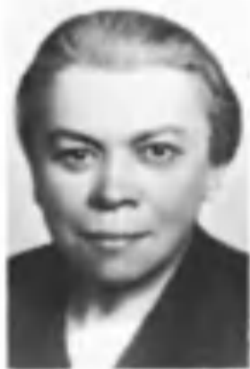
МАРИЯ ИЛЬНИЧНА УЛЬЯНОВА