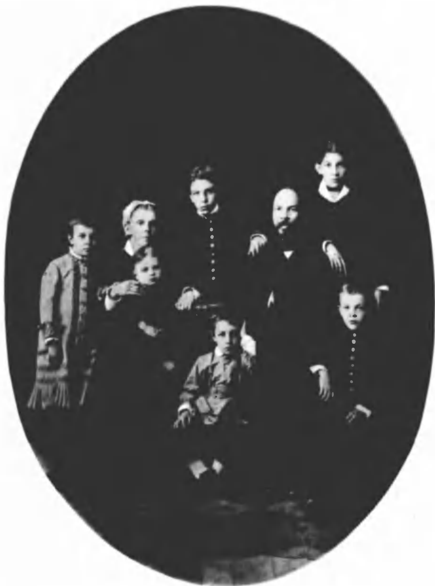
Семья Ульяновых: Мария Александровна Ульянова, Илья Николаевич и их дети — Ольга, Мария, Александр, Дмитрий, Анна, Владимир. 1879 г. Симбирск