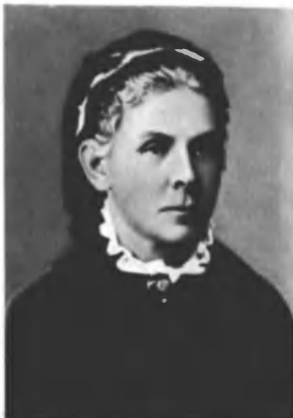
Мария Александровна Ульянова — мать В. И. Ленина. 1887—1888 гг. Симбирск