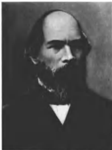
Илья Николаевич Ульянов — отец В. И. Ленина. 1882—1883 гг. Симбирск