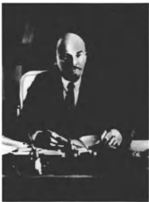
В. И. Ленин за рабочим столом в своем кабинете в Кремле. 16 октября 1918 г. Москва