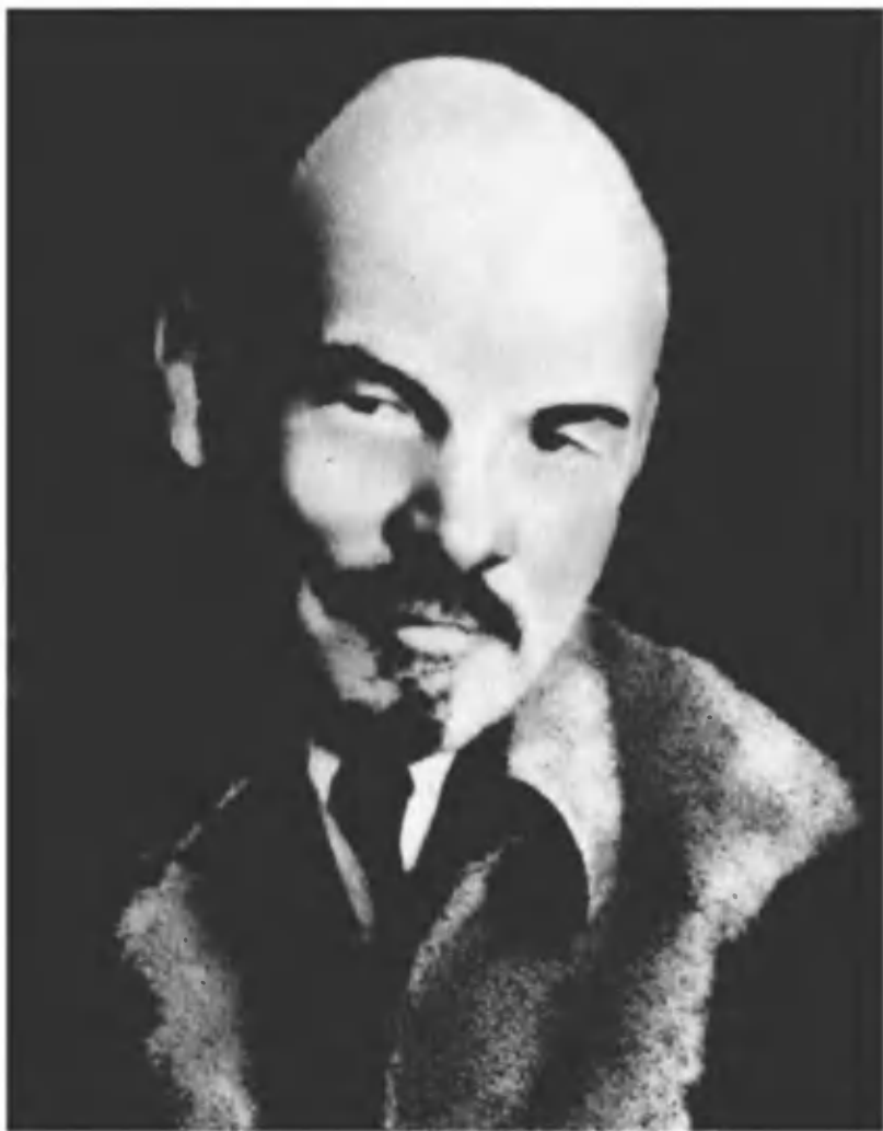
В. И. Ленин во время работы IV сессии ВЦИК 9-го созыва в Кремле. 31 октября 1922 г. Москва