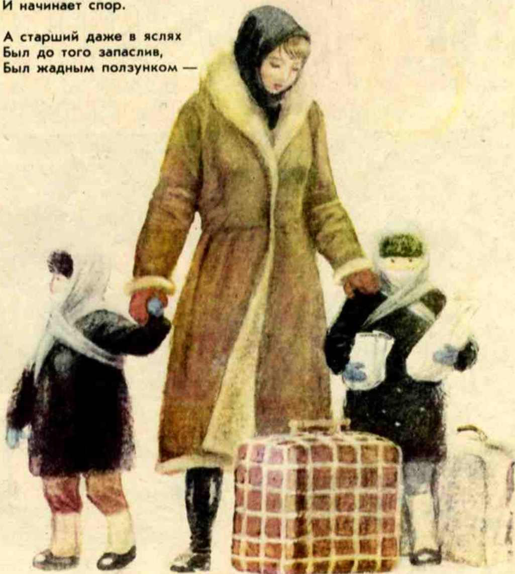
Рис. Н. УСТИНОВА

«Чук-Чук и Гек, Чук-Чук и Гек!» — Колёса вдруг запели.