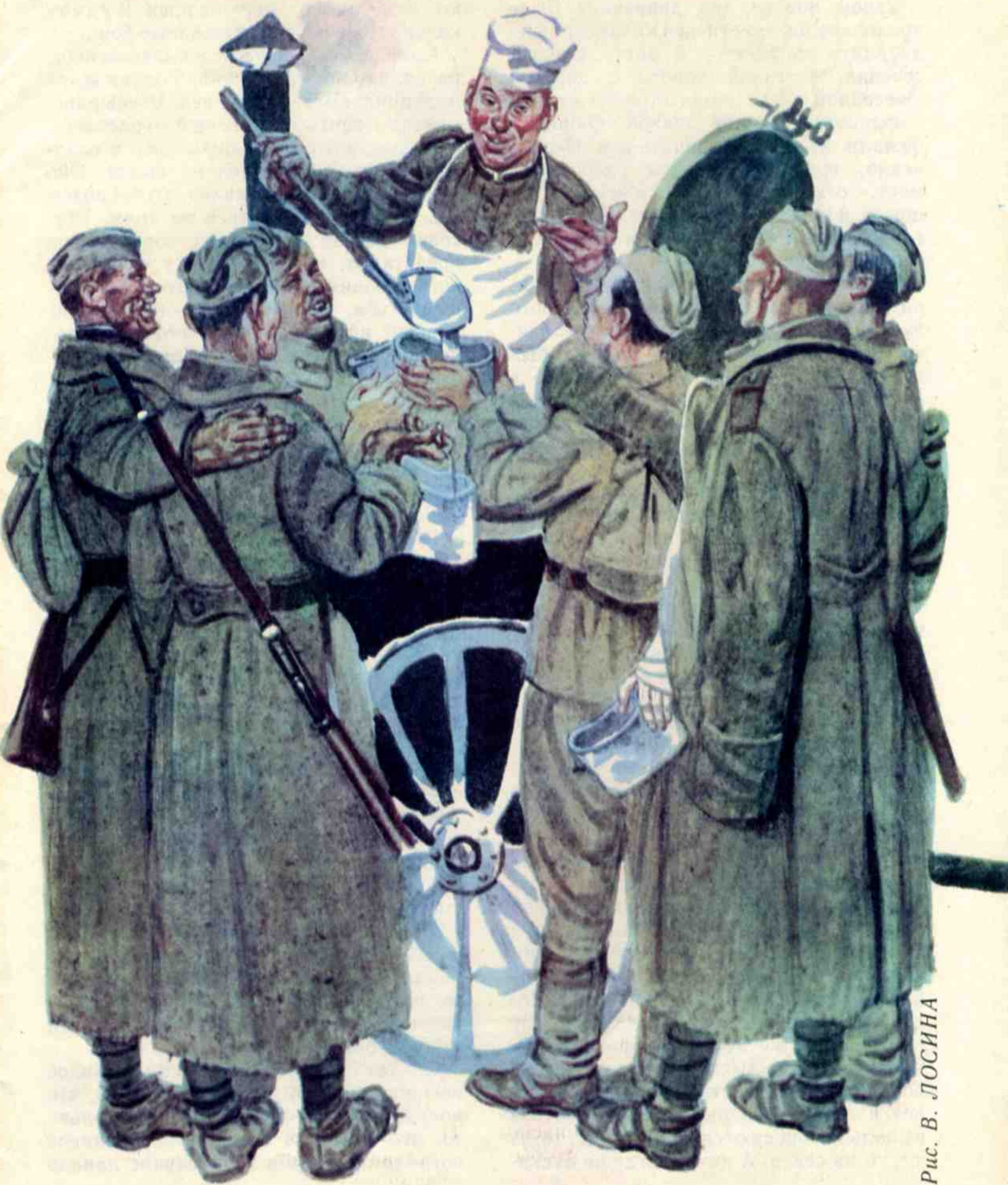
Рис. В. ЛОСИНА