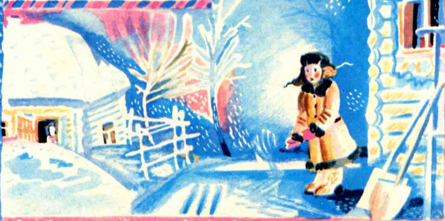
Рис. М. ПАНТЕЛЕЕВА

Уже и март заканчивался, а зимы не убывало, морозы день ото дня ещё и свирепели. Снегу нападало, по мостам только и догадаешься — да ведь тут река.