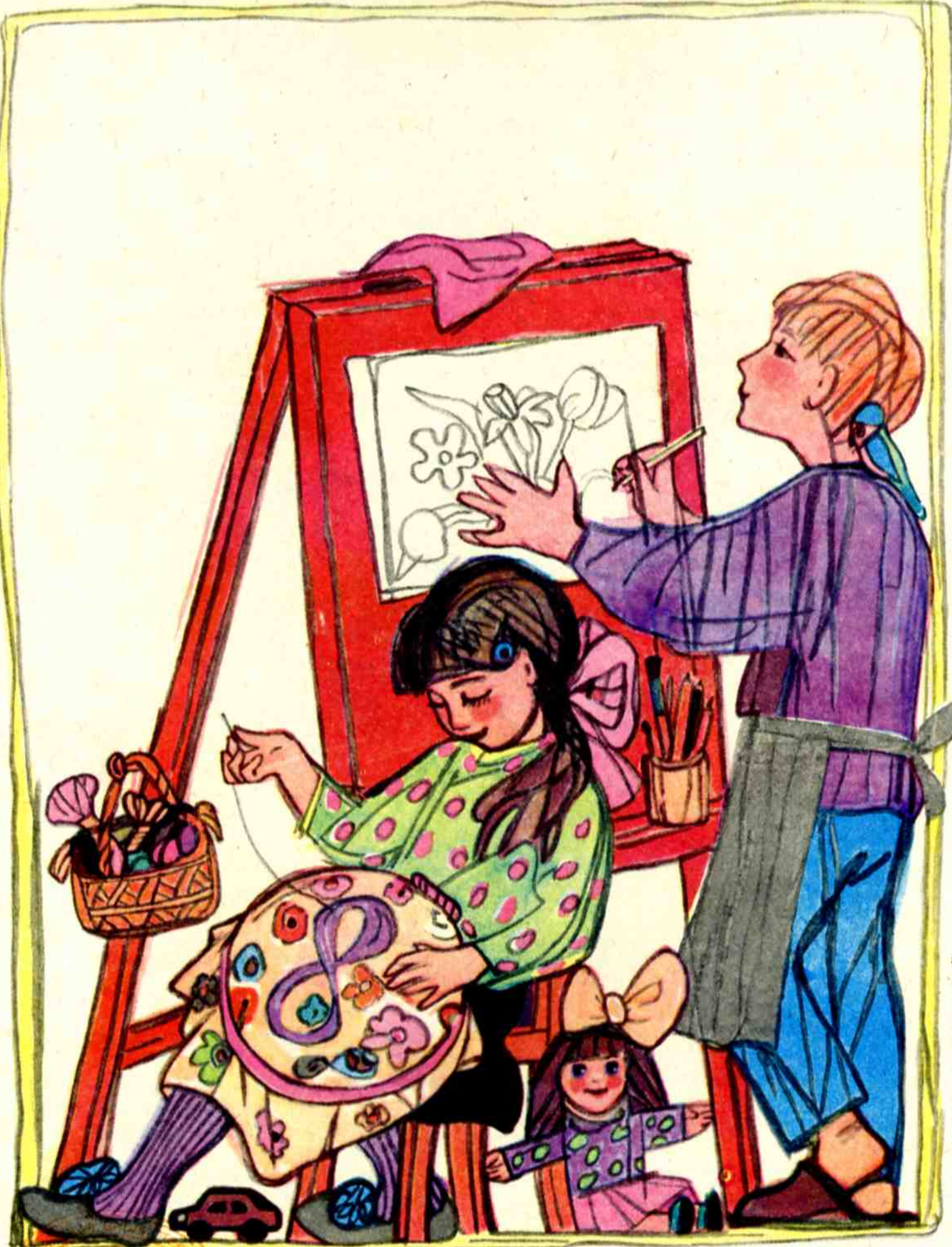
Рис. В. ХЛЕБНИКОВОЙ