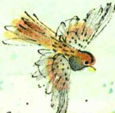
Рис. В. ХЛЕБНИКОВОЙ

Их не пугают опасные кручи, Белые молнии, чёрные тучи. Птицы на родину мчатся уверенно, Зная, что помнит их доброе дерево.