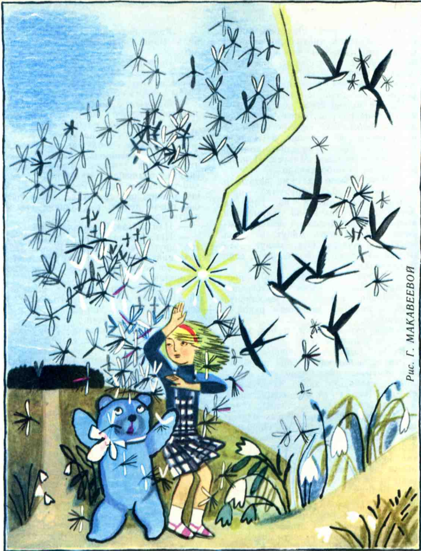
Рис. Г. МАКАВЕЕВОЙ

Это возвращался Асей. А за ним нес- лись ласточки. Огромная стая бело-