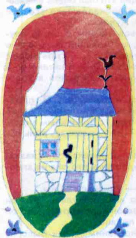
Рис. В. ХЛЕБНИКОВОЙ

Триста лет тому назад во Франции у короля Людовика Четырнадцатого была большая армия. Когда не случилось какой-нибудь подходящей войны, король устраивал парады. А однажды решил отправиться на военные учения — это вроде игры в солдатики, только солдаты не оловянные, а самые настоящие. Сказано — сделано. Отыскали поле неподалёку от большого леса — и в путь. Рядовые с мушкетами шли пешком, офицеры со шпагами скакали на конях, свита сидела в каретах. В одной из них ехал королевский архитектор — вдруг королю захочется во время учений что-нибудь построить, беседку или охотничий замок. Архитектора звали... Но лучше рассказывать всё по порядку.