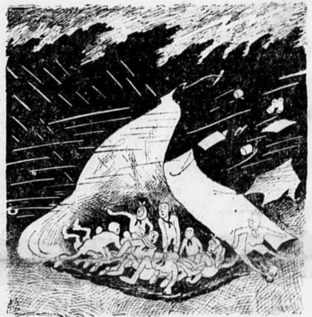
(На мотив: «Буря мглою небо кроет»).

Если в лагере дождь грянет, Пионер, наверно, знает: Будешь плавать в океане Ночку целую без сна. То палатку ветер снесит То начнет ее топить.