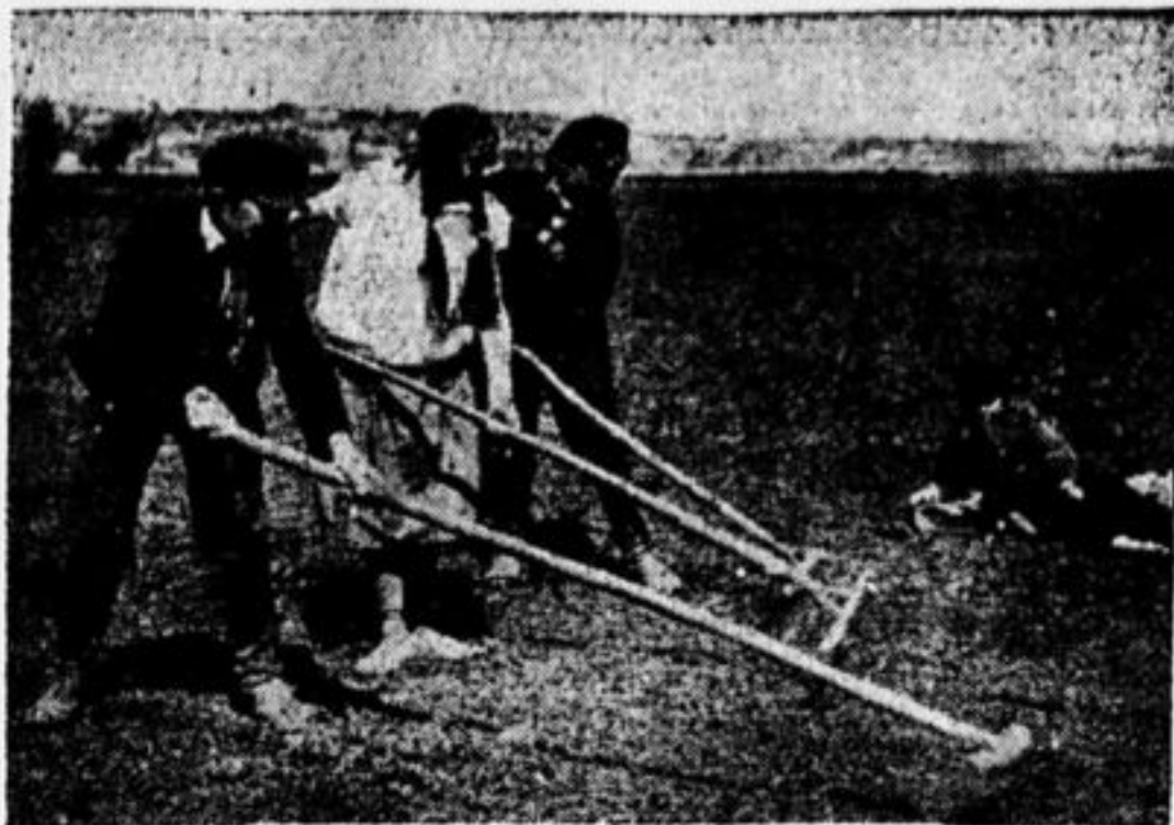
Устраивайте пона зательные огороды.

Всех деревенских детей пионер воспитывает в пионерском духе. Он собирает их вокруг себя: читает им пионерские законы и обряды, читает им газеты, журналы, книги, которые они очень любят слушать. Большинство ребят, понявших хорошо значение этих законов и обрядов, стараются их исполнять. Ребята достигших 10—12 лет, пионер старается записать в свои ряды.