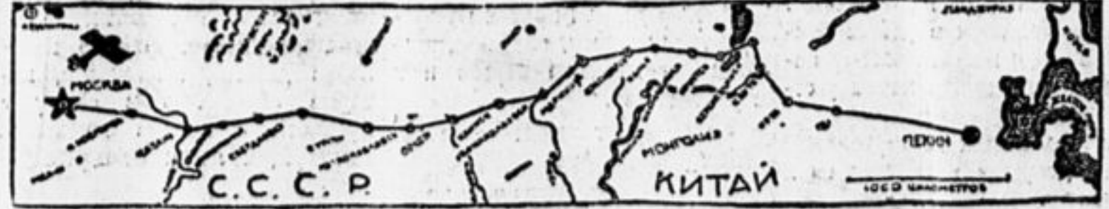
Путь следования аэропланов.

После последнего осмотра моторов самолеты скрылись в утреннем тумане.