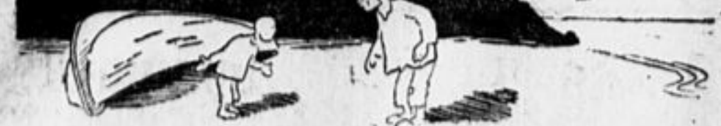
Рассказ Ник. Светлова.

I. День был солнечный, ясный. Мишка прыгал с камня на камень, добрался до берега, где валялась перевернутая ялунка. — Удочки-то... украли... Налим почесал доясилицу, оглядел горизонт, выругался: — Э-э-э, чудак... украли... разве украли... Я говорил, крени лучше—ночью слышал—морина была, ну и того... унесло волной... эх, ты... Мишка обиделся: — Тятка... а, а ты новы сделай... сделай новы... Леса есть, а крючков и пойдю разживусь... вон—мальцы бычков ловят—может дадут... И Мишка не дожидаясь ответа, побежал по берегу—добывать крючки. Налим, это старый бродяга, нашел он Мишку на станции, в голодное время, взял его на свое попечение. За три года Налим привык к своему приемлышу и считал за должное, когда его