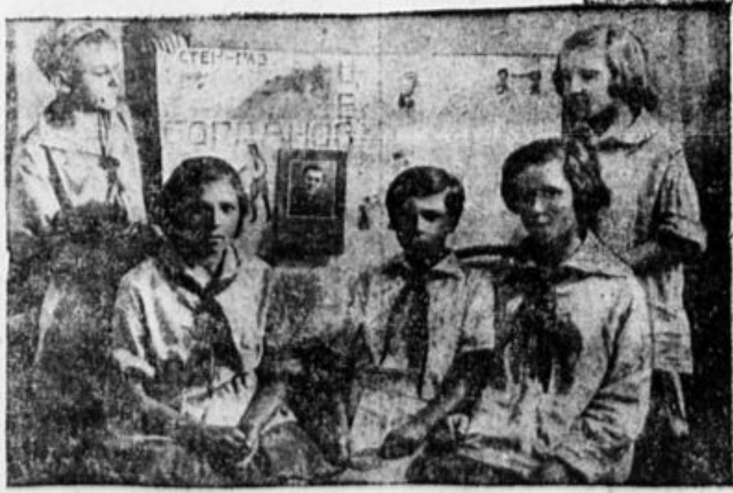
Редколлегия стенной газеты «Богдановец», Узбекистан, гор. Самарканд.