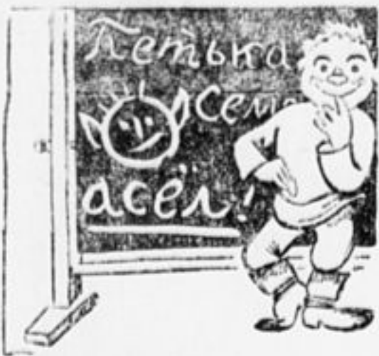
1. На доске огрызком мела Пишет Федя в первый раз: Обличает Петьку смело, — Чем же это не стенгазет?