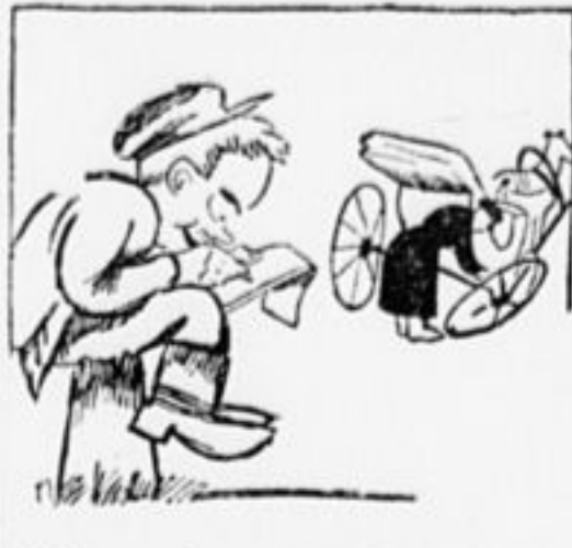
4. Пишет Федя целый день, — Утонул в заметках. «Бедный! Стал похож на тень», Шепчет мать соседке.