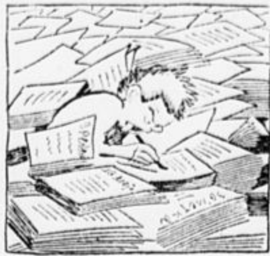
3. Для заметок — ширь, простор Есть на нашей улице. Устремив пылливый взор, Федя наш сутулится.