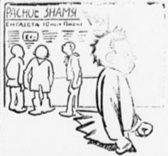
5. Вышел номер стенгазеты, — Федя в возмущении: «Ни одной моей заметки. Что за обращение!».