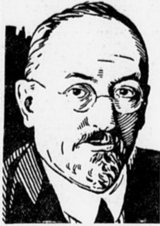
Народный комиссар иностранных дел тов. ЧИЧЕРИН.

Советская республика думает и впредь вести свою мирную политику и устанавливать добрососедские отношения со всеми странами Европы, несмотря на их козни против нас.