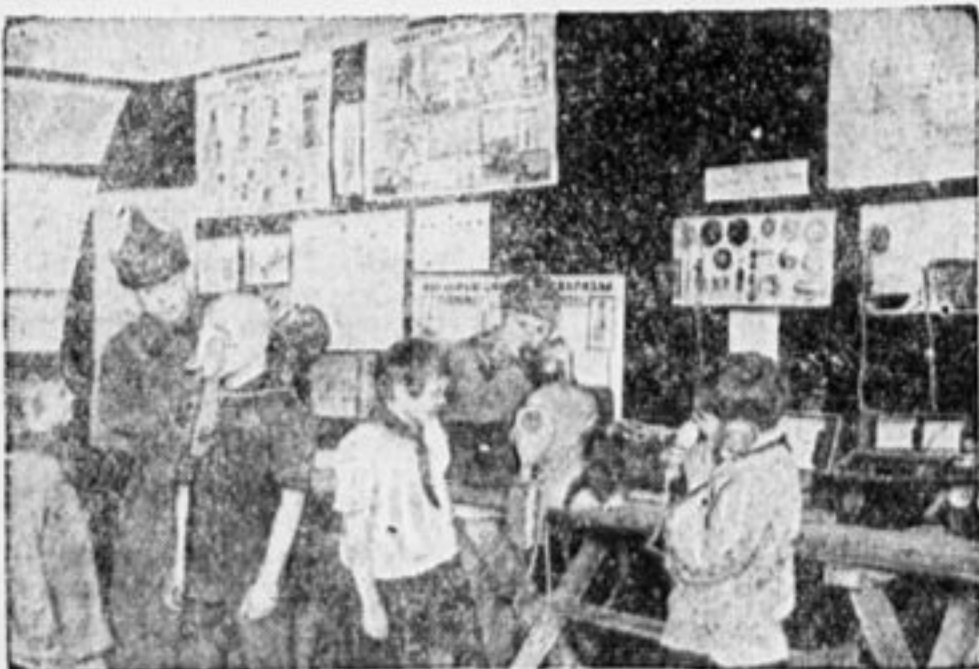
В УГОЛКЕ ВОЕННОЙ ТЕХНИКИ.