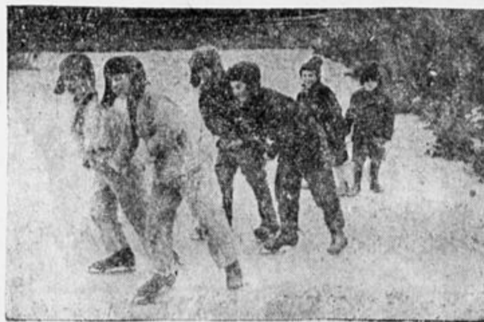
ВЫШЛИ НА ПРОГУЛКУ.