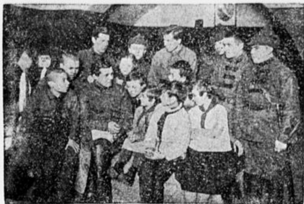
«КАК МЫ БРАЛИ ПЕРЕКОП». (Беседа в казарме).