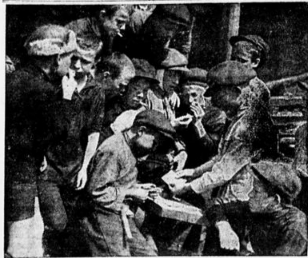
Надо сделать их пионерами.