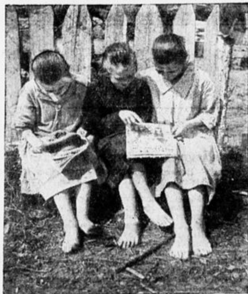
Переменка в деревенской школе.