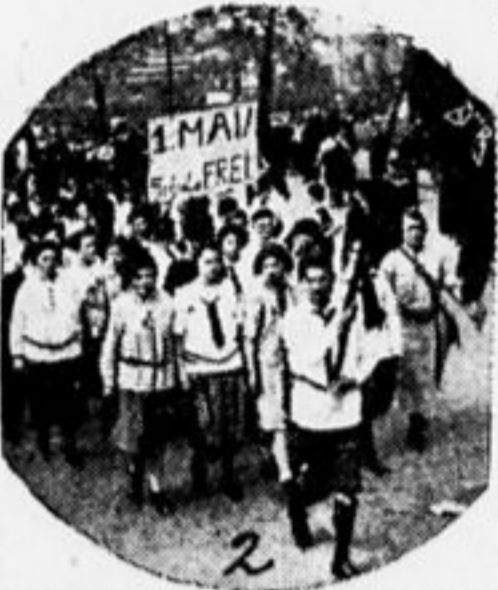
ГЕРМАНСКИЕ ПИОНЕРЫ 1 МАЯ

Во французских школах «культурные» учителя рассказывают детям о том, что «проклятые боши» (это они так называют