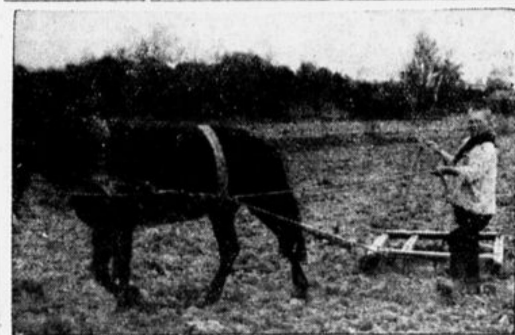
Деревенский пионер —помощник отцу.