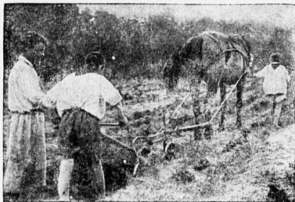
В совхозе. Учатся пахать.

От редакции. Ребята, высказывайтесь по этому вопросу.