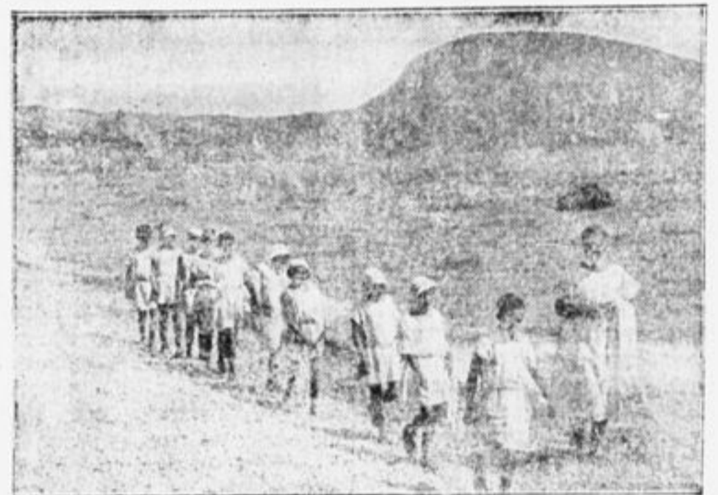
НА СОЛНЕЧНЫЕ ВАННЫ (КРЫМ).

проглотив часть этих бактерий. И животное заболевает (в нашем случае — брюшным тифом). Затем другую часть бактерий в пробирке выставляют на солнце на несколько часов и потом дают проглотить другому животному — оно или заболевает очень легко, или совсем не заболевает. Солнечные лучи уничтожают и осла-