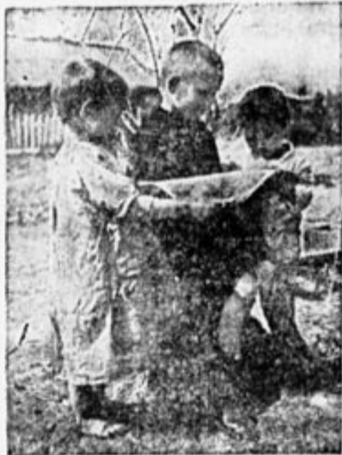
Читают письмо с Запада.

Ниже помещаются адреса зарубежных деткомгрупп и организаций для переписки. В следующих №№ «Пионерской Правды» будут помещены адреса других стран.