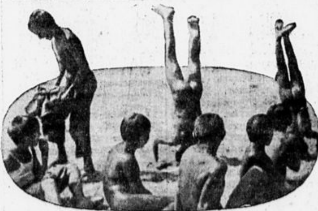
ПЕРЕД КУПАНЬЕМ НА ПЕСКЕ.

бли и вилы, но их всем не хватает, так что 2—3 остаются без инструментов.