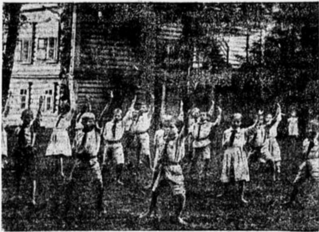
НЕМЕЦКИЕ ПИОНЕРЫ НА ГИМНАСТИКЕ В ЛАГЕРЕ.

Когда мы вернемся в Германию, расскажем рабочим Германии и их детям пра-