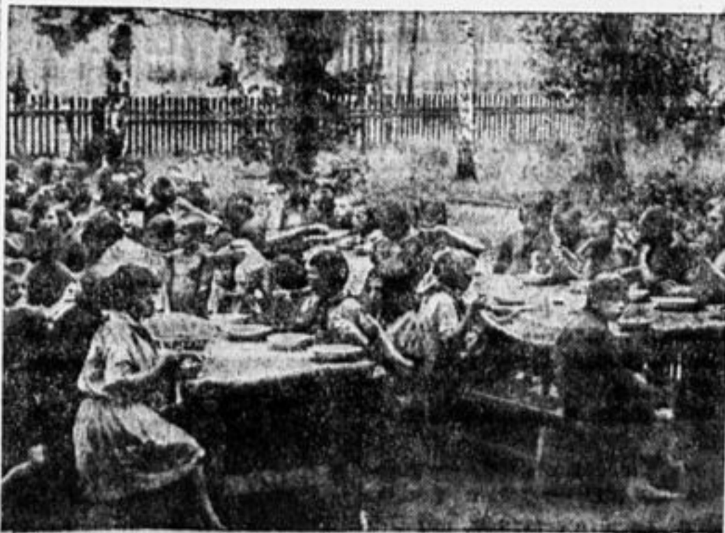
НЕМЕЦКИЕ ПИОНЕРЫ ЗА ЛАГЕРНЫМ ОБЕДОМ.