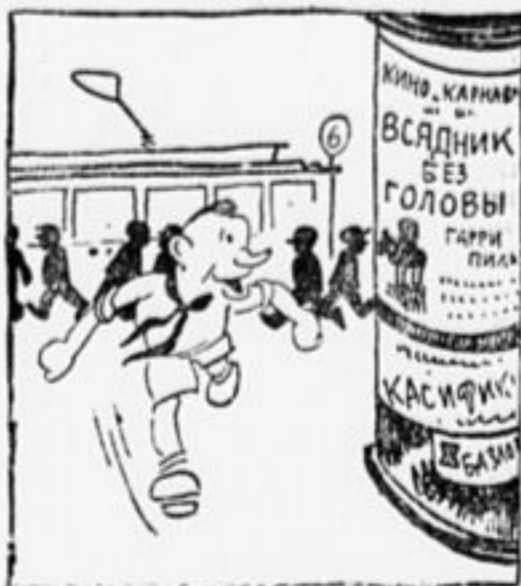
1. Из лагеря приехал Миша. Что нового, что есть в Москве, Трамвай, автобусы, афиша... Что с Мэри Пикфорд, как вообще?