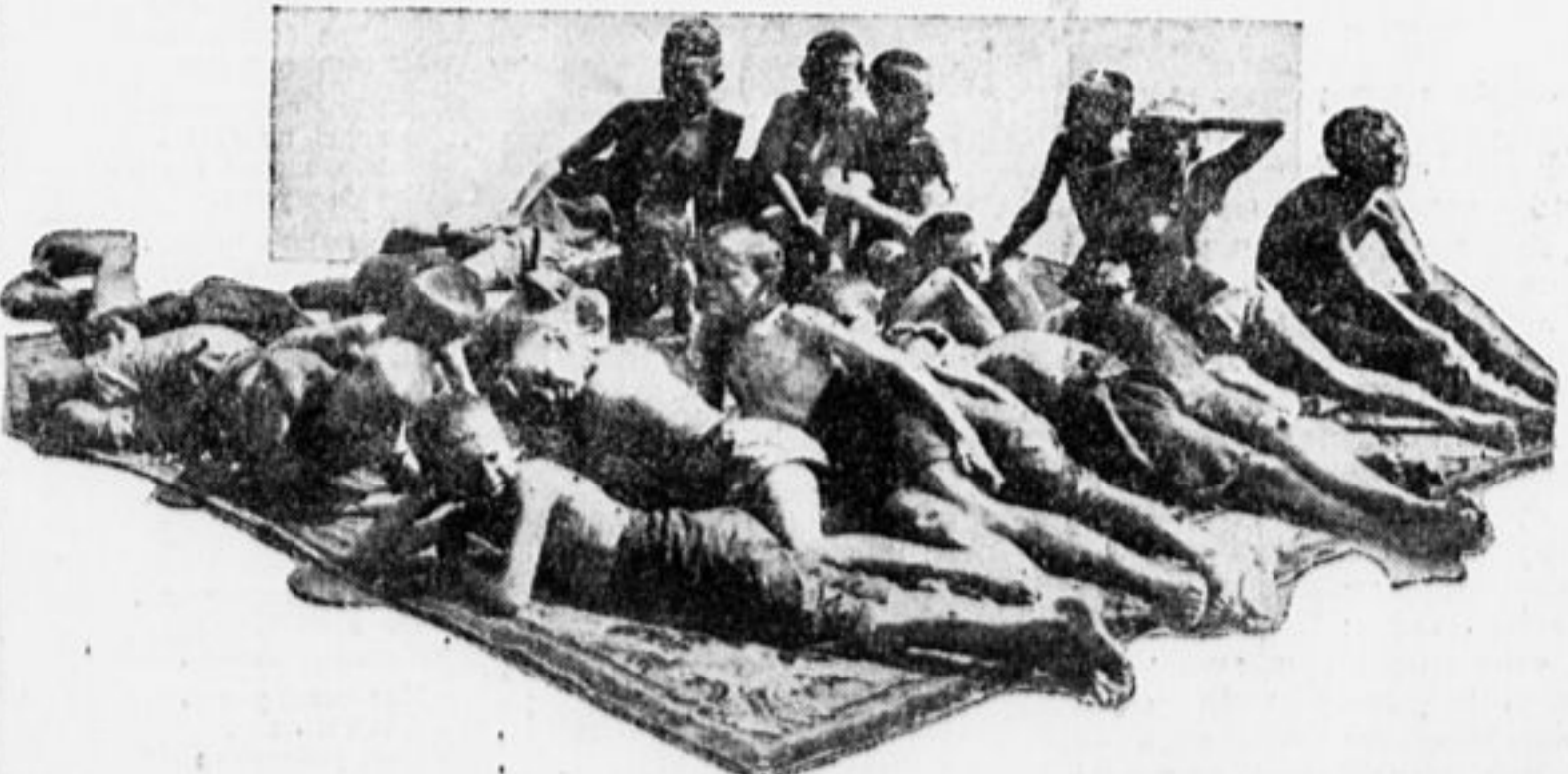
ПОЛЬЗУЕМСЯ ПОСЛЕДНИМИ ЛУЧАМИ СОЛНЦА

Но разве можно назвать пионером того, кто нарушает данное им торжественное обещание, кто не исполняет того, что обещал выполнить как заветы (Продолжение см. на 8-й стр.).