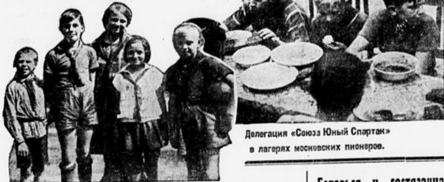
Делегация «Союза Юный Спартак» в лагерях московских пионеров.

Восторгу наших ребят не было границ. Каждый хотел с ними заговорить, но ничего не получалось. Ребята ни слова по-немецки, у вас остаться, так как мы должны сегодня же выехать