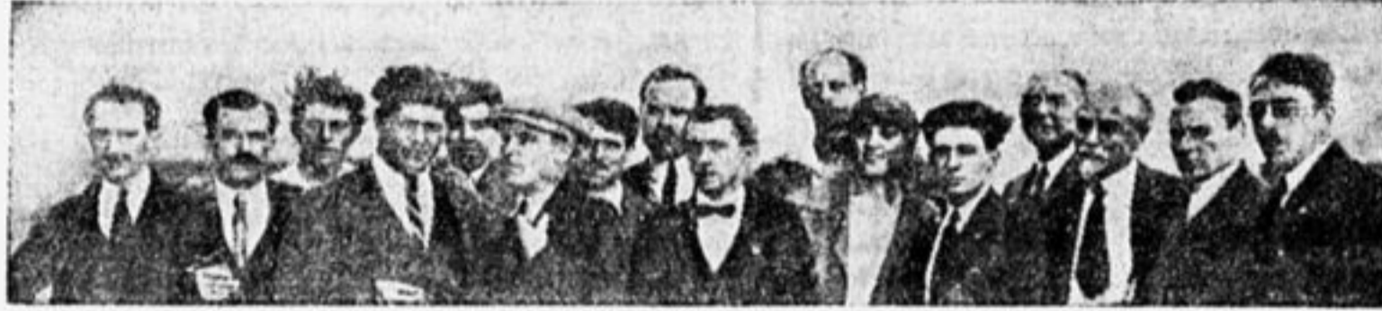
Бельгийская рабочая делегация.

Наконец, в СССР сейчас находятся и две американских делегации, одна из них—общественная из 18 человек, состоит из журналистов, фабрикантов и т. п. и приехала в СССР с целью создать в Америке правильное представление о СССР, высказать