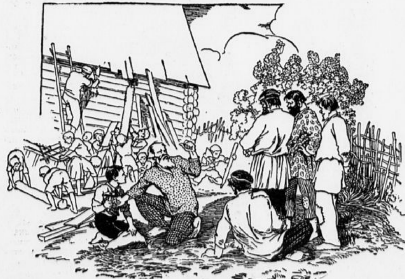
ПИОНЕРЫ ПОМОГАЮТ КРЕСТЬЯНАМ ПО ХОЗЯЙСТВУ.