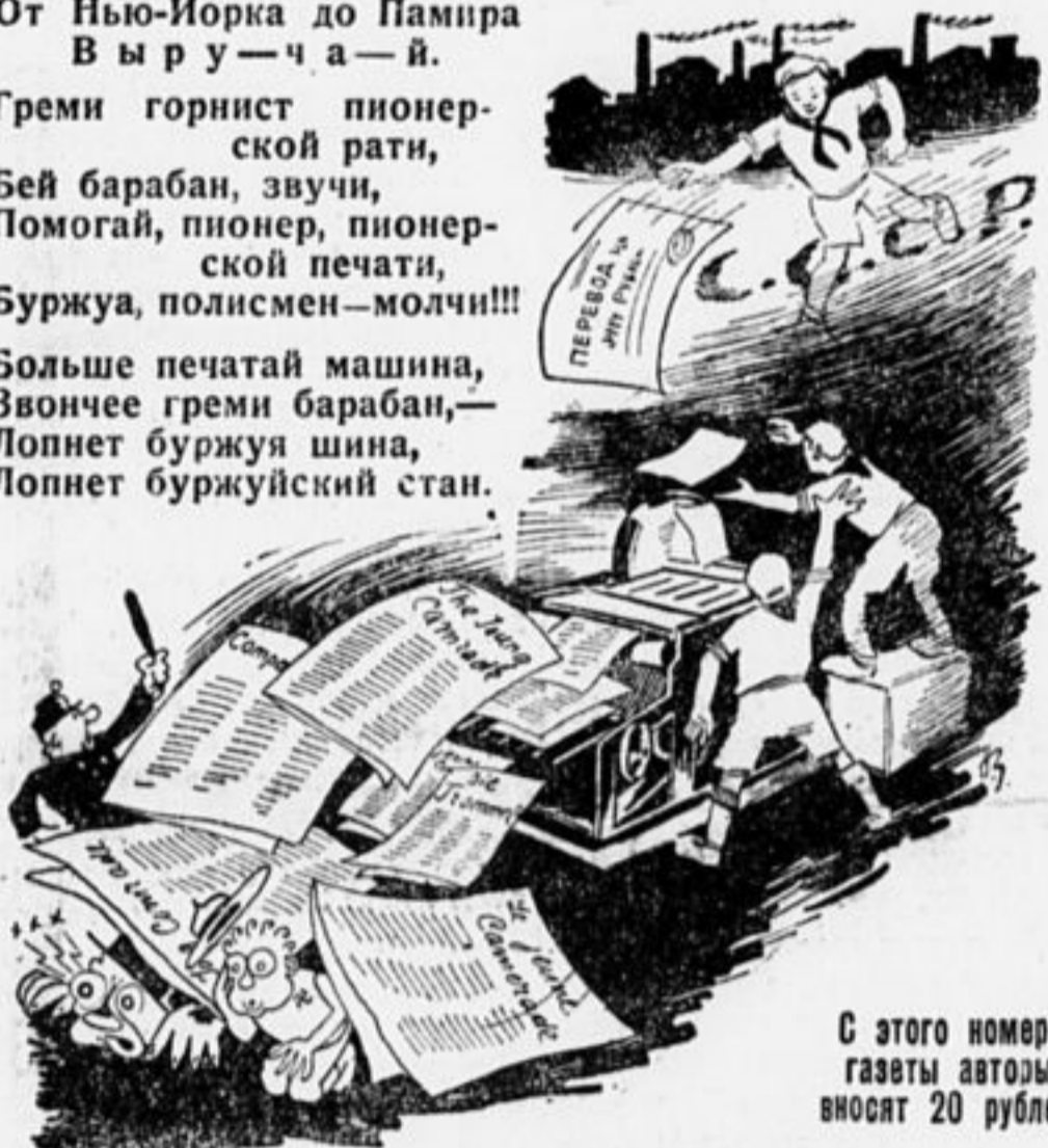
С этого номера газеты авторы вносят 20 рублей

Больше печатай машина, Звончее греми барабан,— Лопнет буржуа шина, Лопнет буржуйский стан.