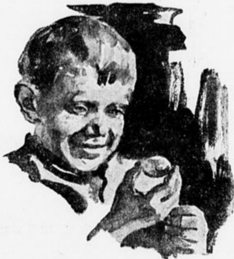
Заинтересован строением яйца

этому при отборке яиц на хранение надо не проглядеть, если на яйце есть хотя бы малейшая трещинка.