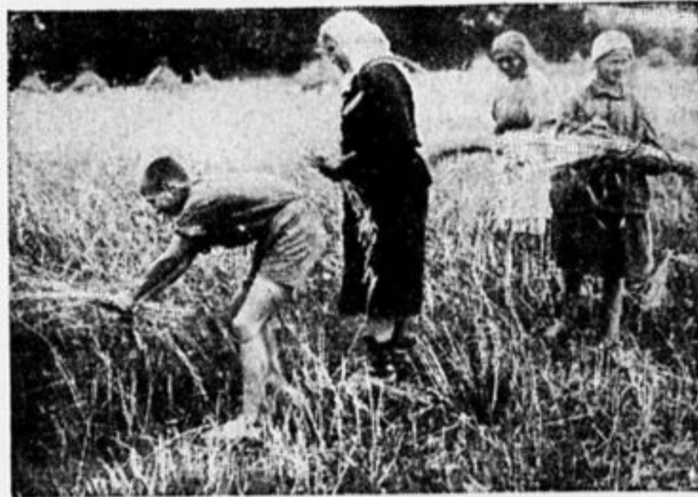
Помогают крестьянам жать.