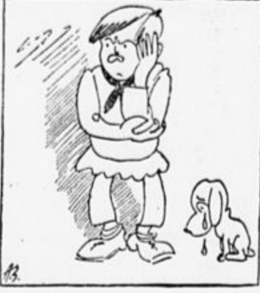
5. Задумчив, хмур, невесел Коля, Он после лагеря — «никак». Стоит, грустит, как меланхолик, А от работы «прет», как рак.