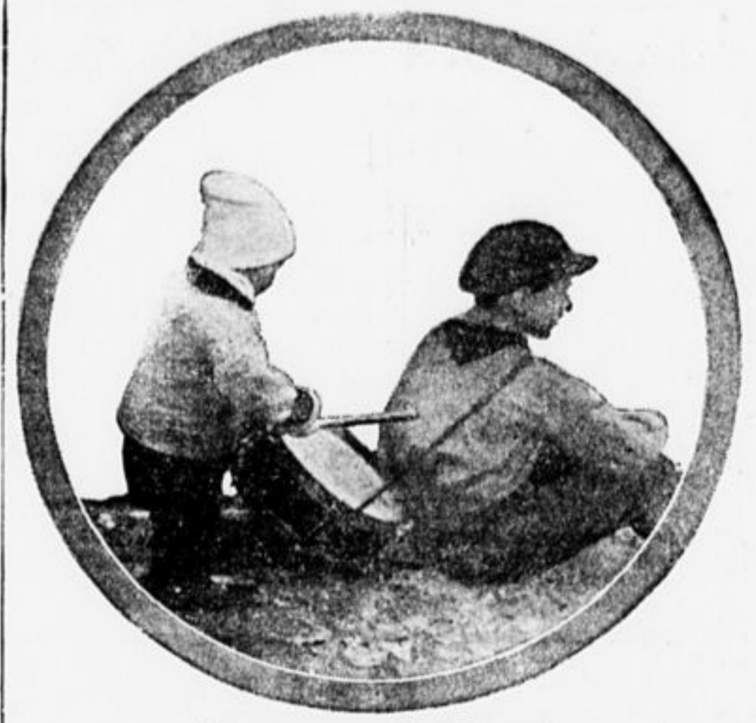
Можно мне по барабанить?