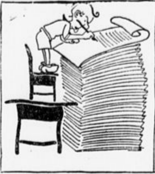
3. Сеня за зиму и лето Пишет, пишет, пишет весть, Все растет гора заметок, Летний лагерь — как он есть.