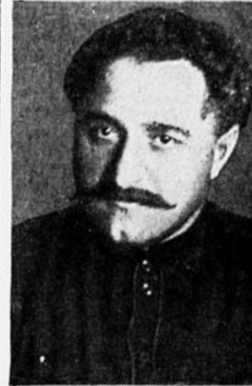
Тов. Орджоникидзе, новый председатель Ц. К. К. и Царком Р. К. И.

Поэтому слово «восстановительный» надо понимать в условном, но не прямом или