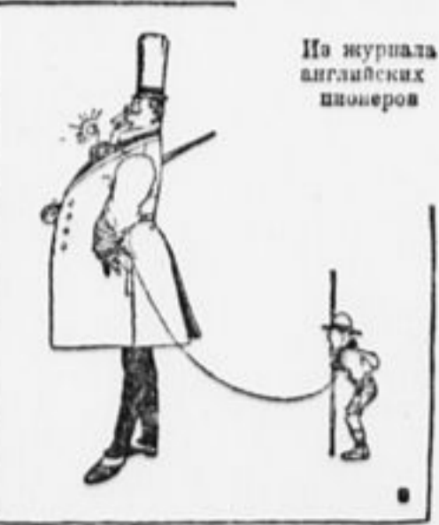
Из журнала английских пионеров