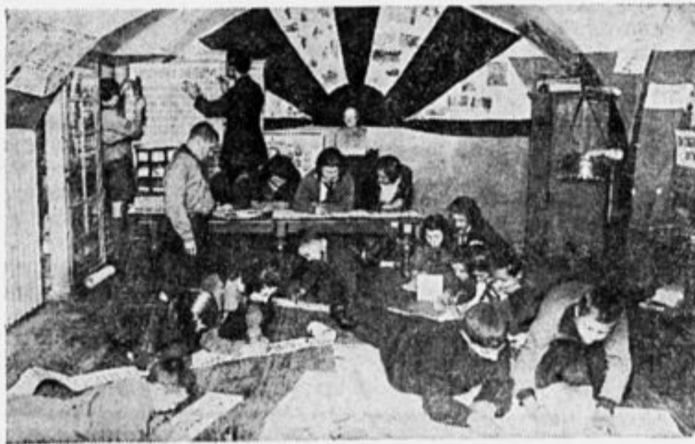
Школьный клуб готовится к Октябрю