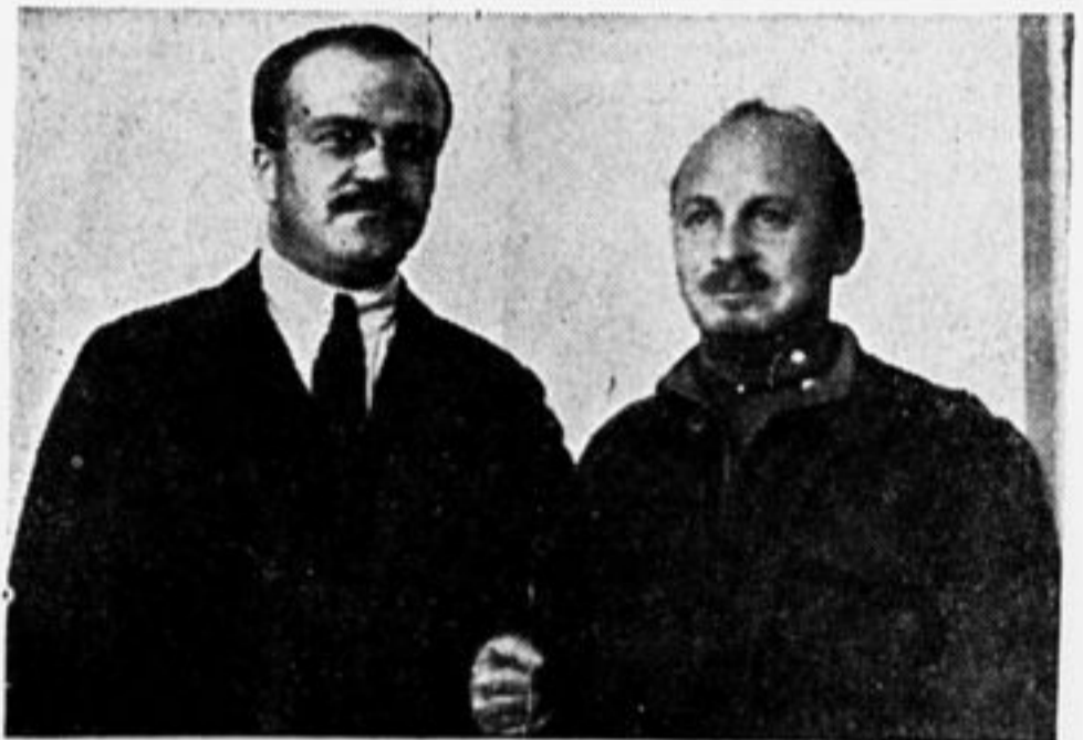
Т. т. Молотов и Бухарин.

От редакции. Вашему отряду послано письмо с разъяснениями по поводу заметки т. Кеслера.