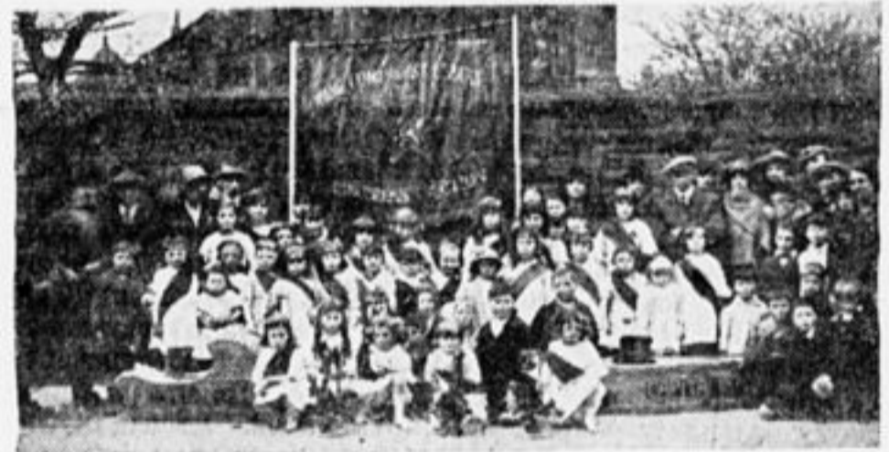
Группа юных товарищей г. Лиаерпулл во время праздника.

Пожелаем им в этом успеха. Заведующий зашел потом в мой класс и спросил меня, от кого я получил листовки. Я ответил, что получил их из Лон-