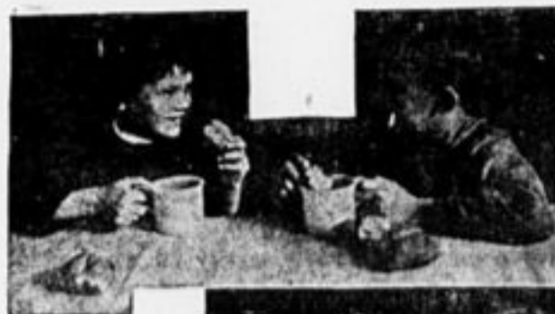
Горячие завтраки в школе.

Работа уже начата. Преподаватели в этой работе принимают активное участие. Школьный совет прикрепил к каждой секции по одному представителю. Надеемся в этом году работу в школе поставить на должную высоту. С. Шанов.