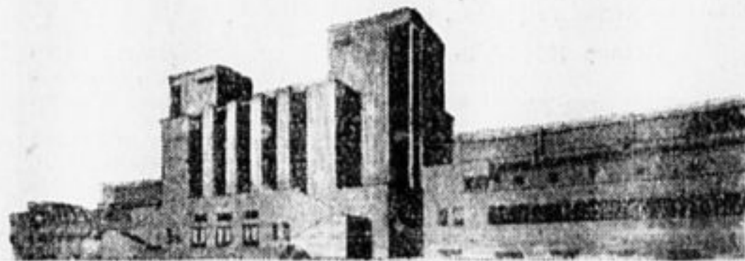
Проект здания кино-городка.

В настоящее время текстильным машиностроением у нас занято 17 заводов и выпуск машин в текущем году ожидается на сумму в 23 миллиона рублей т. е. почти в 4 раза больше, чем