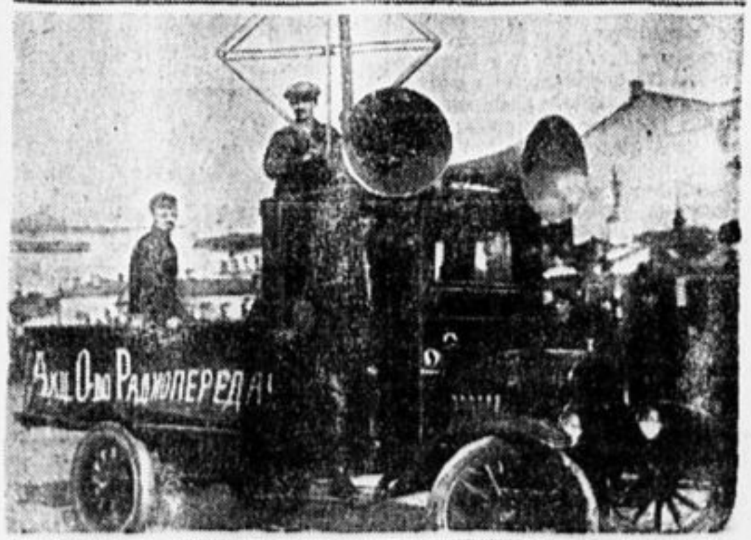
Радио-установка на автомобиле.