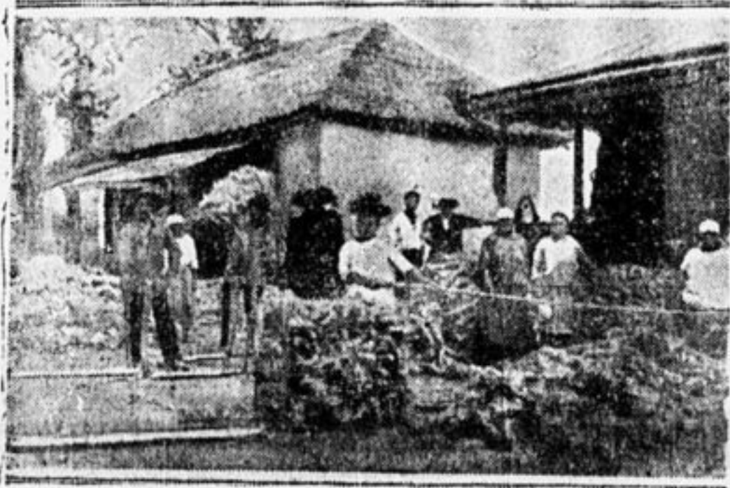
Собирают урожай кенафа (Сев. Кавказ).