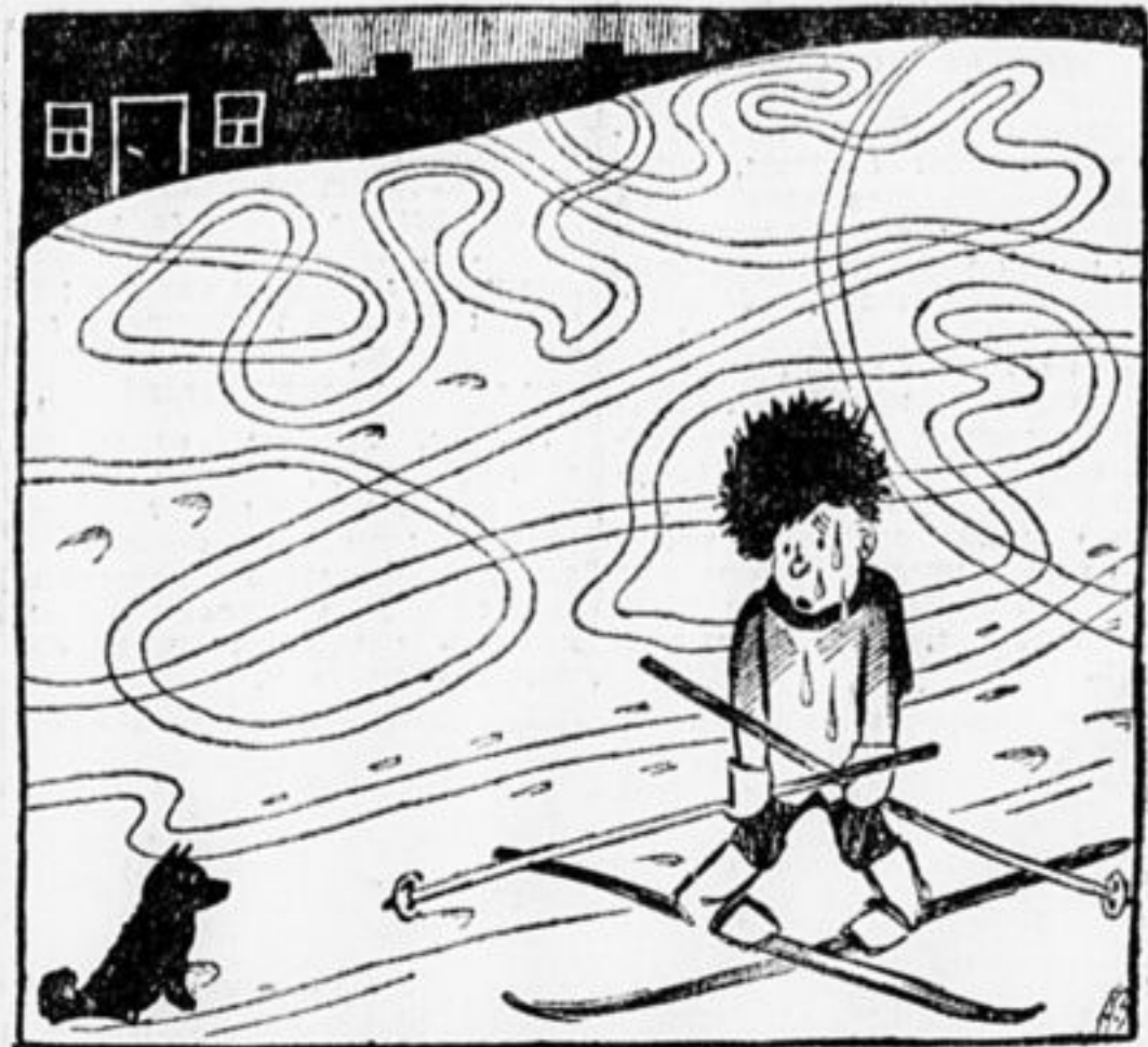
Кто кем управляет?