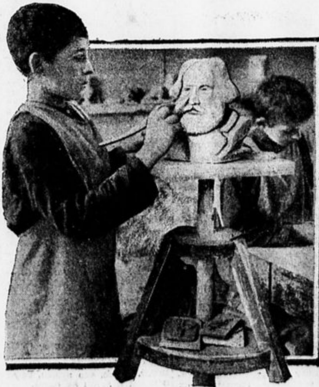
За лепкой бюста Маркса.