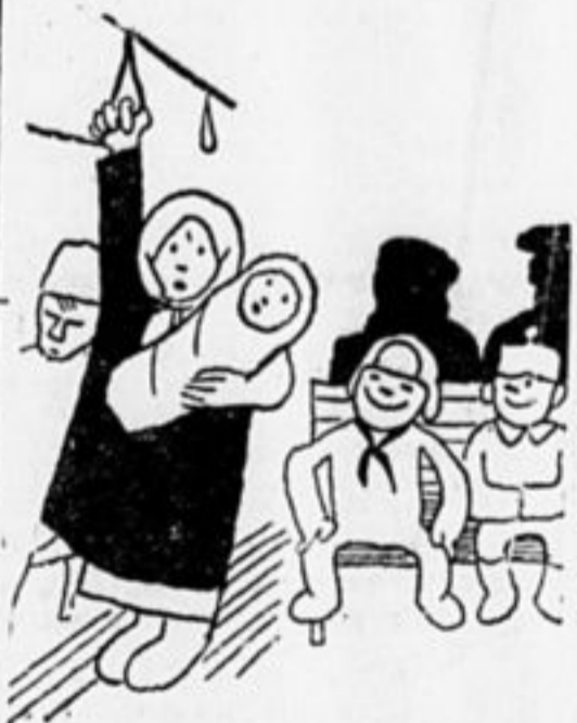
В трамвае никогда не уступит место женщине или старику

шел. Меня душил хохот. Я весело продолжал свой путь. Позже стало как-то не по себе. Может быть, этому парню нужно