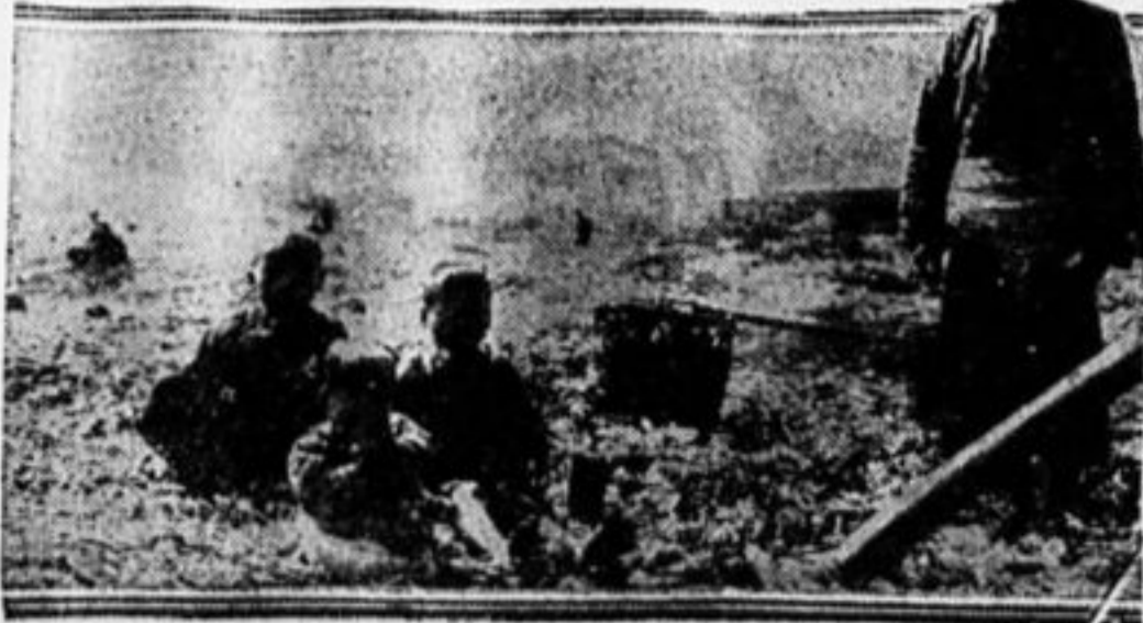
Семья огородника в окрестностях Кантона

Партия, которая имеет в своей среде лордов, мелких хозяйчиков и их прислужников, не может вести прямой, упорной борь-