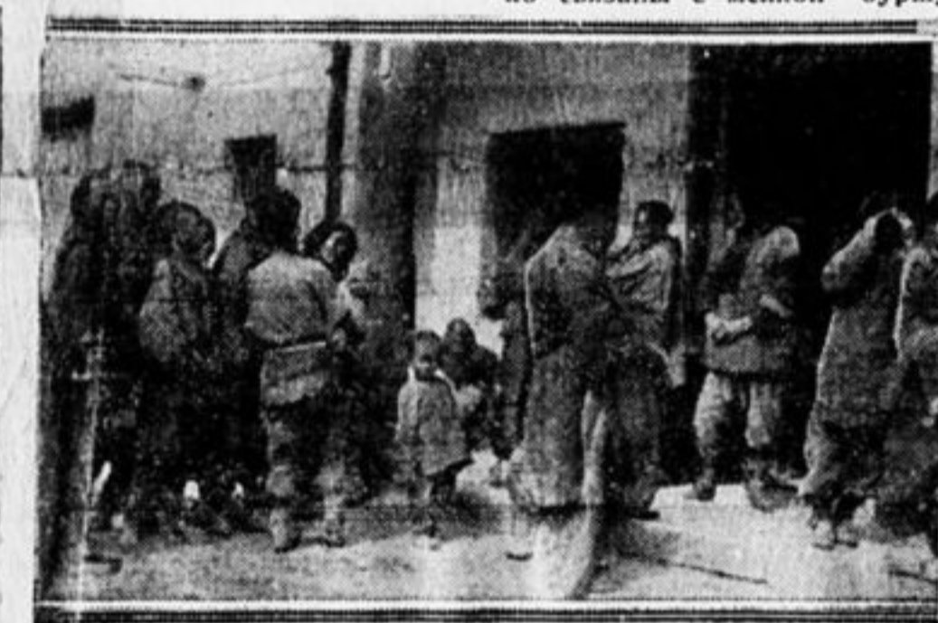
Китайские ишше в ожидании выдачи помощи

Палачи китайского народа Чан Кай-ши и Ван Цзин-вей от-