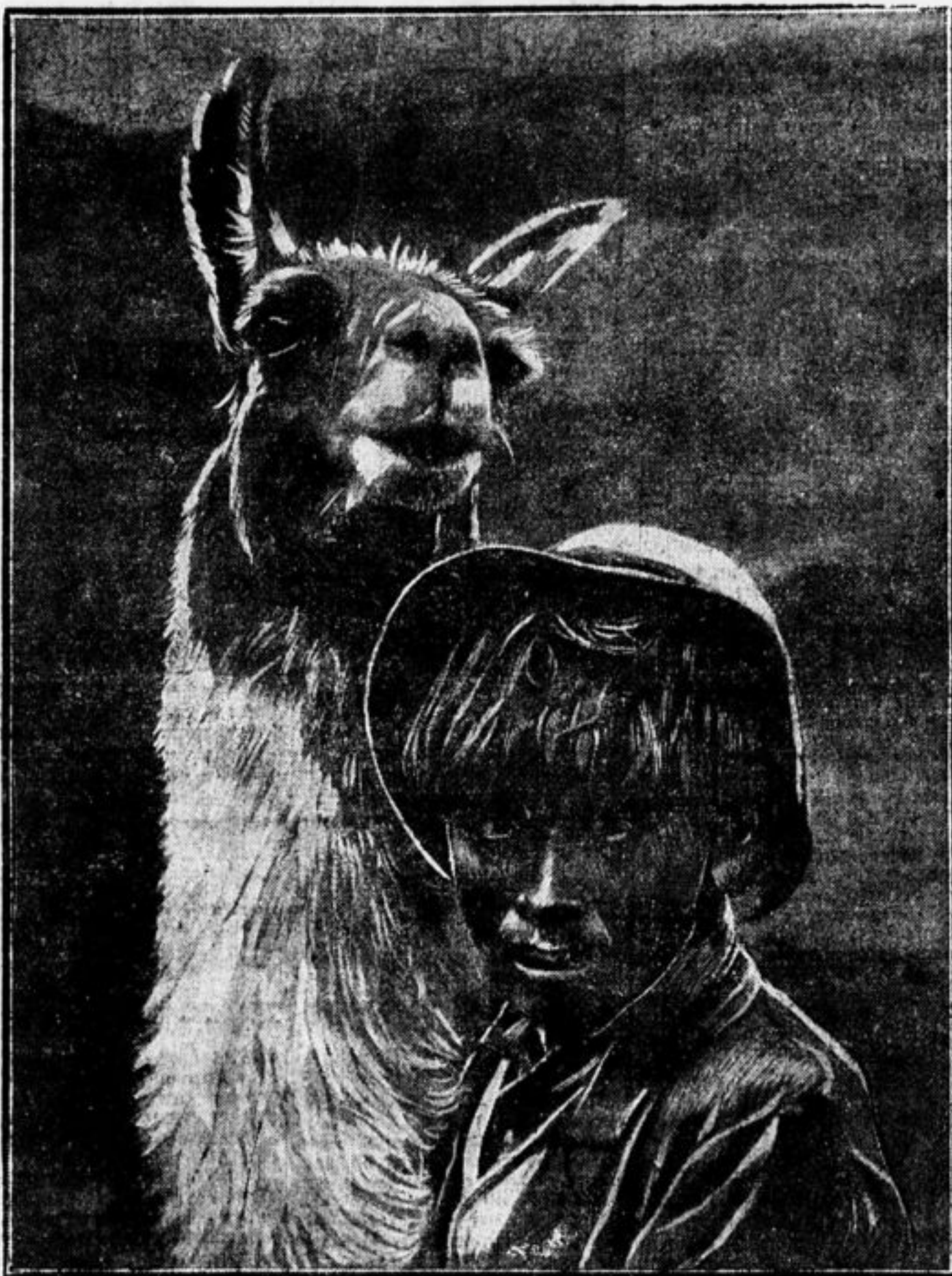
МАЛЬЧИК ИЗ БОЛИВИИ (Южная Америка) С ЛАМОЙ (южно-американский верблюд).

Да здравствует праздник единения и борьбы пролетарских ребят всего мира — 8 МДН!