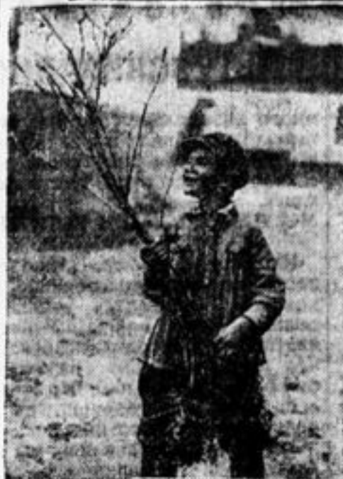
В руках цветет.