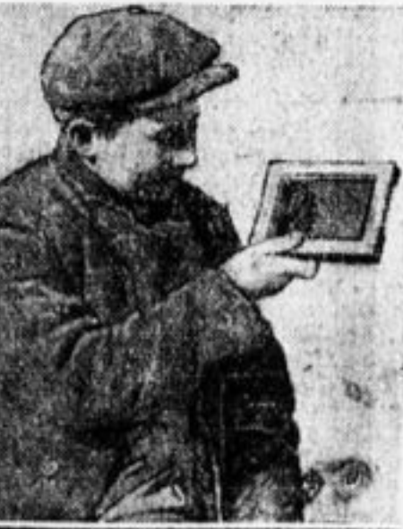
Где твои фото на конкурс?

Поповщина наступлет. И в первую очередь она хочет подчинить своему темному влиянию детей.