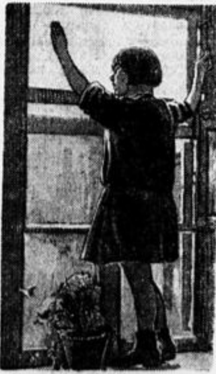
...Весна. Выставляется первая рама.