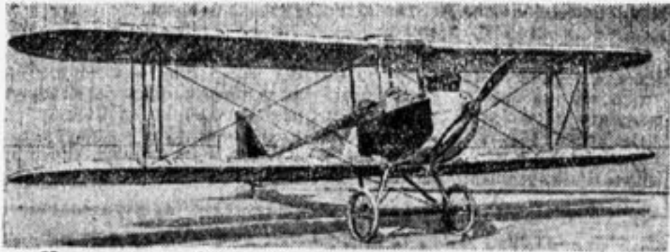
Наш самолет будет таким же легким и ловким.