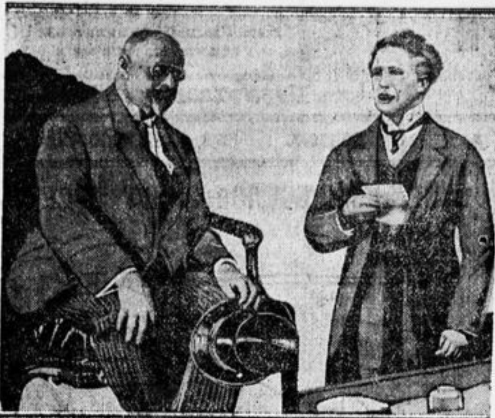
Угадайте, ребята, кто из этих двух господ король и кто социалист? (Ответ в след. №).