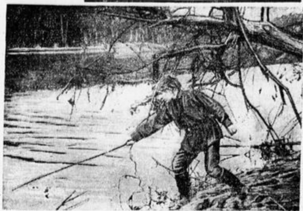
Ловля рыбы на реке Яузе в Сокольниках.