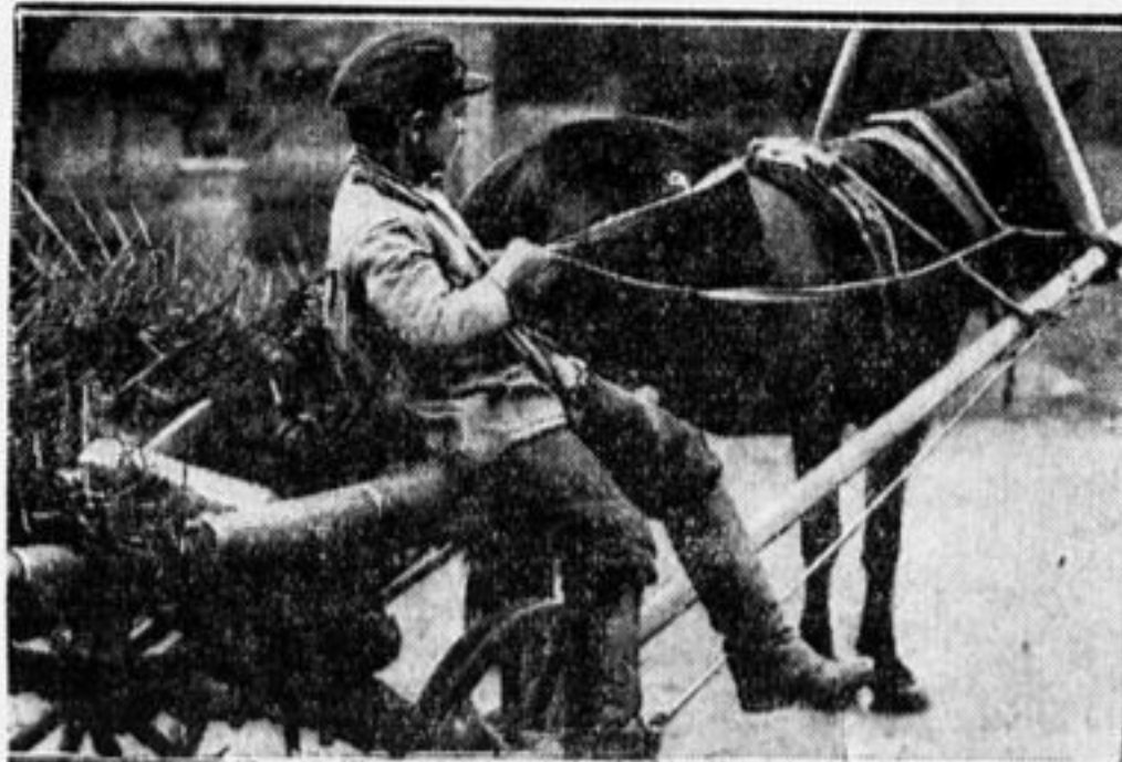
«День леса» в деревне: привез лесную рассадку.