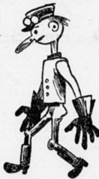
Наш шофер—Ваня Кокниос. Хороший парень. Длинный нос.

Вся масса ребят, выстроившись, отправляется в жел.-дор. клуб.