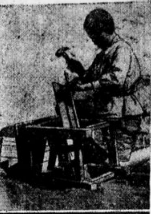
Один из многих.