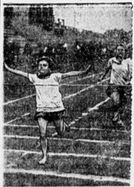
Финиш для девочек на 600 метров.