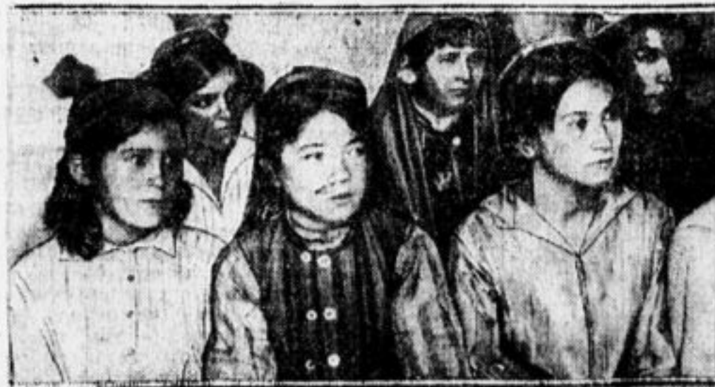
Женский клуб в Таджикистане.