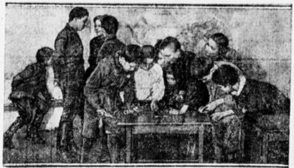
В школе. Игра во время перемены.