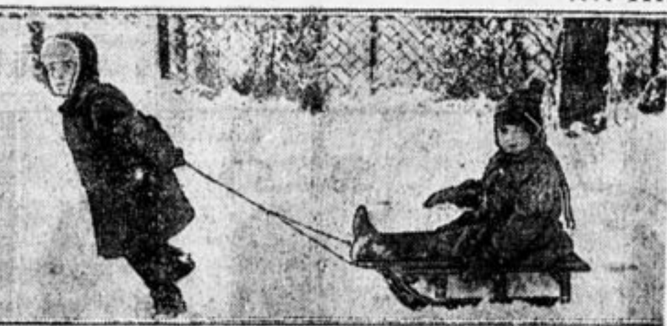
«Культурным походом съездим зумям добитися смерти «Зеленого Змия».

А на завтра горштаб получает бумажку: «В ответ на заявления пионеров о закрытии пивных и водочного магазина ТПО (транспортное потребительское общество) сообщаем, что выделена комиссия для обследования всех магазинов, торгующих напитками». И в городе и на селе пионерами взят под обстрел «зеленый змий». Недаром же на плакате демонстрантов одного из харьковских районов было: