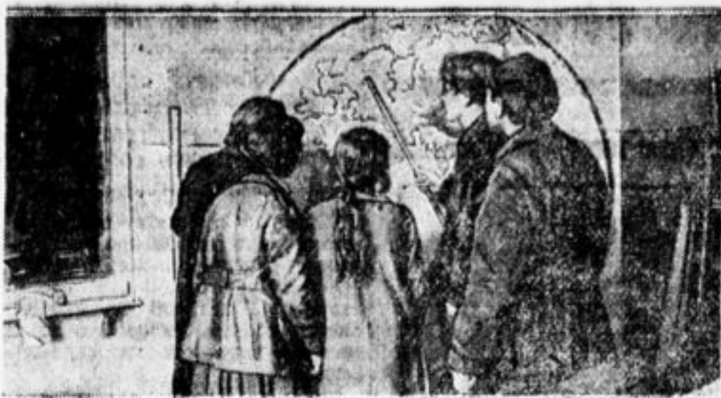
В 3-й школе ребята не забывают о карте. Карта—лучший помощник во время полтзанятий.