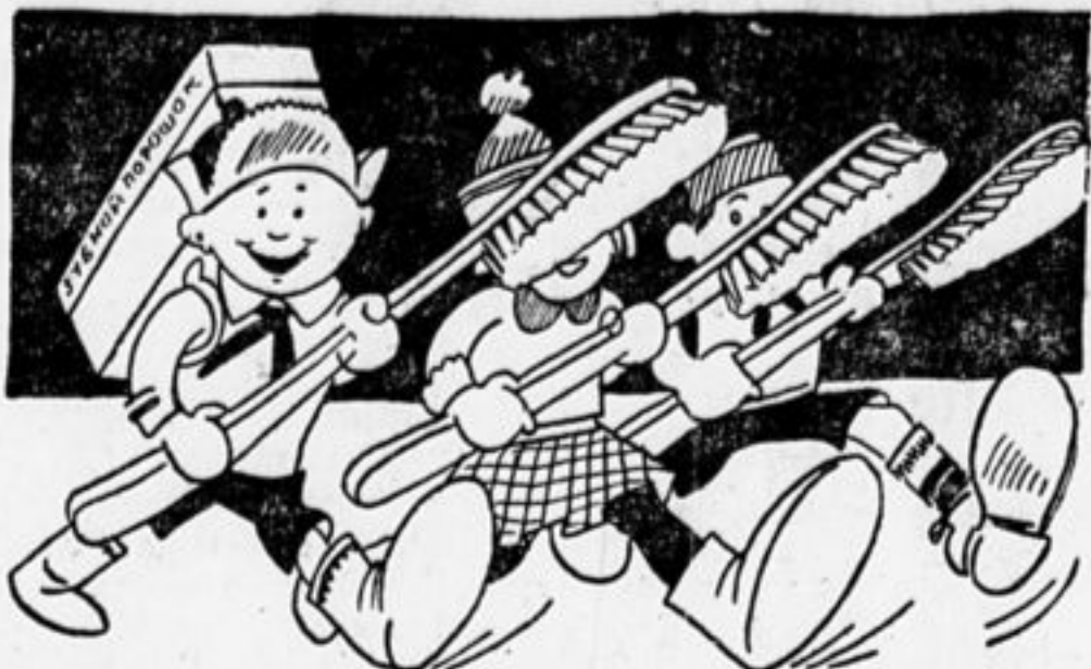
Быстро! Движемся походкой С порошком с зубною щеткой. Для крестьянских для ребят Шлет подарок наш отряд.

Но «адвокат» уверяет, что смеяться над ней не надо, виновна не она, а условия ее жизни. И суд решил: