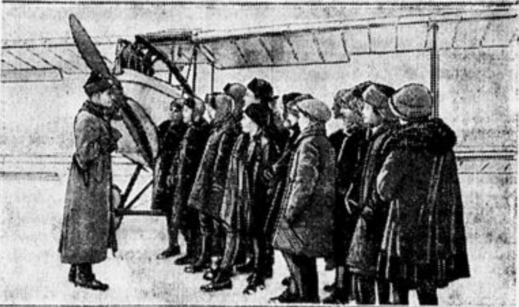
Экскурсия пионеров у авиэтки «Пионер».

Заслуживает внимания предвыборная работа школьников на дому. Каждый из учеников пове-