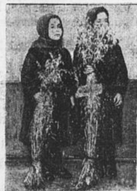
Живая диаграмма. Слева—школьница с овсом с крестьянского поля; справа—овес, за который коллектив «Красный Почин» получил на уездном конкурсе первую премию (село Каменка, Ереминской вол., Сергиевского у.).

Каждую школу и отряд сделаем фортом борьбы за урожай.