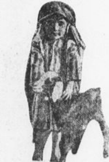
Арабская девочка. Ее одежда сделана из шерсти стоящей около ее козы.

По виду учеников нельзя было заключить, чтобы им действительно было нужно такое лишение. Родители большей части мальчиков этой школы были портными, а среди портных большая безработица. У многих мальчиков были синие круги под глазами, ни кровинки на лице.