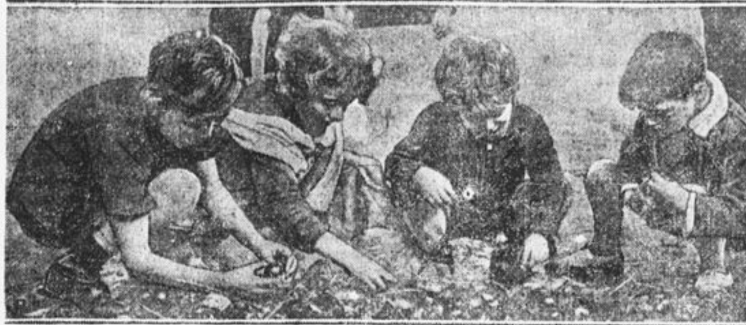
Ребята бедных кварталов Лондона роются на помойках в поисках еды.