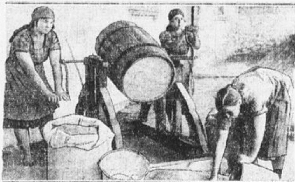
Промывка зерна медным купоросом.

Интересно, что этот 1-й звездно-лыжный пробег пионеров Мо-