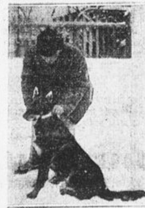
Посылают с донесением.

Однако, не всякая собака может взять на себя эту почетную боевую роль. Здесь нужны слух и зрение, которые будут острее