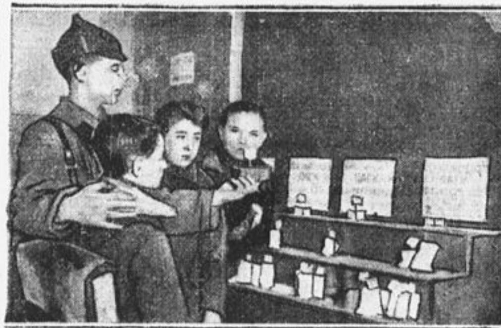
Занятия военно-химического кружка.

солидными знаниями и хорошо руководили топографическими и сигнальными кружками в школах.