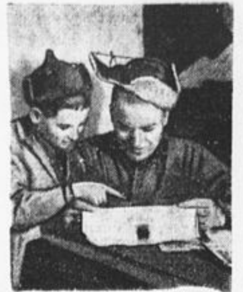
В красной казарме тоже читают «Пионер. Правду».

РАБОЧЕ - КРЕСТЬЯНСКОЙ КРАСНОЙ АРМИИ СЛАВНЫЙ ОДИННАДЦАТЫЙ ЮБИЛЕЙ! ПИОНЕР, ВНИМАНЬЕ КРАСНОЙ КАЗАРМЕ. ВНИМАНЬЕ ЗАЩИТНИКАМ СОВЕТСКИХ ПОЛЕЙ КРАСНОЕ ЗНАМЯ ВЫШЕ ВЗВЕЙСЯ ПУСТЬ В ПИОНЕРСКИХ БОДРЫХ РЯДАХ ВЫРАСТУТ ЗАВТРАШНИЕ КРАСНОАРМЕЙЦЫ БОЙЦЫ РЕСПУБЛИКИ ТРУДА