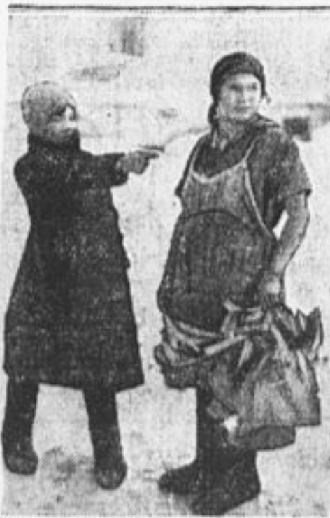
Сдавайте нам хлеб.