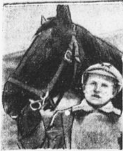
Бывший беспризорник — теперь кавалерист.

РАБОЧЕ - КРЕСТЬЯНСКОЙ КРАСНОЙ АРМИИ СЛАВНЫЙ ОДИННАДЦАТЫЙ ЮБИЛЕЙ! ПИОНЕР, ВНИМАНЬЕ КРАСНОЙ КАЗАРМЕ. ВНИМАНЬЕ ЗАЩИТНИКАМ СОВЕТСКИХ ПОЛЕЙ КРАСНОЕ ЗНАМЯ ВЫШЕ ВЗВЕЙСЯ ПУСТЬ В ПИОНЕРСКИХ БОДРЫХ РЯДАХ ВЫРАСТУТ ЗАВТРАШНИЕ КРАСНОАРМЕЙЦЫ БОЙЦЫ РЕСПУБЛИКИ ТРУДА