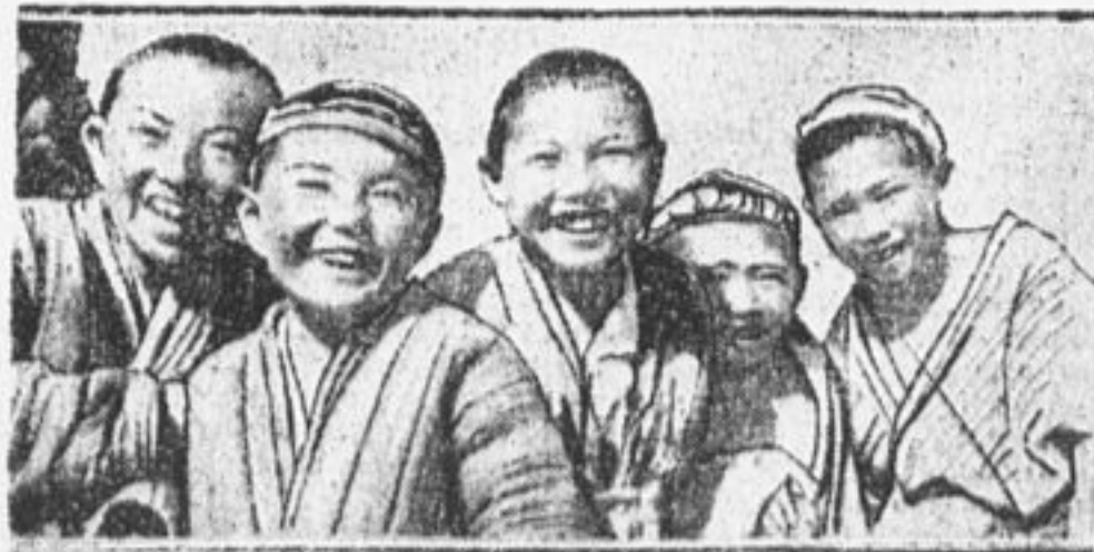
Узбекские школьники на Памире — «Крыше мира».

Сообщите немедленно, как принялись отряды и школы за эту работу!