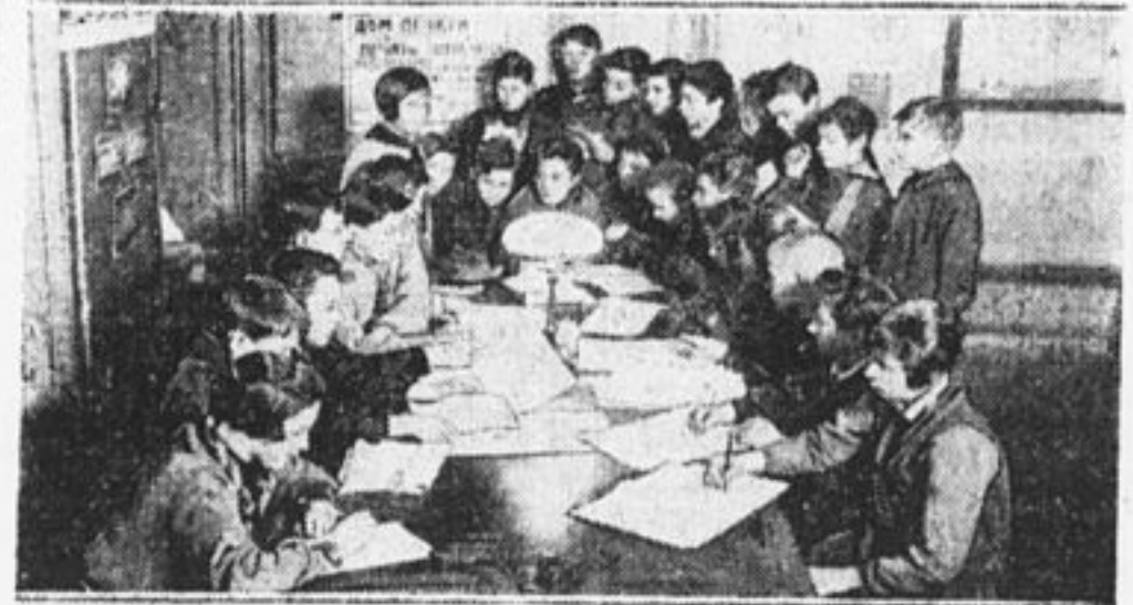
«Легкая кавалерия» «Пионерской Правды» в Ленинграде.