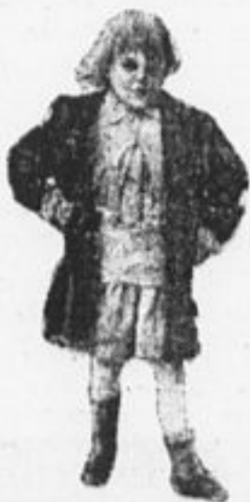
Дочь безработного горняка в Англии.