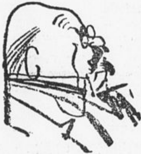
Это социалист? Ну и ну! «Друг» рабочих. Королю приятель. Явно за мир. Тайно за войну. Двойная игра. Скандал в результате.

Преступное лицемерие Франции разоблачено.