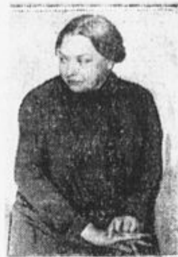
Тов. Н. К. Крупская.