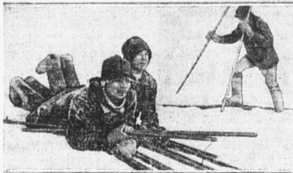
Пионеры на лыжах.