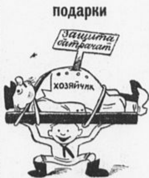
Внуки деда Ильича, Ребята-ильичата, Защищают батрачат. Злятся непачата.

4. Провести на общем сборе беседу о борьбе с национальной враждой. 5. Учесть домашнюю работу пионеров, чтобы, не мешая домашней работе, нагружать пионера в отряде и добиться участия каждого пионера в домашней работе. 6. В план зимней работы отряда внести проведение отрядом общественно-полезных дел. Как раз через несколько дней