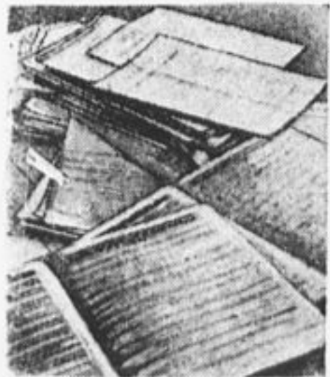
Эти предложения взяты из этой кучи анкет.

1. Усилить посещение производственных совещаний инженерно-техническим персоналом. 2. Необходимо развить самокритику, разъяснить лучше рабочим значение самокритики, добиться того, чтобы они не боялись критиковать хозяйственников и администрацию. 3. Дать возможность рабочим, живущим в деревне, участвовать в производственных совещаниях. 4. На должность мастеров