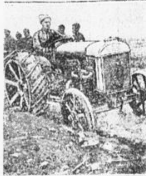
Красноармеец на тракторе.

Давайте разберемся. Стоило ли в самом деле прогнать царя, не губит ли советская власть сельское хозяйство?