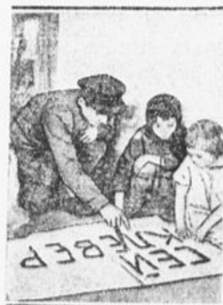
Школьники Маньковской школы I ст. пишут плакаты к посевной кампании.