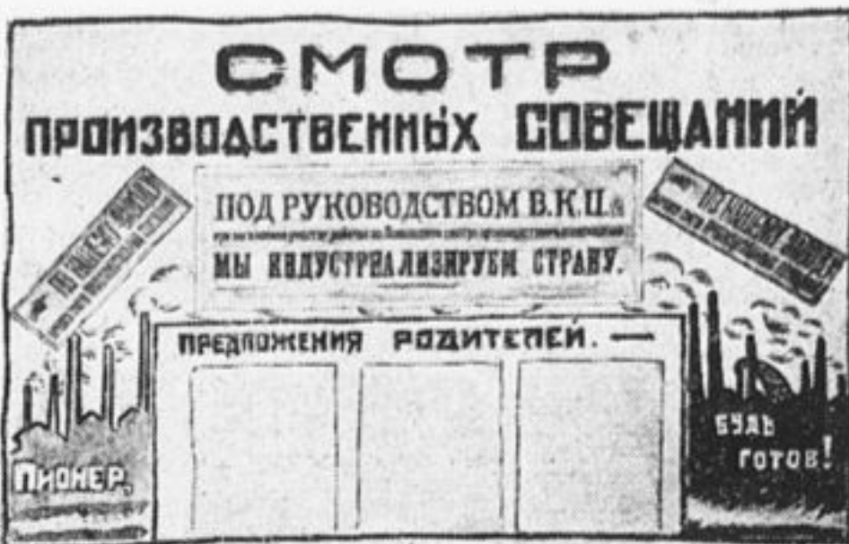
Плакат с предложениями родителей.