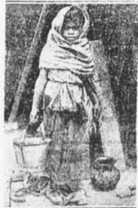
Девочка-работница в г. Мексико (Мексика). Из-за тяжелой работы она вызывает старуху.

* В 26-м отряде г. Смоленска ничего не сделано для подписки на «Барабан». Один пионер рассказал о «Барабане», но ребята пропустили это мимо ушей. В. Власенко.