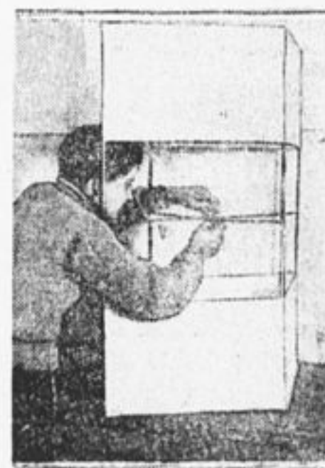
Делает бумажный змей.

* Пионеры 2 отряда Мантурова, Костр. губ., взяли на воспитание беспризорника. Корням его по очереди. Делегатки сшили для него одежду.