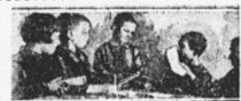
Это октябрята Колом. завода приносят анкеты своих родителей.

26 апреля открывается общезаводская производственная конференция. В этот день пионеры