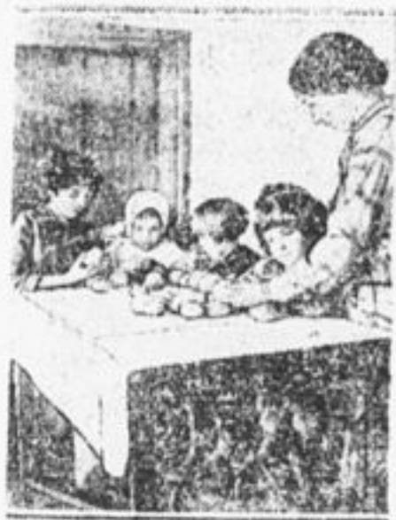
Отбор картофеля по сортам для посадки на школьном огороде Подосиновской школы I ступ.

Весна на дворе. Спешите с покупкой семян! Готовьте огороды! С. И. С.