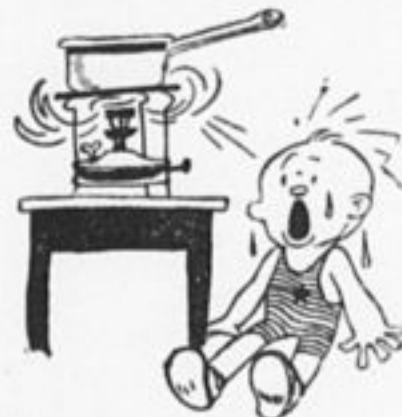
...А за летние недели октябрат похудели. Попытались бы вы сами загореть под примусами.

От редакции. Надо всем отрядам, уезжающим в лагерь, подумать о своей смене. Добивайтесь у рабочих устройства субботников на оборудование площадок и октябратских лагерей.