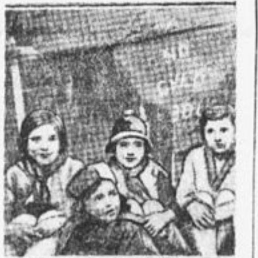
Английские пионеры на первомайской демонстрации

58 мальчиков города Торонто (Канада), которые работают в промышленной компании и собирают червей для уженья, объединившись забастовали и потребовали 20 проц прибавки к плате. Компания отказала в прибавке, надеясь на то, что мальчики скоро сдадутся. Прошло несколько дней, забастовка была в полном разгаре, — компания не получала ни одного червя, а рыболовы требовали их. Компании пришлось сдаться и удовлетворить требования забастовщиков.