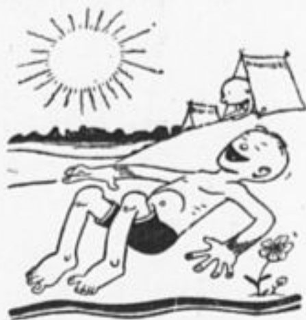
Позабыл совсем отряд в лагерь взять октябрат. Загорели, просто страх, пионеры в лагерях.