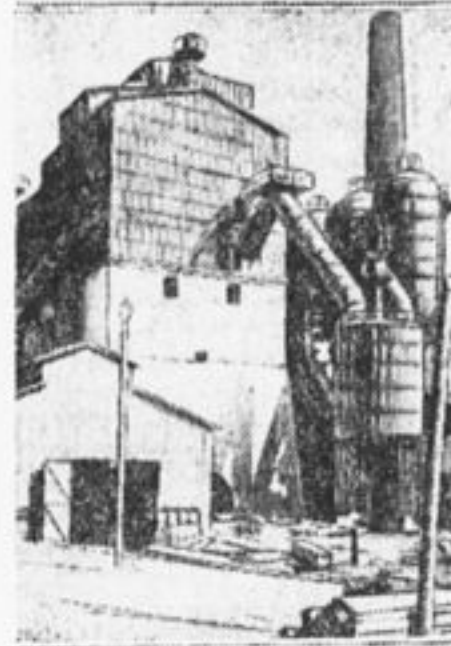
9 июня 1929 г. на Белорецком металлургическом заводе (Баш-республика) пущена новая домна, производительностью 150 тонн в сутки.