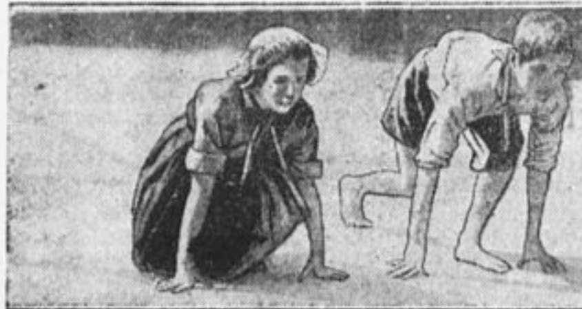
Готовятся к спартакиаде слета.