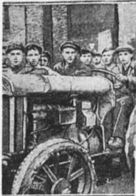
Трактор, восстановленный бригадой молодежи завода «Красн. Путиловец». Ремонт производился после окончания рабочего дня.