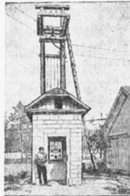
Совхоз «Горки». Трансформаторная будка.