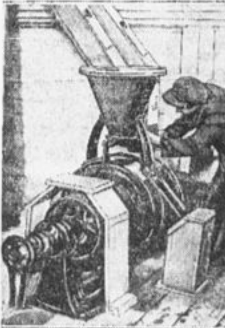
Электрическая мельница с вертикальными жерновами «Фермер». Применяется в некоторых крупных колхозах.

вырезки из газет, показывающие, как это строительство идет. Надо будет следить и отмечать, сколько мы собрали тонн урожая в совхозах, построили километров путей, выпустили инженеров и врачей, вывели стандарт леса, выработали тонн бумаги и т. д. и т. д.