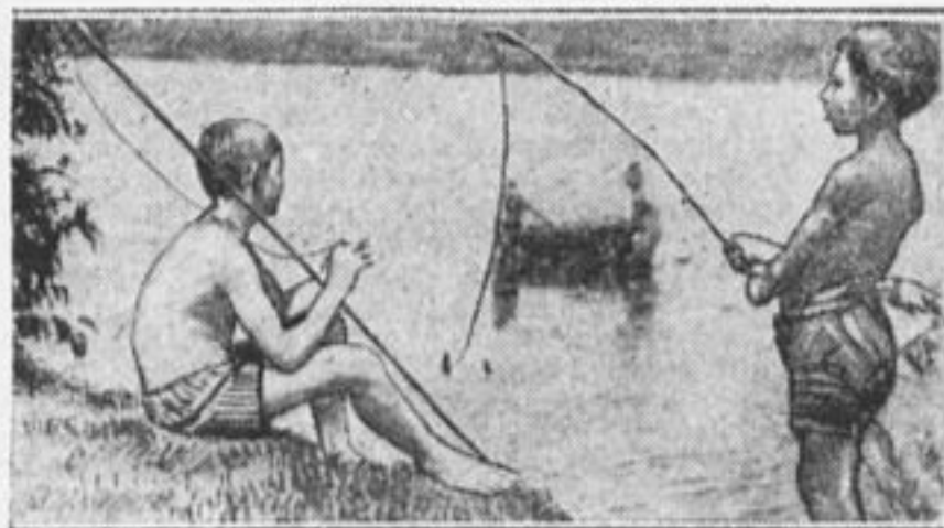
В свободный час.