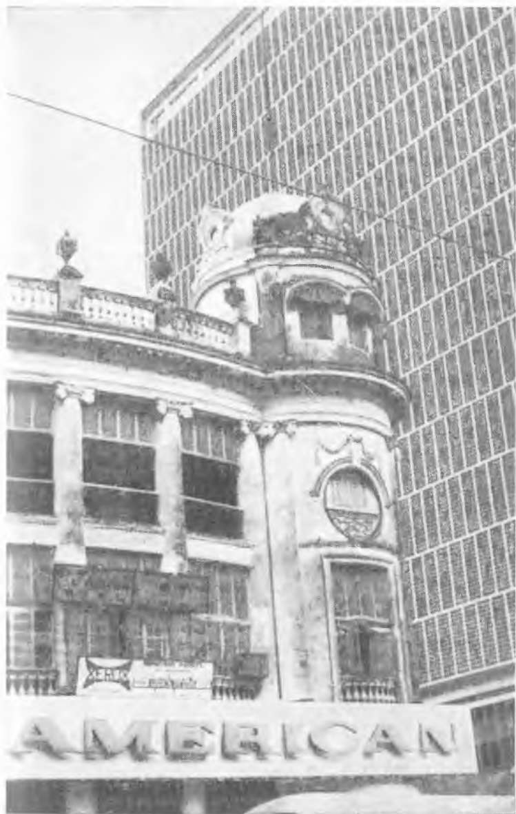
Калькутта: старая и новая