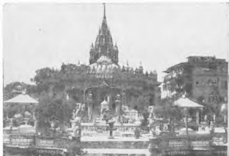
Читпур-роуд, «самая калькутская» улица Калькутты