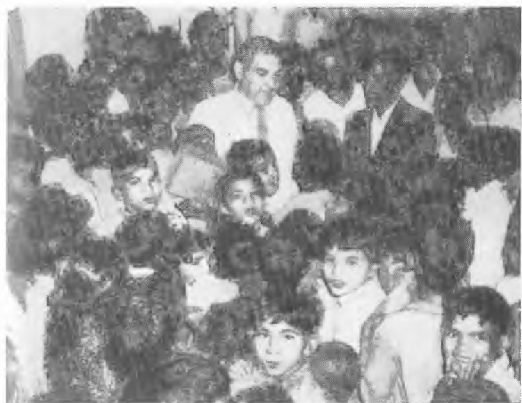
В каменных джунглях Калькутты В школе имени Ленина