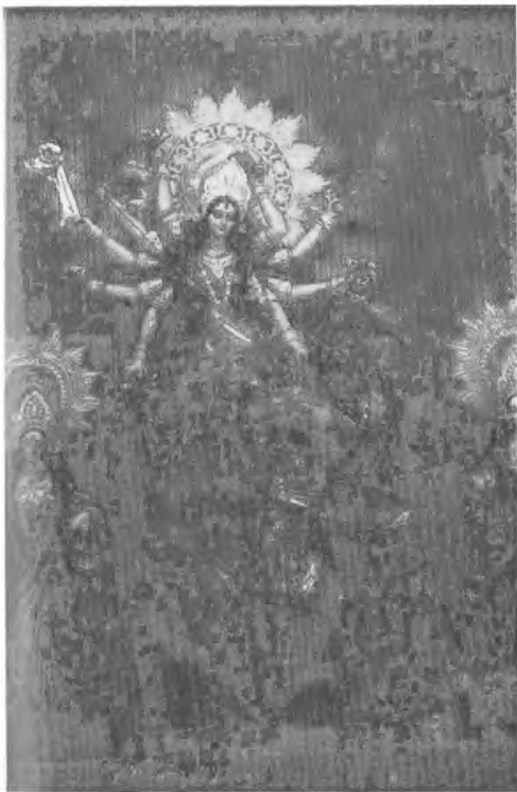
Богиня Дурга, поражающая демона. Одна из тысяч статуй, воздвигнутых на улицах Калькутты во время праздника Дурга-пуджи