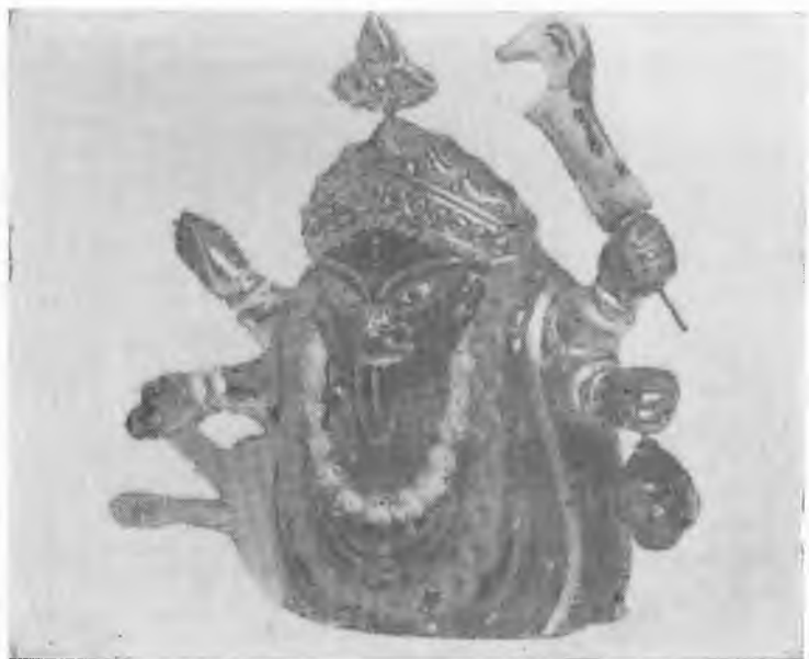
Час пик Богиня Кали. Современная глиняная игрушка