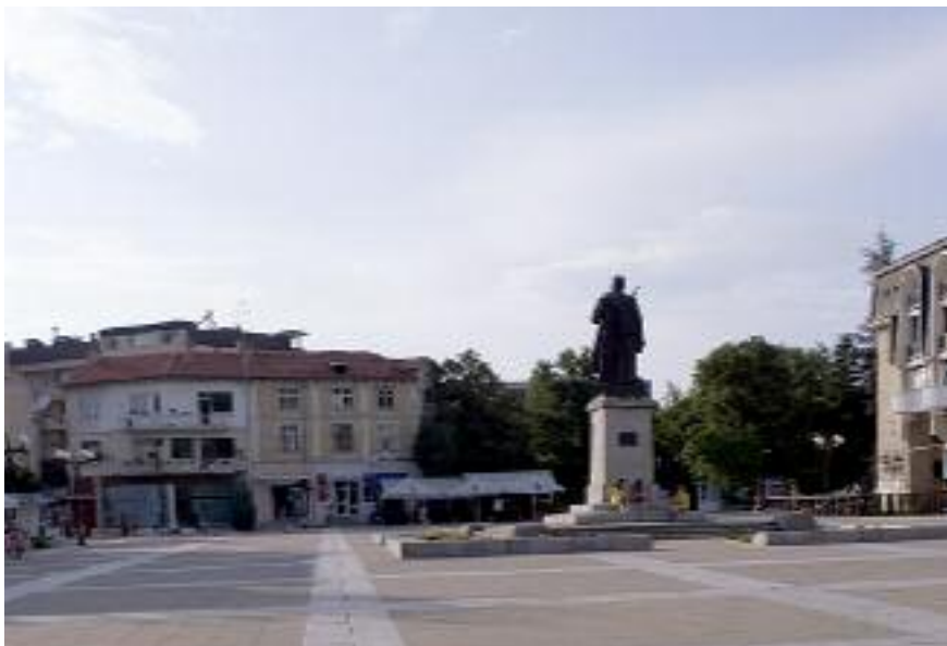
| Центральная площадь Благоевграда с памятником национальному герою Болгарии Гоце Делчеву

для неформального общения участников конвента. Что не помешало организаторам провести книжный аукцион и поэтические чтения. В час дня фестиваль объявили закрытым. Народ стал разъезжаться по домам.