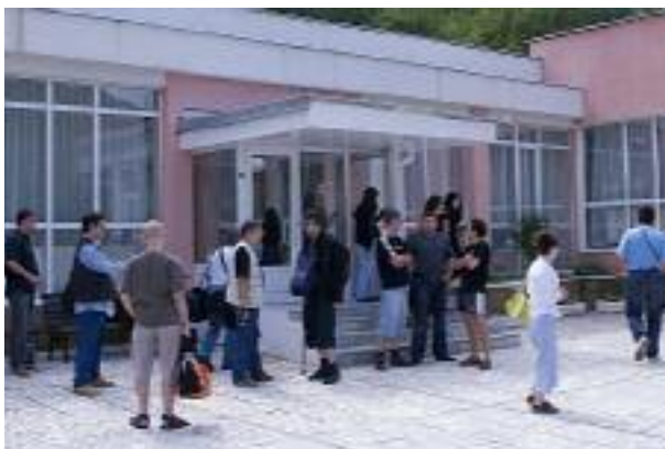
| Во дворе Университетского центра «Бачиново»

ского владычества город назвали Горна Джумая. И только после Второй мировой войны он обрел свое нынешнее имя, присвоенное городу в честь коммуниста Димитро Благоева. Сейчас в городе живет около 80 тысяч человек, так что вечерами в центре людно и весело, летние веранды кафе за-