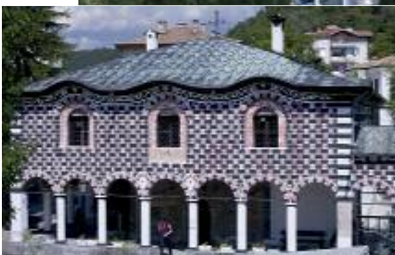
Исторический район Вароша. Церковь Успения Богородицы

Аргентины, Израиля, Индии, Испании, Италии и Казахстана. Такая активность объяснялась не только хорошей пиар-кампанией конкурса, но и вполне приличными денежными премиями. Жюри