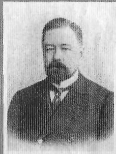
Кн. А. Д. Оболенский обер-прокурор Св. Синода (октябрь 1905 – апрель 1906)