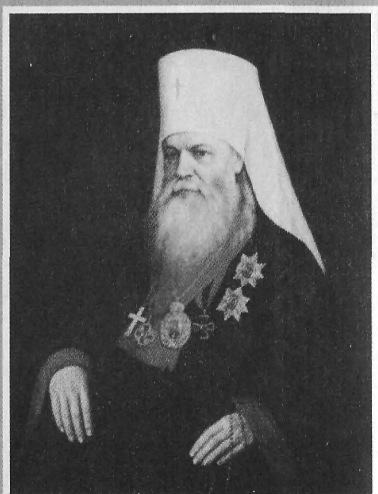
Митрополит Макарий (Булгаков)