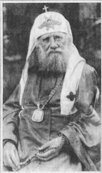
Святейший Патриарх Тихон (Белавин)