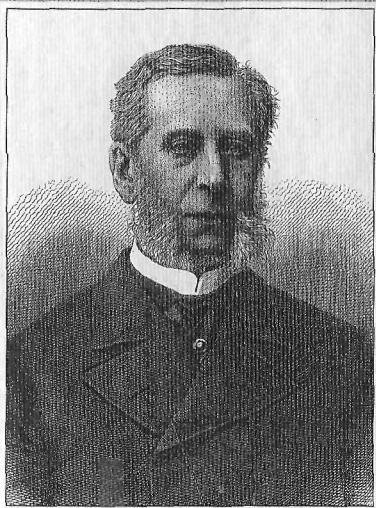
П. А. Валуев, председатель Комитета министров