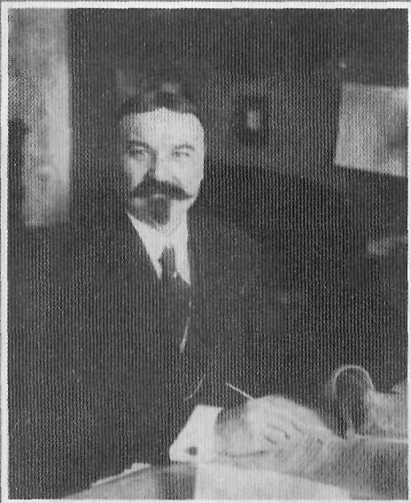
Н. П. Раев, обер-прокурор Св. Синода (август 1916 – март 1917)