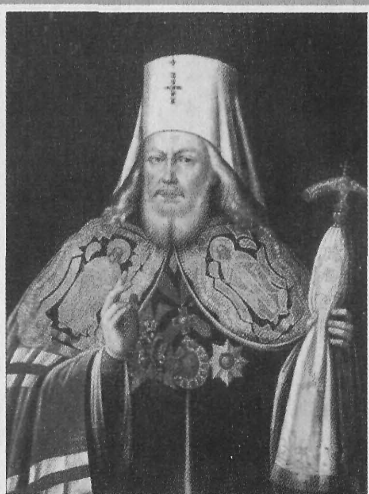
Митрополит Платон (Левшин)