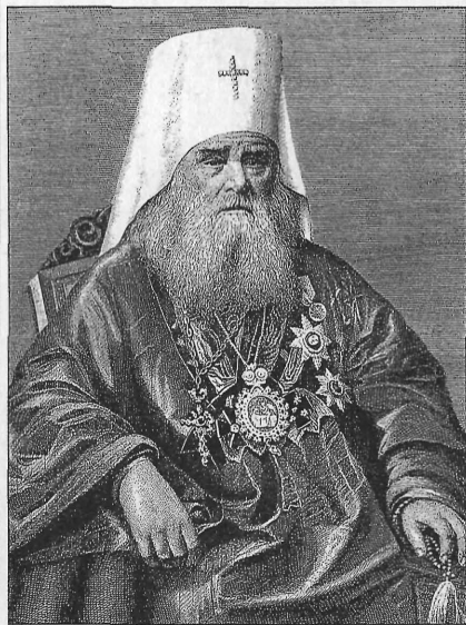
Святитель Иннокентий (Попов-Вениаминов)