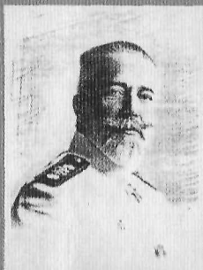
А. Н. Волжин обер-прокурор Св. Синода (октябрь 1915 – август 1916)