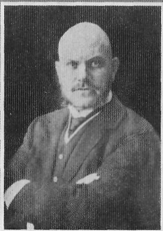
В. Н. Львов, обер-прокурор Св. Синода (март – июль 1917)