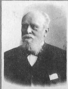
В. К. Саблер, обер-прокурор Св. Синода (май 1911 – июль 1915)