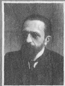
Кн. А. А. Ширинский-Шихматов, обер-прокурор Св. Синода (апрель – июль 1906)