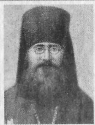
Архиепископ Сергей (Страгородский)