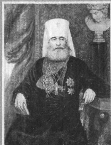
Митрополит Антоний (Вадковский)