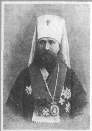
Митрополит Владимир (Богоявленский)