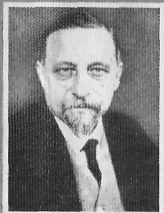
А. В. Карташев, обер-прокурор Св. Синода (июль – август 1917)