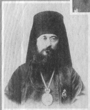
Епископ Евлогий (Георгиевский)