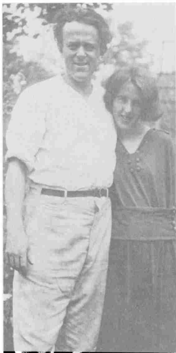
Джон Рид и Луиза Брайант. Нью-Йорк, перед революцией