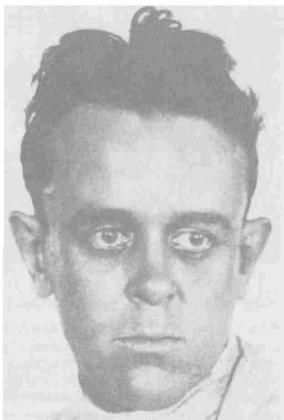
Джон Рид после ареста финскими властями и заключения в Або в начале 1920 года. Рид пытался вернуться в Соединенные Штаты и вступил на борт финского корабля, направлявшегося в Швецию. Несколько недель его продержали в одиночной камере