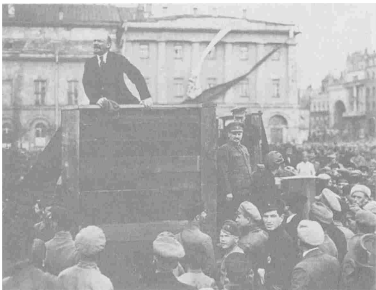
Ленин на площади Свердлова обращается к солдатам перед их уходом на фронт