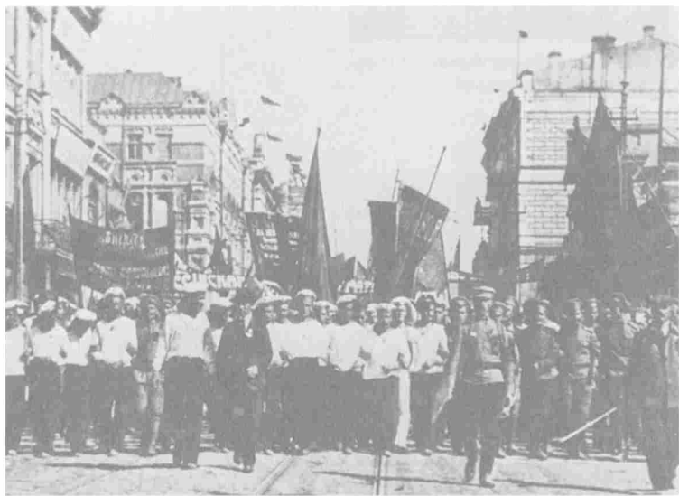
Майский день во Владивостоке в 1917 году перед революцией. В 1918 году Вильямс провел там два месяца перед отъездом домой