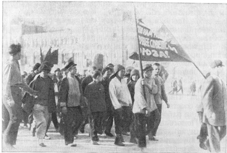
Бывшие беспризорные на Красной площади в Москве. 1925 г.

него гудка во всех цехах кипела работа. Не было ни одного уклонившегося. Дружно поработали краснобогатырцы. 175 тысяч рублей передали они в фонд недели. А закончился воскресник кратким митингом и пением «Интернационала» 86 .