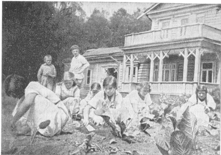
Юнресовцы за работой на огороде.

воспитанников оказался тринадцатилетний парнишка, который, хотя и носил пионерский галстук, отличался не дисциплинированностью, неуживчивостью. Он уже побывал в трех детских домах, везде ссорился с товарищами, не подчинялся распорядку дня. Не раз обсуждали его поведение на совете отряда — главном органе самоуправления пионердома, на общем отрядном сборе. Ничего не помогало. Некоторые члены совета отряда, наконец, внесли предложение: давайте попросим перевести его в обычный детский дом, он звание нашего пионерского дома позорит.