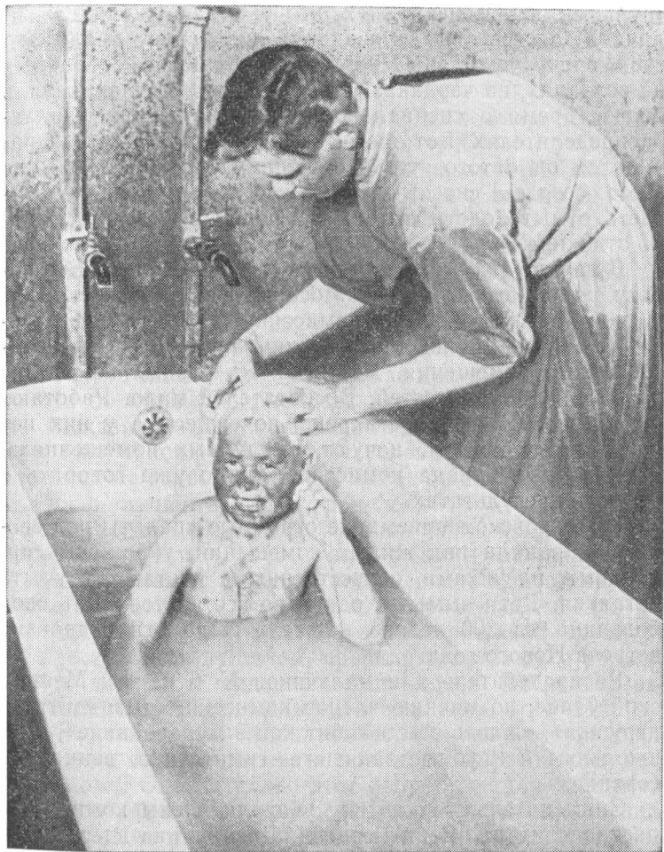
В санитарной комнате Покровского детприемника.