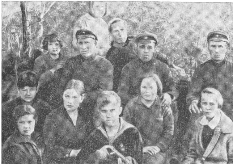
Воспитанники «Юной республики» с шефами-красноармейцами.

но» 14 . И дальше в решении — распределение заданий: кто будет чинить электропроводку в пока еще неблагоустроенном здании, кто заготавливать топливо, кто приводить в порядок двор и т. д.