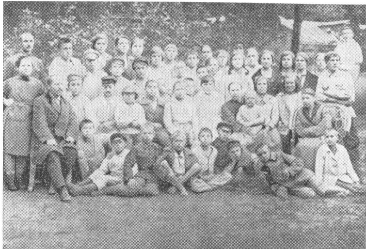
Пушкинская детская сельскохозяйственная колония. 1923—1924 гг.

муны — благоустройство, оборудование помещений мебелью, содержание воспитанников удовлетворяются исключительно силами коллектива. Для достижения этих целей организуются мастерские, проводятся работы в поле, в саду, на огороде» 2 .