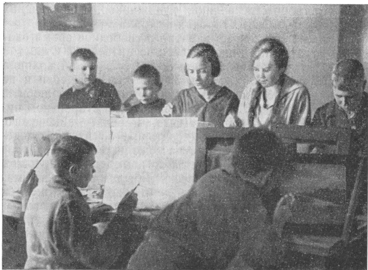
Воспитанники «Юной республики» на занятиях в изокружке.

игры выносливости, ловкости, смекалки. Часами ребята могли бегать, прятаться, упражняться в меткости. Увлекались и спортивными играми. Правда, долго не было в детдомах настоящего спортивного инвентаря. Только в конце 20-х годов пришел к ним волейбол и баскетбол. А вот в футбол, чаще всего мячами, сделанными из тряпок, из обрезков кожи, мальчишки играли целыми днями. И наловчились, случалось обыгрывали своих соперников из соседних поселков и деревень. Любили воспитанники и зимние виды спорта — лыжи, коньки. Настоящих лыж тоже долго не было. Делали их сами: приколачивали ремешки к дощечкам от разломанных старых бочек. Без палок, на таких самоделках уходили в горо-