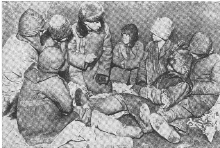
Беспризорные дети. 1924 г.

ситься бережно даже к тем, кто невольно стал на путь нарушения законов. «Для детей в Советской России нет ни судов, ни тюрем» 11 , — напоминала Деткомиссия в одном из своих обращений ко всем исполкомам Советов и уполномоченным по борьбе за улучшение жизни детей.