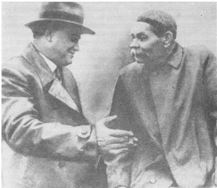
Георгий Димитров и Максим Горький. 1934 год.

И сегодня сохранили свою силу слова Георгия Димитрова, что отношение к Советскому Союзу является пробным камнем для проверки искренности и честности каждого деятеля рабочего движения, каждой рабочей и комму-