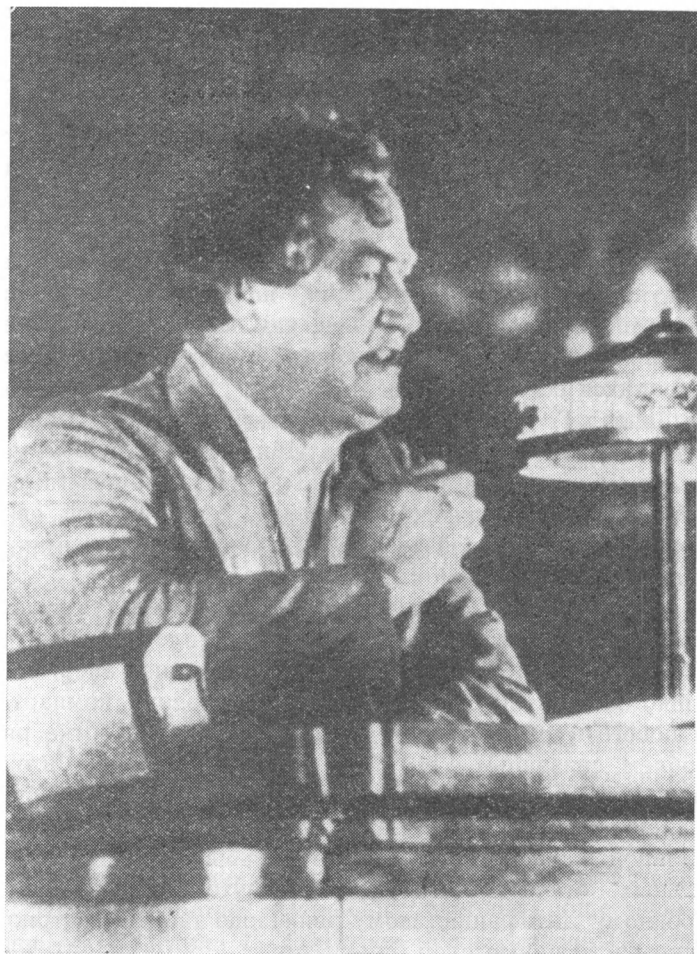
Георгий Димитров выступает с докладом на VII конгрессе Коммунистического Интернационала. Москва, 2 августа 1935 года.