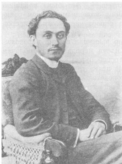
1904—1905 годы. Георгий Димитров — секретарь софийской партийной организации.

организоваться для классовой борьбы, которая нарастает. «Мы, — говорил Г. Димитров, — готовимся всеми силами к этой единственной освободительной войне, которая вместо смерти и разрухи, приносимых нынешними войнами и кровавыми авантюрами, обеспечит вечный мир, свободу и счастье всем народам».