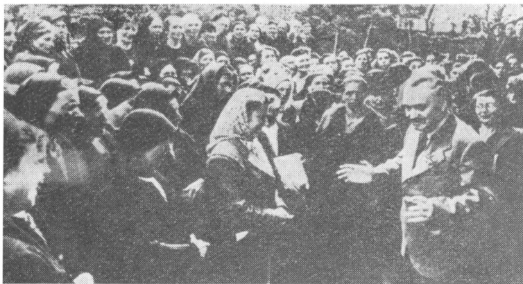
Встреча Георгия Димитрова с родными погибших партизан. София, 6 мая 1947 года.

Воспитанная Г. Димитровым в духе верности марксизму-ленинизму и пролетарскому интернационализму, в духе революционной непримиримости и настойчивости в достижении целей, Болгарская коммунистическая партия продолжила борьбу без Г. Димитрова — по-димитровски. Сегодня, через двадцать три года после смерти Г. Димитрова, мы можем с законной гордостью заявить, что его