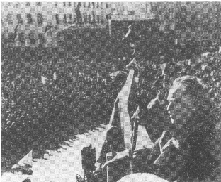
Георгий Димитров выступает на многотысячном митинге, посвященном заключению договора между НРБ и СССР. София, 24 марта 1948 года.

Для укрепления экономических и политических основ народно-демократического строя решающее значение имели подготовленные под непосредственным руководством Г. Димитрова законы о конфискации имущества, приобретенного незаконным путем, о трудовой земельной собственности (аграрной реформе), закон о ликвидации монархии и создании республики. На референдуме народ