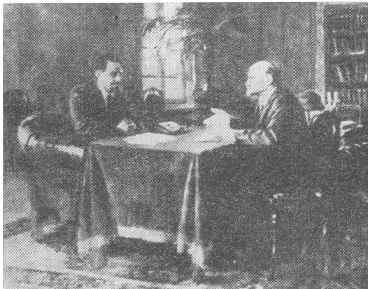
Владимир Ильич Ленин и Георгий Димитров. Москва, 1921 год.

Важную роль в развитии БКП сыграли и решения III конгресса Коминтерна, прошедшего под лозунгом «В массы». Состоявшийся в 1922 г. IV съезд БКП принял разработанную В. И. Лениным и утвержденную III конгрессом Коминтерна тактику единого фронта.