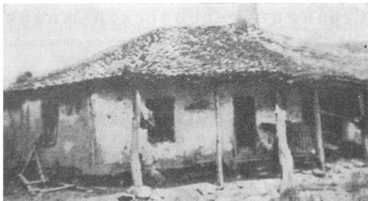
Дом, в котором родился Георгий Димитров.